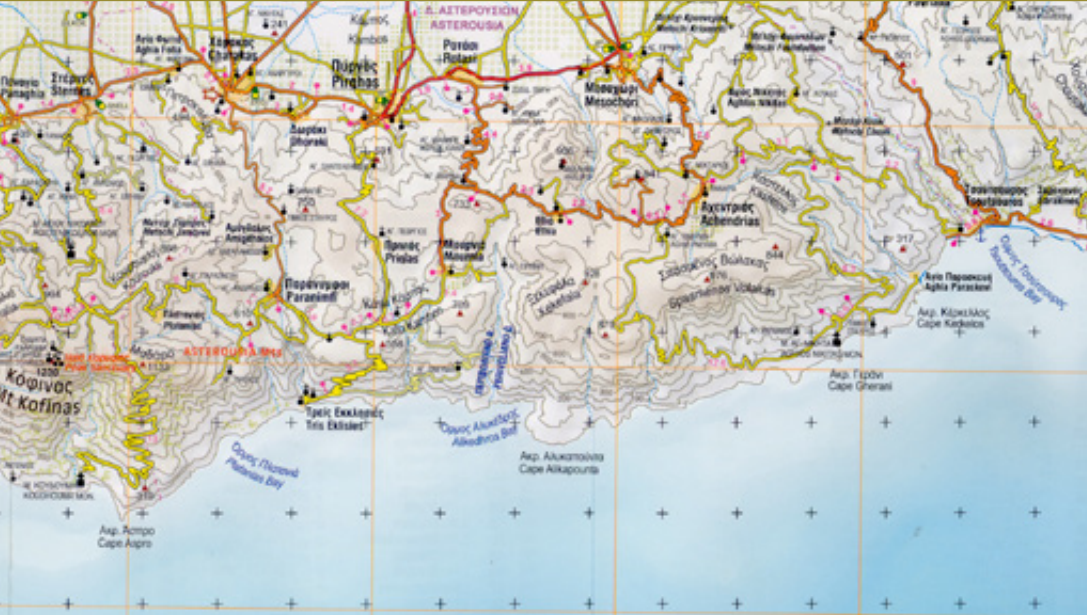
Από το χάρτη ΗΡΑΚΛΕΙΟ - ΡΕΘΥΜΝΟ Τοπο 100 των Εκδόσεων Ανάβαση.