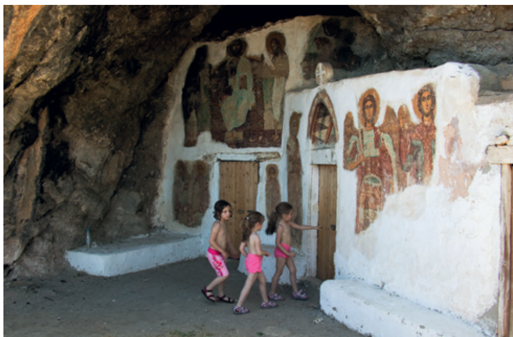
Θεανώ και Γωγώ Σκορδαλάκη, μαζί με την Αθηνά Μπασγιουράκη, μπροστά στην είσοδο του σπηλαιώδους Αη-Γιάννη. Υποβλητικό το εσωτερικό του ναΐσκου με θερμοκρασία πολύ χαμηλότερη από το εξωτερικό περιβάλλον.