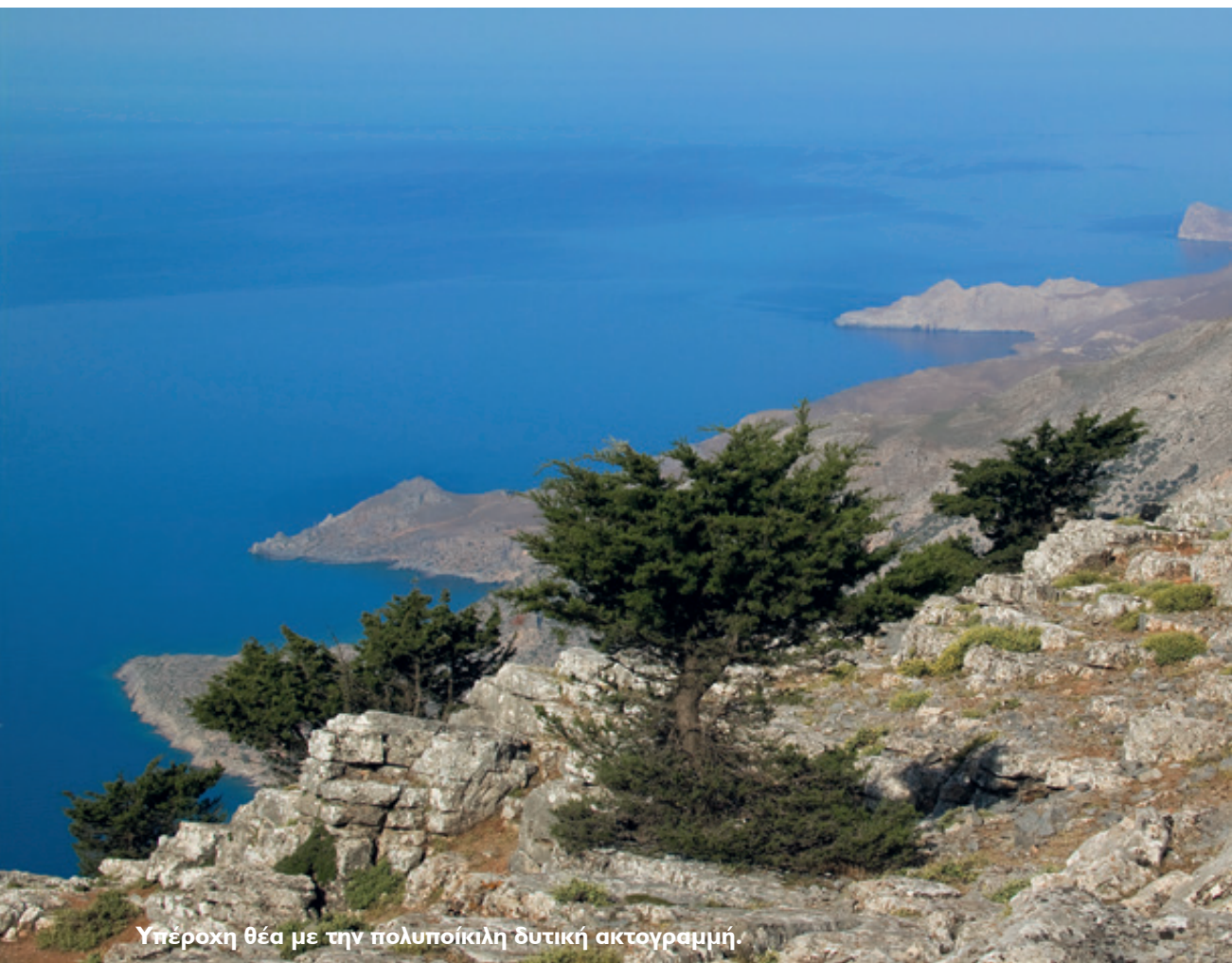
Υπέροχη θέα με την πολυποίκιλη δυτική ακτογραμμή.

ναρπαστική ακτογραμμή με τους αλλεπάλληλους κόλπους και ακρωτήρια προς τα δυτικά. Στα Ν απλώνεται αχανές το Λιβυκό, ενώ στα Β, εξαιτίας της θολής ατμόσφαιρας, περισσότερο υποψιαζόμαστε παρά διακρίνουμε τα νερά του Κρητικού.