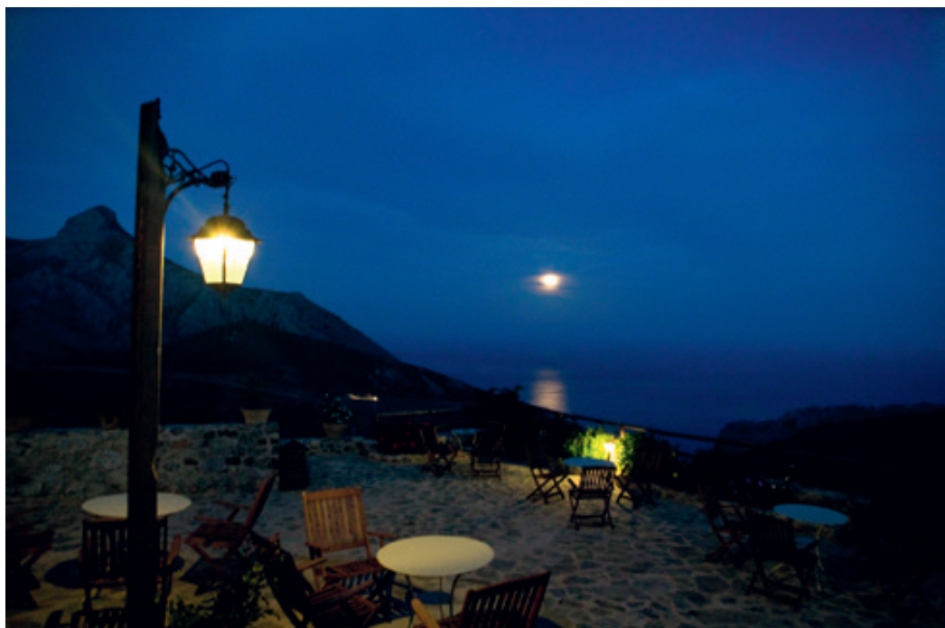
Πανσέληνος στο Λιβυκό απ' το καφεενεδάκι της Θαλόρης. Ο χαρακτηριστικός βράχος στην παραλία της Τρυπητής. (αριστερά)

κροσκοπική βοτσαλωτή παραλία με εκπληκτικής διαφάνειας νερά.