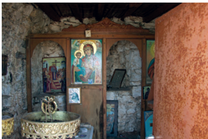
Κορυφή Κόφινας, 1231μ. Ιούnius 2009 (επάνω) Εσωτερικό της εκκλησούλας του Τιμίου Σταυρού.

σε χρήση μέχρι τις αρχές του 7 ου π.Χ. αιώνα, οπότε εγκαταλείφθηκε για να δραστηριοποιηθεί εκ νέου στους ύστερους ελληνιστικούς χρόνους.