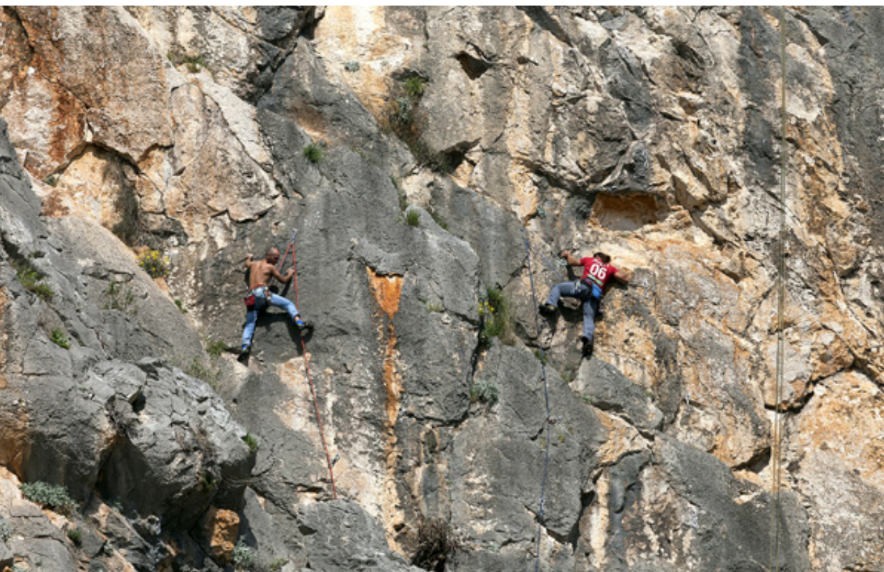
Αναρριχητές στο αρμάτωμα διαδρομών στο αναρριχτικό πεδίο Μαύρων Βουνών.

Η Λιμνοθάλασσα του Πρόκοπου δέχεται τα νερά του ποταμού «Λαρισσού» , που αποχετεύει τα επιφανειακά νερά και τα στραγγιστικά νερά του αρδευτικού δικτύου «Πννειού» . Στην λιμνοθάλασσα του Πρόκοπου, όπως και στις υπόλοιπες, ασκείται ιχθυοκαλλιέργεια «Εκτακτικής Μορφής» . (2) Εμφανίζεται όμως και το φαινόμενο της λαθροθηρίας, που τις περισσότερες φορές συμπίπτει με την επίσημη κυνηγετική περίοδο, από τις 20 Αυγούστου ως το τέλος Φεβρουαρίου. Το είδος που αποτελεί τον βασικό στόχο των λαθροκυνηγών είναι η «Φαλαρίδα» , γνωστή στην περιοχή ως «μπάλιζα» ή «μαυρόκοτα» ( Fulica atra ). Η λαθροθηρία κατά την εαρινή μετανάστευση αποτελεί σοβαρότατο