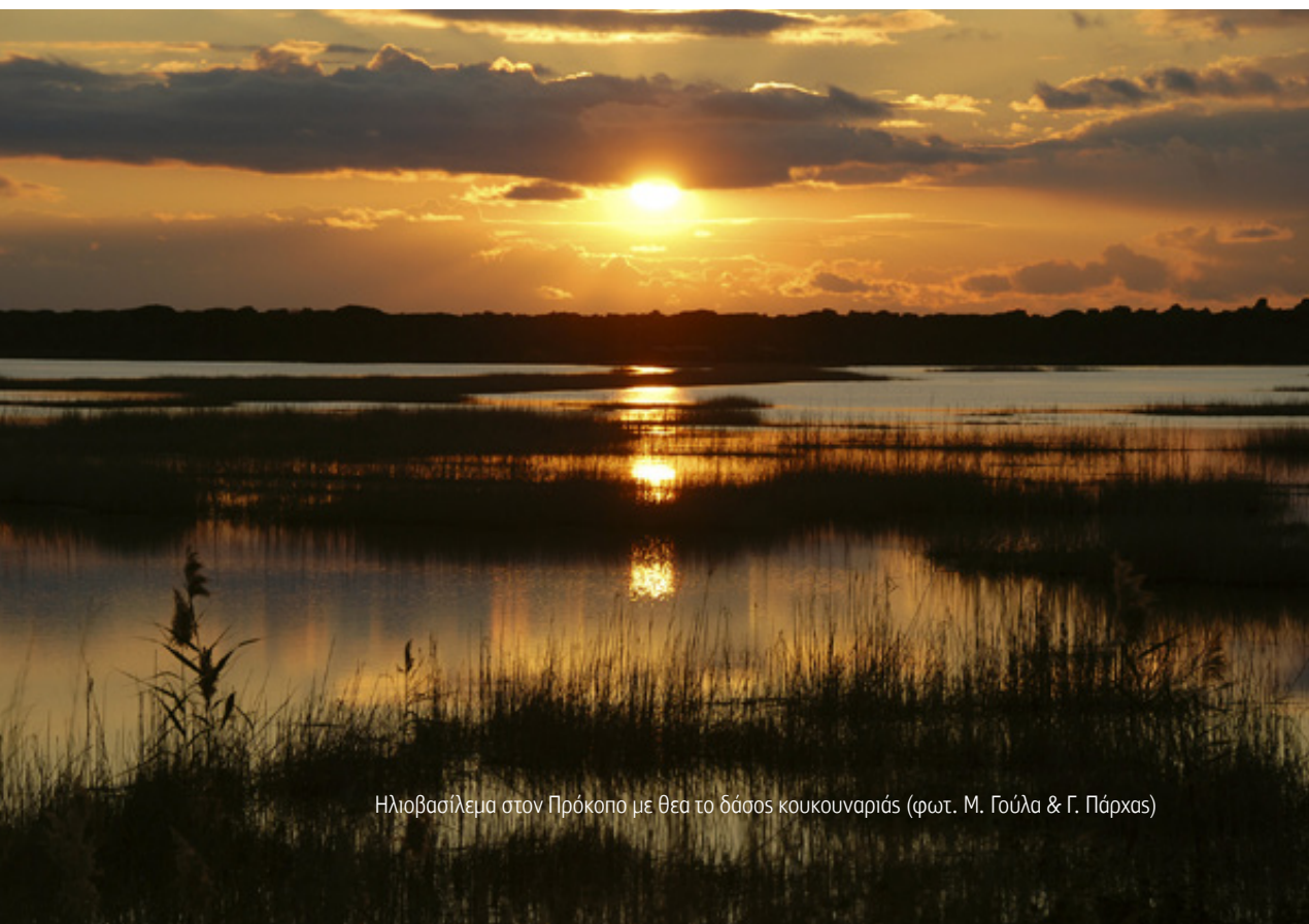
Ηλιοβασίλεμα στον Πρόκοπο με θεα το δάσος κουκουναριάς