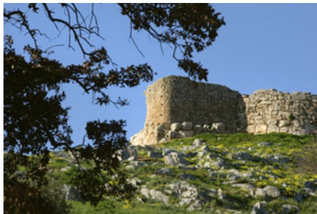
Τείχος Δυμαίων.

Έχοντας ολοκληρώσει την γνωριμία μας με τα βόρεια όρια της προστατευόμενης περιοχής, επιστρέφουμε στα Μαύρα Βουνά και κατευθυνόμαστε ανατολικά στην παραλία Καλογριά . Την εποχή τούτη είναι ερημική η περιοχή. Την θερινή περί-