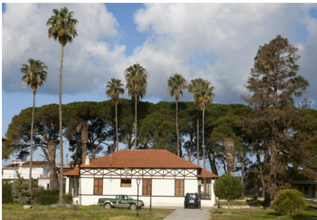
Το Κέντρο Πληροφόρησης Υγροτόπων Κοτυχίου-Στροφυλιάς στον Λάππα.

και η ενημέρωση για την οικολογική σημασία της περιοχής, η ευαισθητοποίηση των πολιτών και η υλοποίηση προγραμμάτων περιβαλλοντικής εκπαίδευσης, ξενάγησης και οικοτουρισμού. Προτεραιότητες είναι η διατήρηση και ενίσχυση της Κουκουναριάς ( Pinus pinea ), η παρακολούθηση στις λιμνοθάλασσες της ποιότητας του νερού, καθώς και η προστασία στην παραλιακή ζώνη των αμμολόφων.