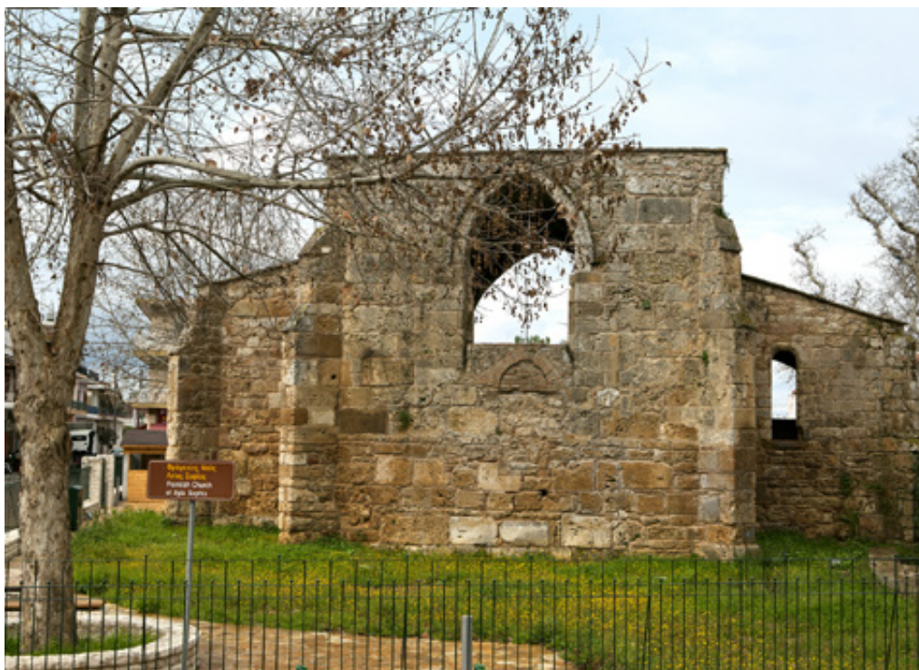
Τα υπολείμματα του περιφρουρού φράγκικου ναού της Αγίας Σοφίας στην Ανδραβίδα.

τοιχοί εξέχουν μερικά εκατοστά, σαν ευθύγραμμοι σκόπελοι πάνω στο νερό. Οι αποστάσεις τους ποικίλλουν, από 50 περίπου ως 100 μέτρα από την ακτή. Αμέσως μετά βρίσκουμε έναν ελαφρά ανηφορικό, χορταριασμένο δρομίσκο προς το εσωτερικό. Σ' ένα 5 λεπτό μας βγάξει στην ράχη του ακρωτηρίου. Εδώ συναντάμε τα σημαντικά ερείπια του Φράγκικου κάστρου της Γλαρέντζας , που κατέστρεψε το 1430 ο Βυζαντινός Αυτοκράτορας Κωνσταντίνος Παλαιολόγος για να μην καταληφθεί και χρησιμοποιηθεί στρατηγικά από τους Τούρκους. Συναντάμε επίσης, τον ερειπωμένο Φράγκικο καθεδρικό ναό της Γλαρέντζας, που χρονολογείται στον 13 ο αιώνα.