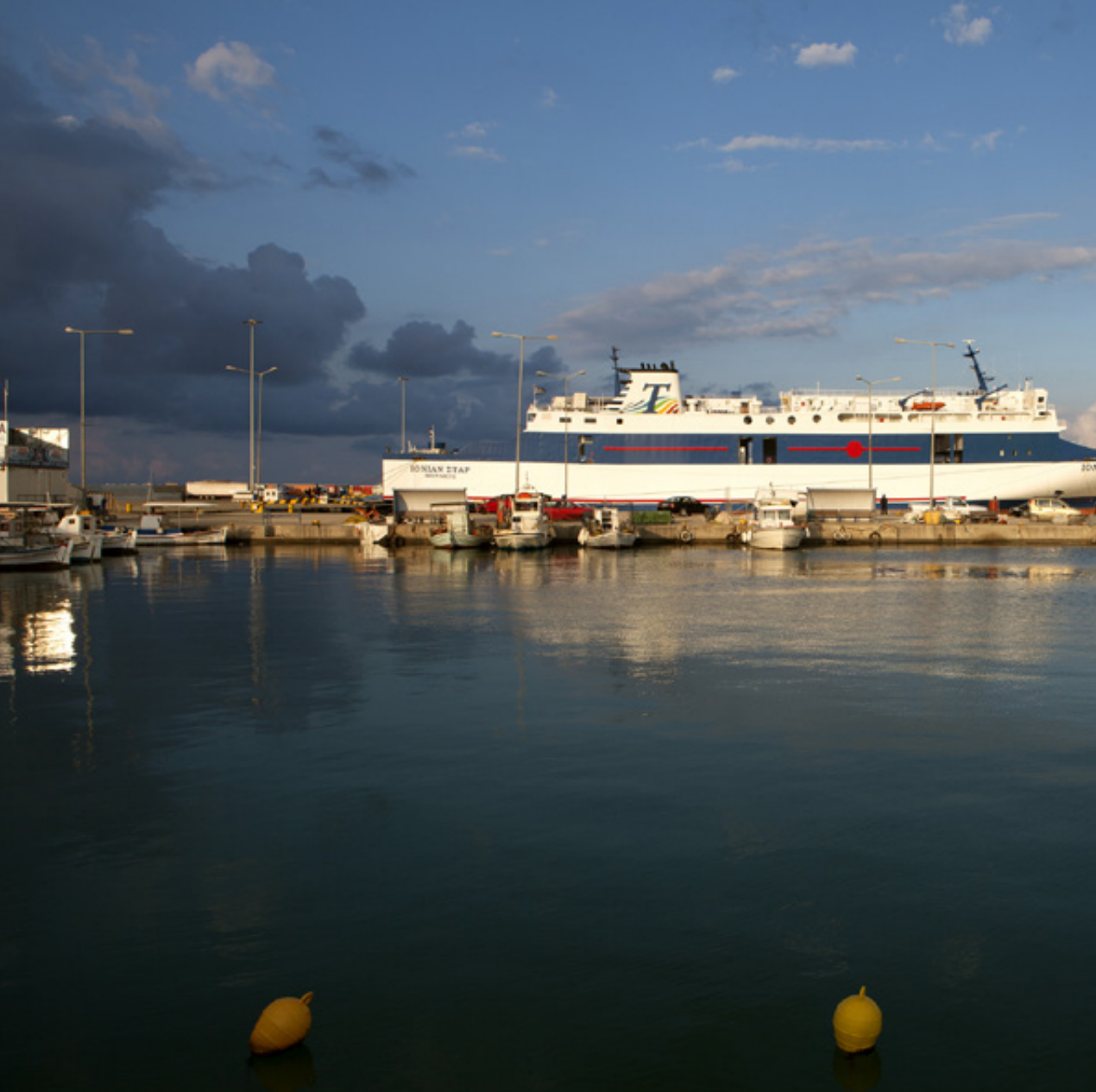
Στο λιμάνι της Κυλλήνης.

οικοτόπων, στον Ελλαδικό χώρο μοναδικό. Που περιλαμβάνει ταυτόχρονα λιμνοθάλασσες, έλη και βάλτοτόπια, δάση Κουκουναριάς, Χαλεπίου Πεύκης και Δρυός, ασβεστολιθικά βουνά, απέραντους αμμόλοφους και θερμά λουτρά. Ανάμεσα σ' αυτά τα οικοσυστήματα βρίσκει ξεκούραση και τροφή, αναπαράγεται και φωλιάζει μια εκπληκτική ορνιθοπανίδα από χιλιάδες, κάθε είδους, πουλιά. Όλα αυτά σ' έναν τόπο με ήπιο κλίμα,