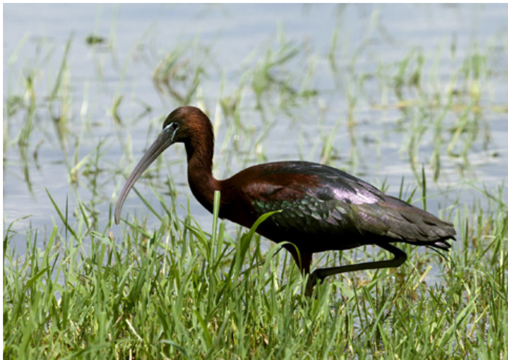
Χαλκόκοτα στον Πρόκοπο ( Plegadis falcinellus ).

παλιών ανοικιαζομένων δωματίων και των εγκαταστάσεων των λουτρών είναι βέβαιο, ότι θα ήταν πολύ σημαντικό έργο για την συνολική περιοχή.