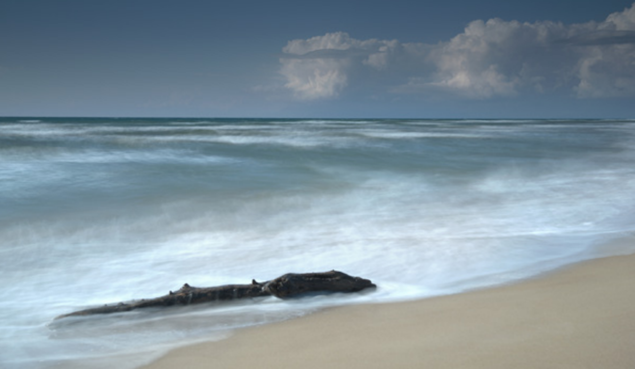
Απέραντες αμμουδερές παραλίες με θίνες.