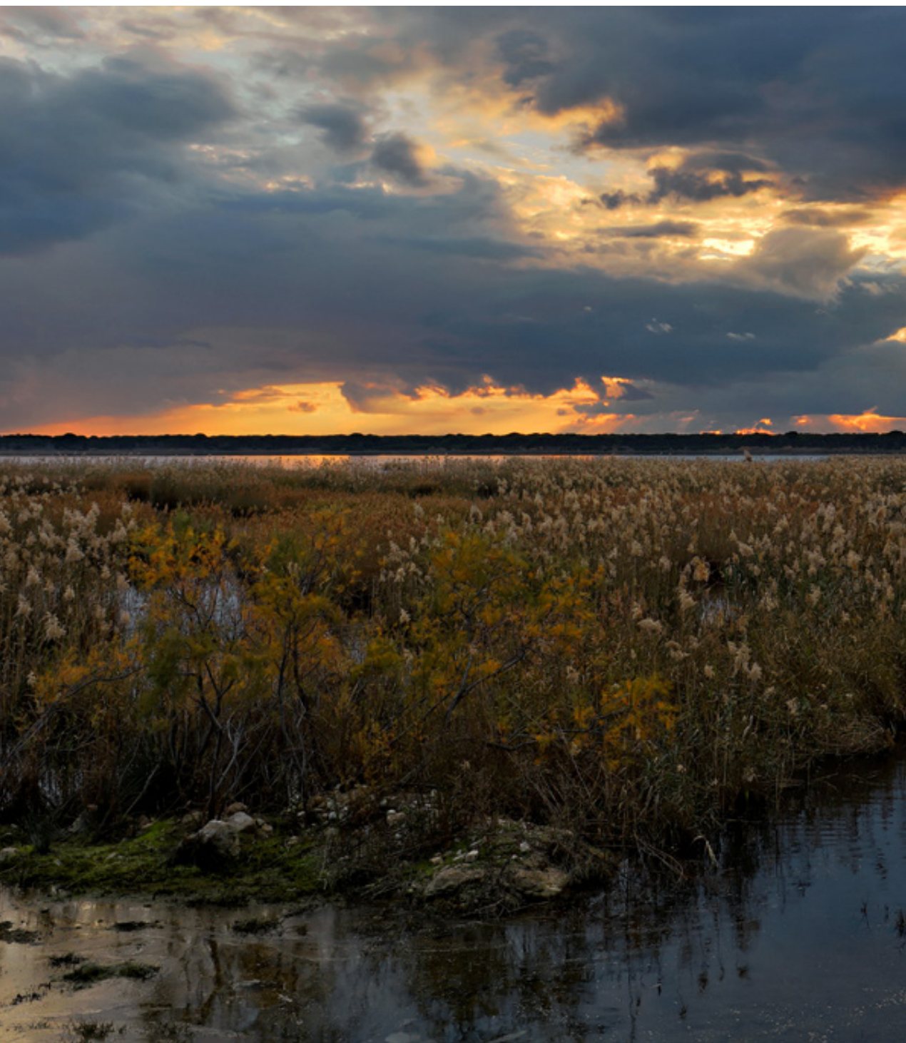
Ψάρεμα με πεζόβολο.