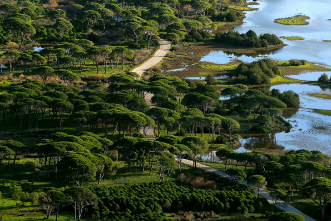
Ο φιδίσιος δρόμος περνάει μέσα από το μοναδικό δάσος κουκουναριάς.

λογλάρονα ( Gelochelidon nitotica ). Χάρη στην ύπαρξη της στρατιωτικής ζώνης, η πρόσβαση στο βόρειο τμήμα της περιοχής είναι από περιορισμένη έως μηδενική. Έτσι η περιοχή είναι απαλλαγμένη, τόσο από την λαθροθηρία όσο και από κάθε είδους όχληση, που προέρχεται από αναψυκικές ή παραγωγικές δραστηριότητες. Εξαιτίας αυτής της συνολικής ηρεμίας, σ' αυτή την περιοχή επιβιώνει ο μοναδικός πληθυσμός Τσακαλιού , της δυτικής Πελοποννήσου. Τέλος, λόγω του μεγάλου της βάρους, συγκριτικά με τις άλλες, η Λιμνοθάλασσα του Άραξου προτιμάται κυρίως από βουτηχτάρια και δεν φιλοξενεί μεγάλους αριθμούς υδρόβιων και παρυδάτια πουλιά. Αυτά περιορίζονται στα ρηκά έλη, στις παρυφές. Εκεί κατά την μετανάστευση εμφανίζονται καλές πυκνότητες κυρίως ερωδιόμορφων πουλιών.