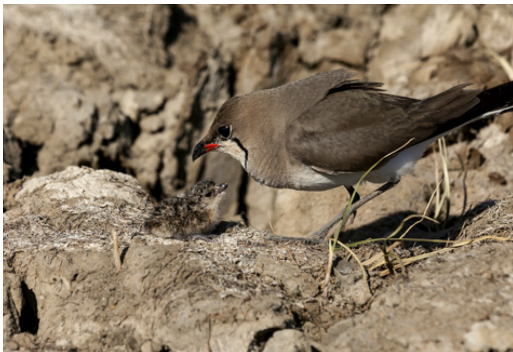
Τα νεροκελίδονα ( glareola pratincola ) φωλιάζουν στο έδαφος έξω από το Μετόχι (φωτ. Μ.Γούλα & Γ.Πάρκας).

δρόμο. Το σύστημα επικοινωνίας με την θάλασσα γίνεται μέσω του Αύλακα «Κέντρου» , μήκους 5.000 μέτρων, που αποστραγγίζει τον καλαμιώνα της Λάμιας, διατρέχοντας το δάσος Στροφυλιάς παράλληλα με την ακτογραμμή. Κατά την χειμερινή περίοδο και την καλοκαιρινή μετανάστευση, που τα εδάφη είναι συνήθως πλημμυρισμένα, η περιοχή αυτή αποτελεί μία από τις σημαντικότερες θέσεις τροφοληψίας και ανάπαυσης για τα διαχειμάζοντα και μεταναστευτικά παρυδάτια πουλιά. Από τον Μάιο - κυρίως - με την υποχώρηση των υδάτων, το αλίπεδο Λάμιας - Μετοχίου αποτελεί μια από τις σημαντικότερες θέσεις φωλιάσματος για το Νεροκελίδονο ( Glareola pratincola ).