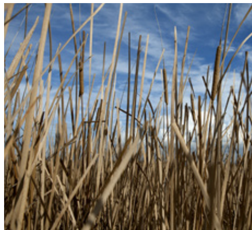
Καλαμιώνες στην Λάμια

αδρομή. Στο Κουνουπέλι μάς υποδέχεται ένας ευρύτατος αμμουδερός όρμος με πολύ ρηκό, φιλικό βυθό. Στην κορυφή του ακρωτηρίου, στο ΒΑ τμήμα του βράχου, σώζονται τα ερείπια ενός μικρού κάστρου της εποχής της Φραγκοκρατίας. Βρίσκονται εδώ επίσης οι εγκαταστάσεις ενός πα-