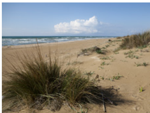
Εικόνες μαγικές με τα παιχνιδίσματα των κυμάτων.

ρού από τον Πρόκοπο στην θάλασσα. Είναι η ώρα της άμπωτης.