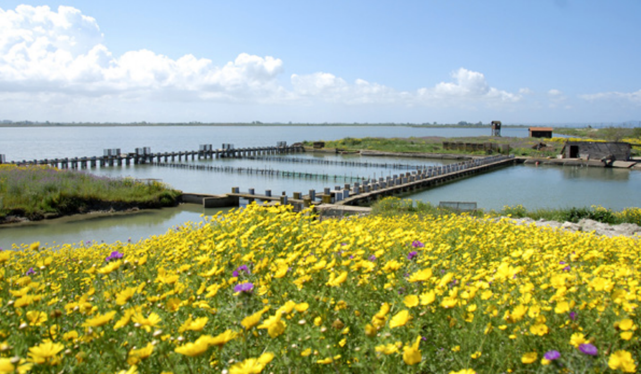
Το διβάρι στο Κοτύχι