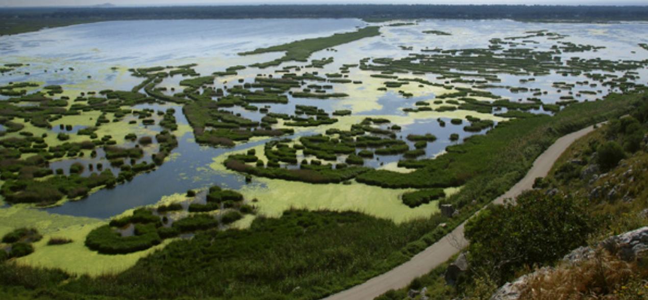
Η θέα της λιμνοθάλασσας την άνοιξη από το τείχος Δυμαίων.

Ο δρόμος διαγράφεται επίπεδος μπροστά μας. Με βαρετές ευθείες και μηδενικές υψομετρικές διαφορές. Ολόγυρα το βλέμμα συναντάει μόνον θερμοκήπια και χωράφια, αδιάφορα χωριά. Βρισκόμαστε στα ΒΔ της Πελοποννήσου, στην διαδρομή από την Πάτρα προς τον Πύργο. Εδώ δεν «ευχόμαστε να 'ναι μακρύς ο δρόμος». Μας ενδιαφέρει μόνον ο προορισμός μας, η «Ιθάκη». Μια Ιθάκη, ωστόσο, που δεν φαίνεται πουθενά.