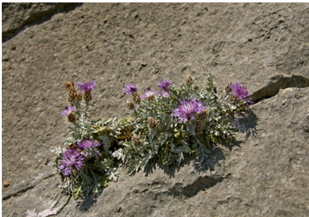
Η Κενταύρια ανθίζει σε μικρή περιοχή των Μαύρων Βουνών.

λατομική ζώνη έκτασης 1350 στρεμμάτων στις ΝΑ υπώρειες των Μαύρων Βουνών. Τα Μαύρα Βουνά εντάσσονται στην Α' Ζώνη Προστασίας της Φύσης και κατά συνέπεια απαιτείται η κατάργηση της λατομικής ζώνης, ως δραστηριότητας ασύμβατης με τους σκοπούς προστασίας της περιοχής.