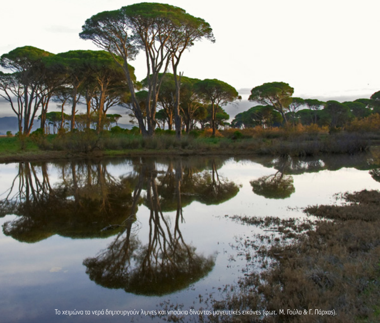
Το χειμώνα τα νερά δημιουργούν λιμνες και νησάκια δίνοντας μαγευτικές εικόνες.

πεδινές εκτάσεις κοντά στη θάλασσα. Στην Στροφυλιά, το μεγαλύτερο τμήμα των κουκουναριών βρίσκεται προστατευμένο πίσω από τις συστάδες χαλεπίου πεύκης που φυτρώνουν ως τη θάλασσα. Μ' αυτό τον τρόπο προστατεύονται από τους ισχυρούς ανέμους και την αλατότητα του θαλάσσιου νερού. Η πλειοψηφία των κουκουναριών της Στροφυλιάς έχουν ηλικία 100-200 ετών και σχη-