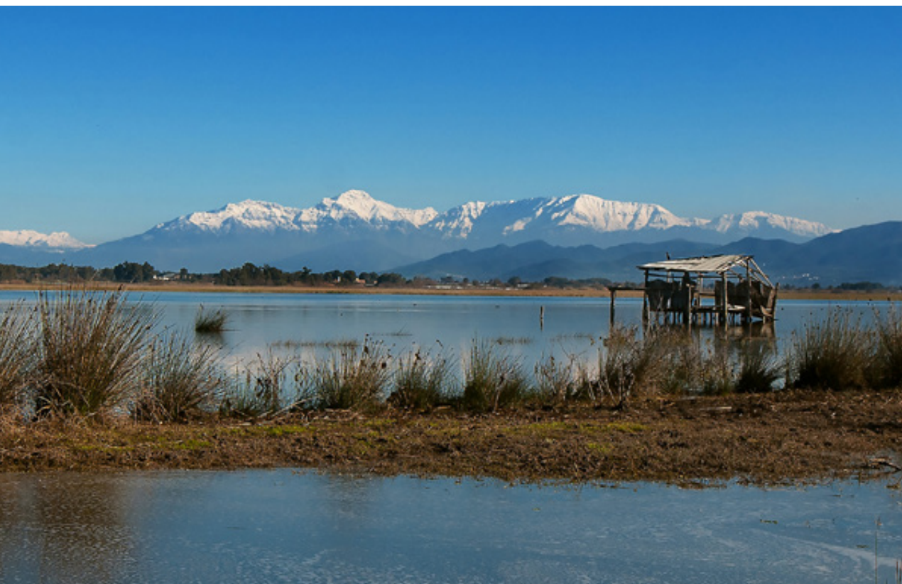
Λιμνοθάλασσα Πρόκοπου με φόντο τον χιονισμένο Ερύμανθο

( Juniperus phoenicea ), το Πουρνάρι ( Quercus coccifera ) και ο Φράξος ( Fraxinus augustifolius ). Αξίζει να σημειώσουμε ότι στο Δάσος Στροφυλιάς βρίσκουν καταφύγιο χερσαίες χελώνες, αλεπούδες, νυφίτσες, δενδροποντικοί και πολλά πουλιά όπως ο Κούκος, ο Νανόμπουφος, οι Φυλλοσκόποι και άλλα. Ακόμη, το ζωντανό και νεκρό ξύλο των δέντρων αποτελεί ένα μικρό ενδιαιτήμα για ποικιλία εντόμων και μανιταριών, που διαδραματίζουν σημαντικό ρόλο στην ανακύκλωση της ύλης του δάσους.