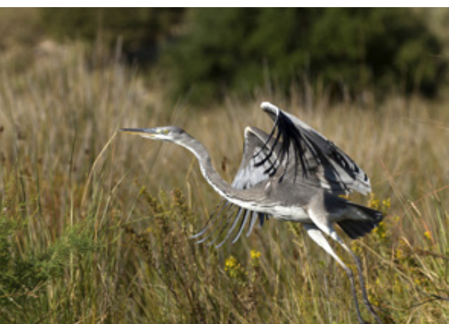
Σταχτοτσικνιάς ( Ardea cinerea ) ο μεγαλύτερος ερωδιός.

μέτρων, με μικρά ή μεγάλα ξέφωτα και διάκενα. Σε διάφορα σημεία υπάρχουν λιμνάζοντα νερά και κανάλια φυσικά ή τεχνητά, που συντελούν στον σχηματισμό μιας αλληλουχίας υγρών και χερσαίων βιοτόπων, με γλυκά και υφάλμυρα νερά. Η αλληλουχία αυτή δημιουργεί ένα οικοσύστημα μεγάλης βιοποικιλότητας. Το Δάσος της Στροφυλιάς απαρτίζεται από τρία κυρίαρχα είδη δέντρων, την Κουκουναριά , την Χαλέπιο Πεύκη ( Pinus halepensis ) και την Ήμερη Βαλανιδιά ( Quercus macrolepis ). Από τα είδη αυτά, η Χαλέπιος Πεύκη καταλαμβάνει την μεγαλύτερη έκταση και εμφανίζεται αμιγής, κυρίως κατά μήκος της αμμώδους παραλίας και των θινών. Στα εσωτερικά τμήματα του δάσους σχηματίζονται μεικτές συστάδες με κυρίαρχο είδος