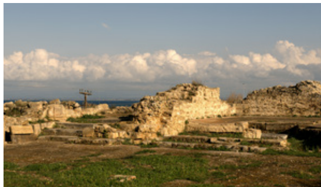
Επάνω: Ο φάρος της Καυκαλίδας, στο ομώνυμο νησάκι. Κάτω: Ο ερηπυωμένος φράγγικος ναός της Γλαρέντζας.

βιαστικοί και διαβατικοί. Με νου και μάτια μόνο για τα νησιά. Χωρίς ν' αφιερώσουμε ούτε τον ελάχιστο χρόνο για μια χαλαρή περιδιάβαση στην πόλη ή στην απλοχωριά του λιμανιού. Κι ύστερα να περπατήσουμε ξεκούραστα λίγο πιο έξω ακόμη, στην πλευρά του ακρωτηρίου. Εκεί όπου δι-