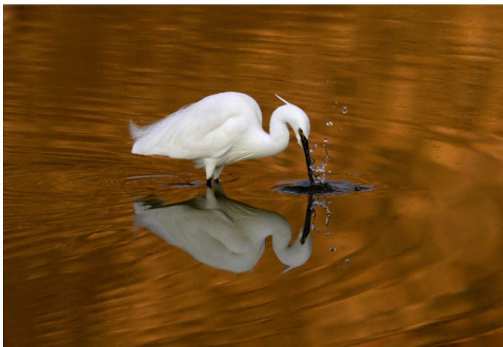
Ο λευκοτσικνιάς ( Egretta garzetta ) είναι κοινό είδος στην περιοχή.