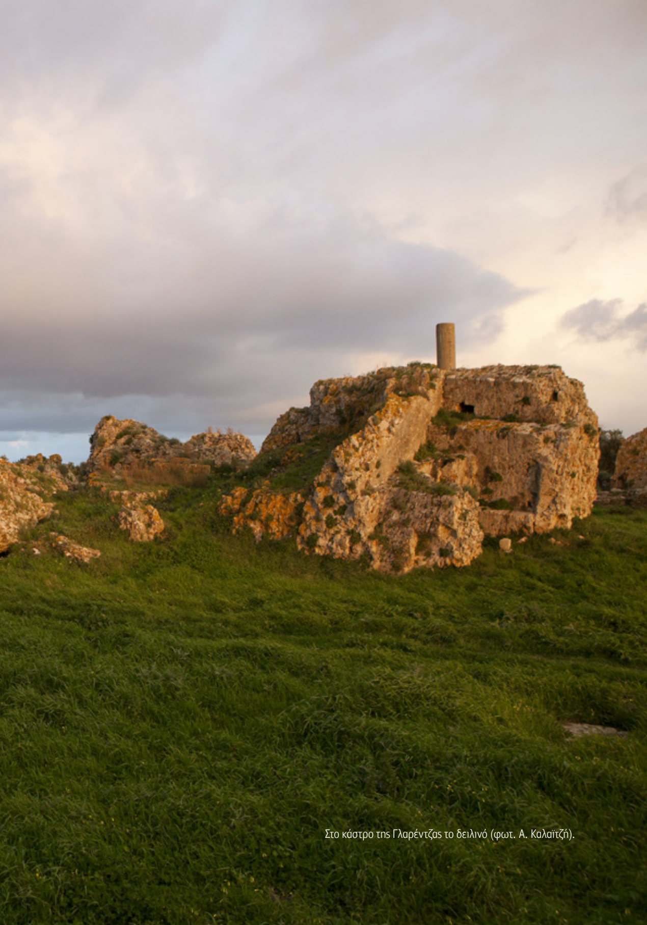
Στο κάστρο της Γλαρέντζας το δειλινό (φωτ. Α. Καλαϊτζή).