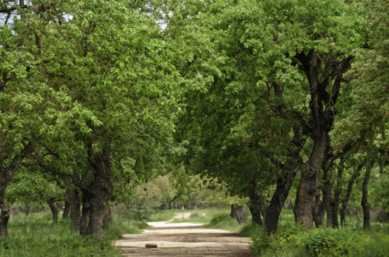
Παιχνίδι με τα εποχιακά χρώματα στο δάσος δρυός.