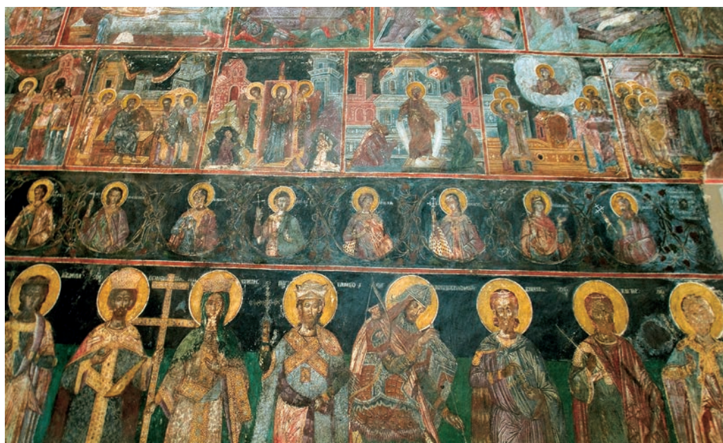
Οι αγιογραφικές ζώνες της εκκλησίας της Ανωγής, δείγμα σπάνιας ωραιότητας και τεχνικής.