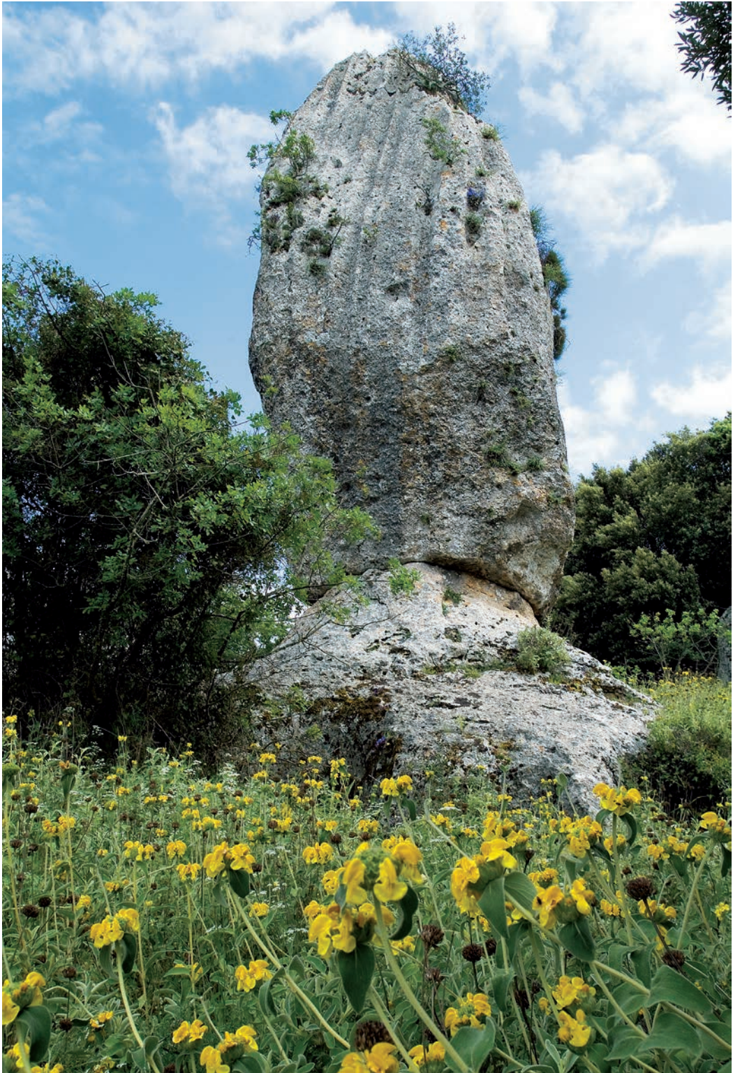
Ο μννλίνθος «Αρακλίνης», φυσική σύνθεση τυχαίου και συμμετρίας.