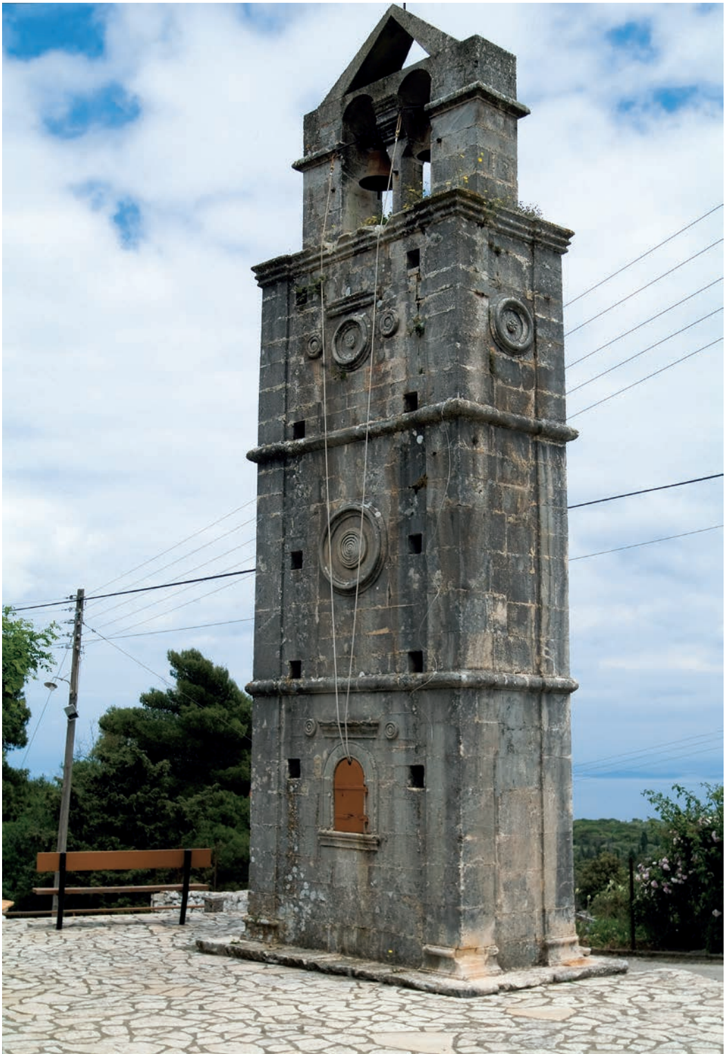
Το Βενετσιάνικο κωδωνοστάσιο της εκκλησίας, σύμβολο της Ανωγής και πόλος ιερού προσκυνήματος.