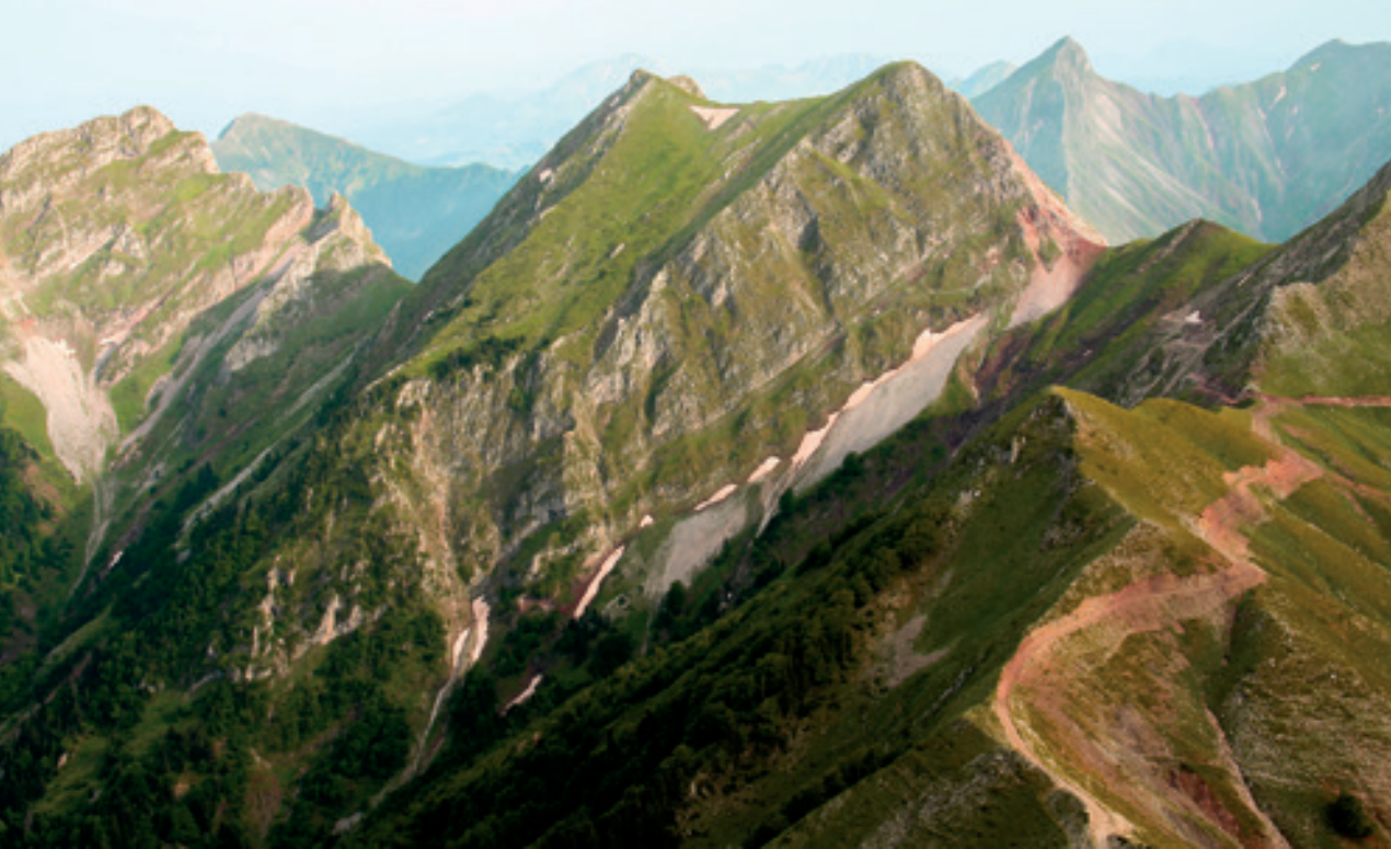
Πέντε Πύργοι και Φλιτζάνι από το Μπορλέρο.