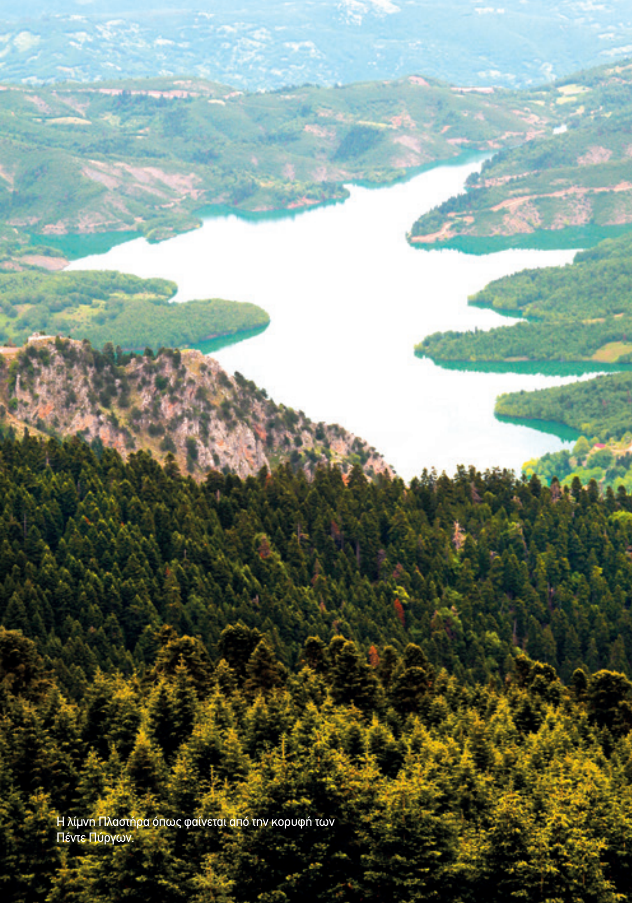
Η λίμνη Πλαστήρα όπως φαίνεται από την κορυφή των Πέντε Πύργων.