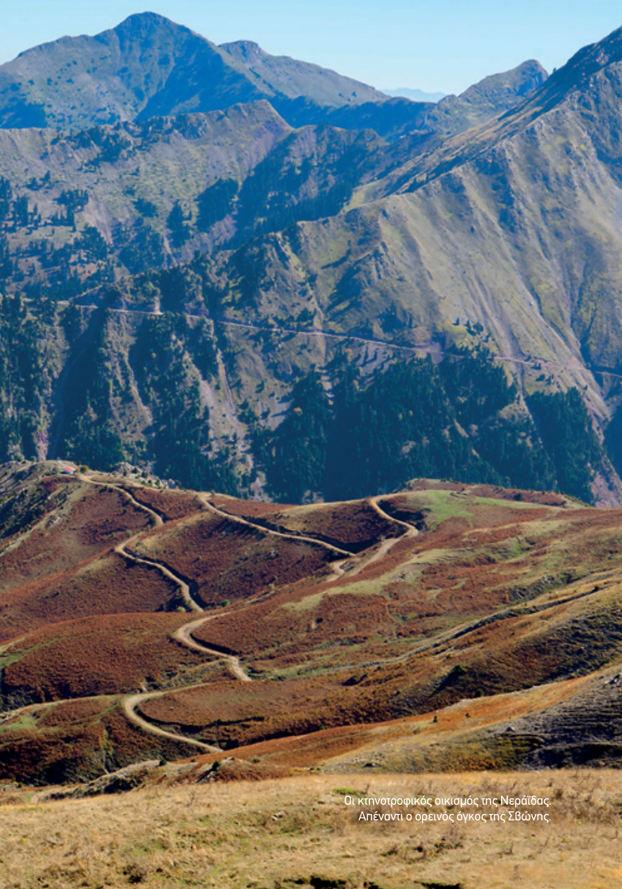
Οι κτηνοτροφικός οικισμός της Νεράϊδας Απέναντι ο ορεινός όγκος της Σβώνης