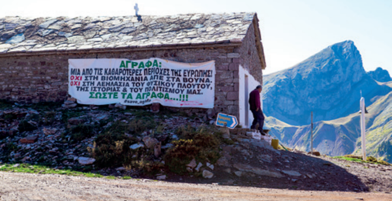
Το ξωκκλήσι του Αϊ-Νικόλα.

σουμε, με κάμποσες φουρκέτες, στο ψηλό διάσελο που χωρίζει το Φλιτζάνι από την Πλάκα, σημείο που εισάγει στα μυστήρια της Νιάλας. Εκεί σταματήσαμε, κατεβήκαμε από το αμάξι και φορτωθήκαμε τα δισάκια μας για ανάβαση στο Φλιτζάνι... Τι αυθάδεια και αυταπάτη! Η κορυφή του Φλιτζανιού, μόλις απέναντί μας, μάς περιγελούσε, κρυμμένη πίσω από μια απατηλή κορυφούλα, με την απότομη, κατάκρημη κι αποτρεπτική ορθοπλαγιά της που ήταν αδύνατο να προσεγγισθεί. Γυρίσαμε πίσω και επιδοθήκαμε στην ανάβαση της Πλάκας. Κάτι ήταν κι αυτό. Η Πλάκα, ένας άσπρος φλογερός ασβεστόλιθος, δίπολος πέτρινος όγκος, ύψους 2.000 μέτρων, έδειχνε κι αυτή απότομη, αλλά τελικά ήταν πολύ φιλικότερη από το Φλιτζάνι και η κατάληψη της κορυφής της άνετη και σχεδόν σύντομη. Ωραιές εικόνες, κυλώντας από τα δυτικά, μας επλημμύρισαν, αφού το Βοϊδολίβαδο, το Βαλάρι και τα Βραγγιανά, αποκαλύφθηκαν μεσ' από ένα σκηνικό μαγικής καταρροής.