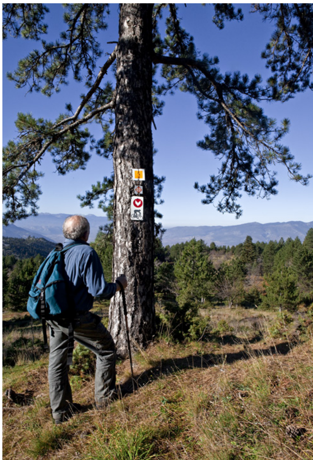
Η πορεία συνεχίζεται σε μονοπάτι ειδικό για ποδήλατα βουνού.