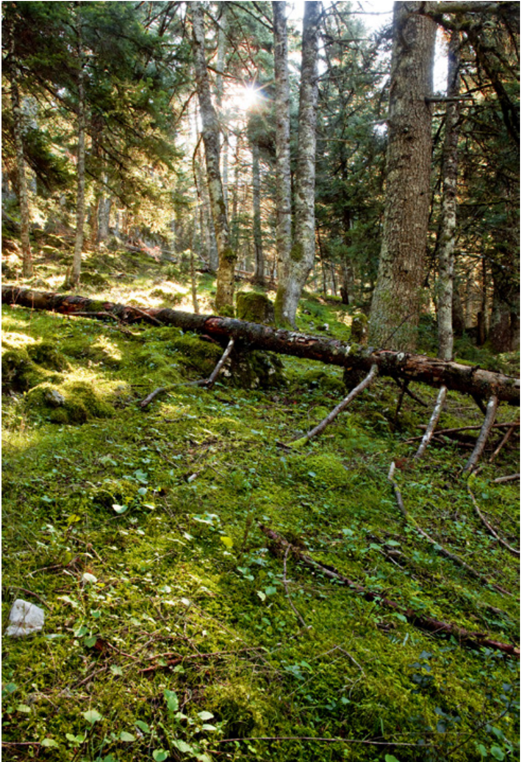
Πεσμένοι κορμοί έλατων στο δάσος πολλές φορές κόβουν τα μονοπάτια.