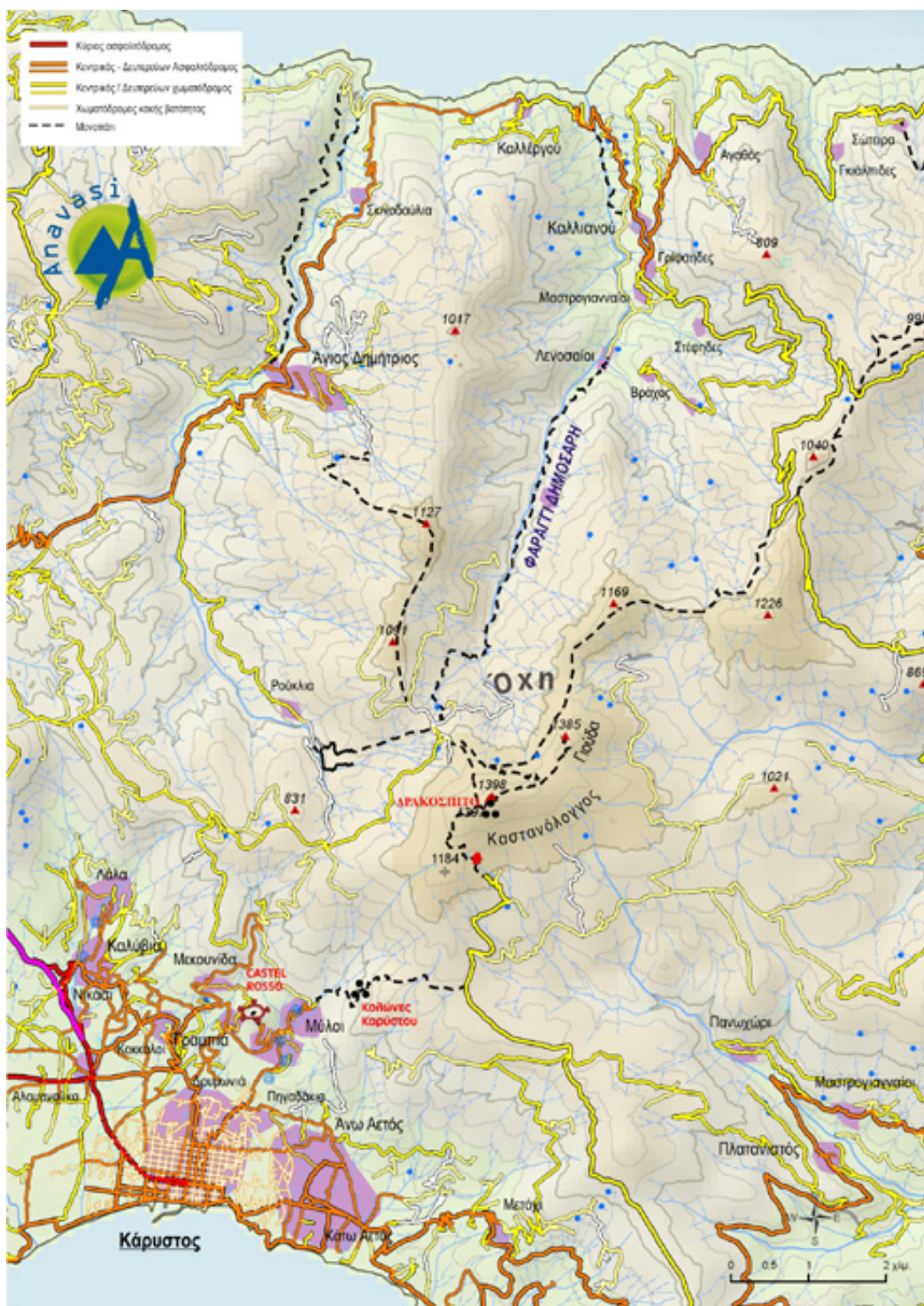
Σχεδιασμένος βάσει του περιηγτικού και πεζοπορικού χάρτη Νότια - Εύβοια - Καρυστία 1:50.000 που κυκλοφορεί από τις εκδόσεις ANABΑΣΗ