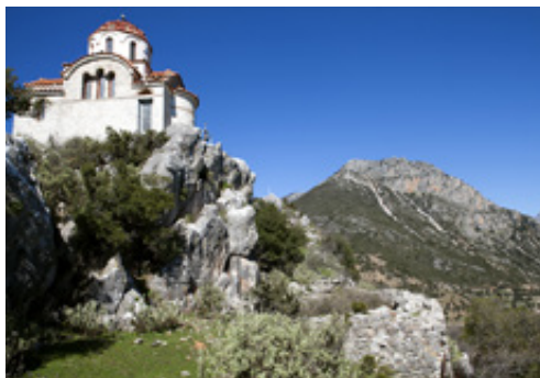
Το εκκλησάκι του Αγ. Γεωργίου και τμήμα του οχυρωματικού περιβάλου.

τωλικές πόλεις, που άρχισαν να οργανώνονται στην πολιτική ομοσπονδία της Αιτωλικής Συμπολιτείας. Η νέα πόλη προστατεύθηκε με τείχος και σε αυτήν συγκεντρώθηκαν οι θρησκευτικές, οικονομικές και πολιτικές δραστηριότητες των αγροτικών οικισμών. Στην Ελληνιστική περίοδο, σύμφωνα με επιγραφικές μαρτυρίες, η πόλη ονομαζόταν Καλλίπολις . Το Κάλλιον βρισκόταν σε στρατηγική θέση κοντά