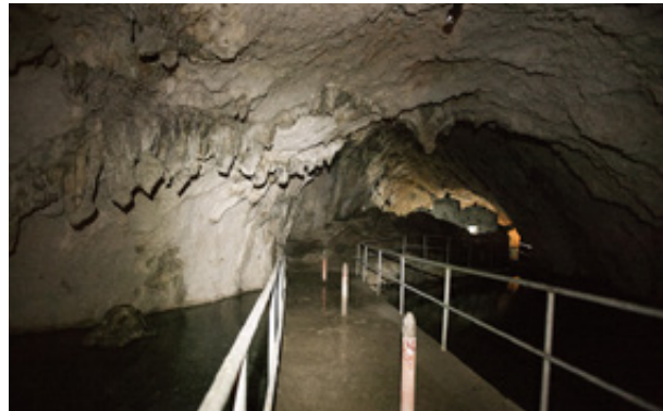
Το εντυπωσιακό εσωτερικό του σπηλαιώδους ξωκκλησιού της Ζωοδόχου Πηγής.

αβυσσαλέας χοάνης, που καταπίνει το βουερό νερό που υπερχειλίζει απ' την λιμνούλα. Στο σταθερό φως του φακού και στο τρεμάμενο των κεριών θαυμάζουμε το κρυστάλλινο νερό της λιμνούλας αλλά και τις αλλεπάλληλες ασβεστολιθικές αποθέσεις στο δάπεδο του σπηλαίου.