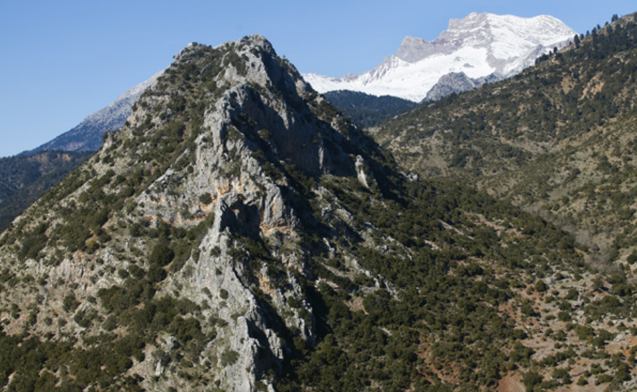
Πάνω: Ο απότομος λόφος, όπου είναι κτισμένο το εκκλησάκι της Παναγίας. Δεξιά: Το Διακόπι και τα χιονισμένα Βαρδούσια από τον λόφο της Παναγίας.

Πριν από το Διακόπι συναντάμε ένα μαντρί. Στρίβουμε δεξιά και σε λίγο φτάνουμε σε χορταρισμένο οροπέδιο με μαντρί και ποτίστρα. Κάποιοι χωματόδρομοι ανηφορίζουν στις τραχιές πλαγιές των Βαρδουσίων. Εμείς παίρνουμε τον απότομο ανήφορο προς τον λόφο της Παναγίας. Στροφές, απότομες κλίσεις και ξαφνικά, μια κατολίσθηση τεράστιων βράχων εμποδίζει την μετακίνησή μας. Καλύπτουμε τα τελευταία 300 μέτρα με τα πόδια και φτάνουμε στην κορυφή του λόφου, σε υψόμετρο 950 μέτρων.