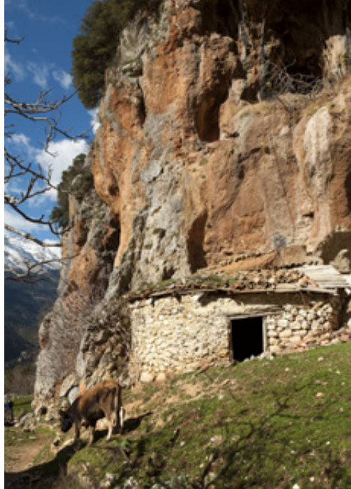
Πάνω: Συνεχή ασβεστολιθικά σπήλαια, μαντριά και μικρόσπιτα στην βόρεια πλευρά της Συκιάς. Αριστερά: Ανθισμένες αμυγδαλιές και χιονισμένες ορθοπλαγιές.

χαμπλώνει προς την κοίτη του Μόρνου. Τον ανηφορίζουμε προς το χωριό. Με τις αλληπάλληλες στροφές του είναι απρόσμενα μακρύς. Χρειαζόμαστε τουλάχιστον 35 λεπτά ως την πλατεία της Συκιάς. Πέτρινη εκκλησία της Αγίας Παρασκευής, μαρμαρίνο Μνημείο Πεσόντων, η κυρά - Παναγιώτα με τα προβατάκια της, ένας πρόσχαρος ηλικιωμένος γενειοφόρος. Η καμινάδα του καφενειού καπνίζει οι ταβέρνες όμως, την μεσημεριάτικη τούτη ώρα, είναι κλειστές.