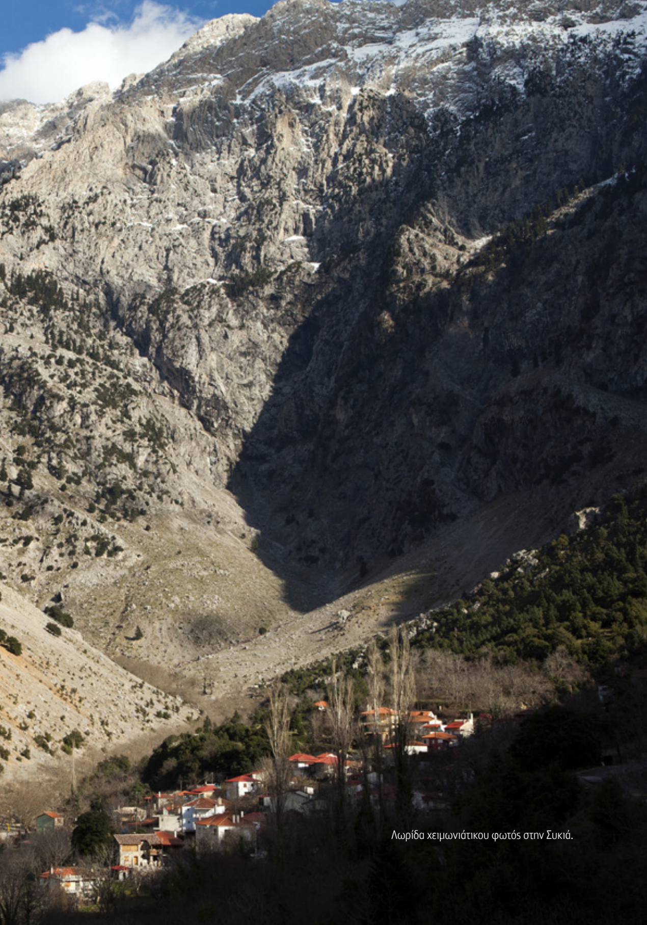
Λωρίδα χειμωνιάτικου φωτός στην Συκιά.