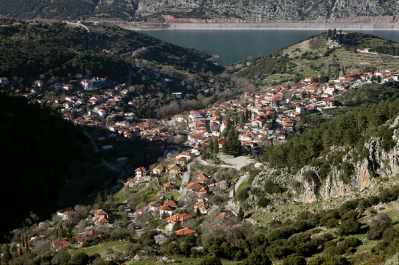
Το Λιδωρίκι από ψηλά. Μια εικόνα που αναδεικνύει την γραφικότητα της πόλης.

ο γιός του, διαπρεπής δημοσιογράφος και συγγραφέας Αλέκος Λιδωρίκης . Στις 28 Μαρτίου 1821 ο Δήμος Σκαλτσάς , πρωτοπαλίκαρο των Κοντογιανναίων, ύψωσε μαζί με τον Αναγνώστη Λιδωρίκη και το Παπα Γεώργη Πολίτη την σημαία της Επανάστασης, κατατροπώνοντας τους Τούρκους.