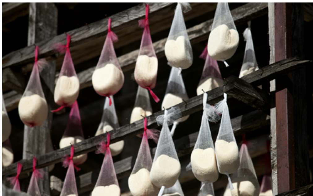
Ξηρή μυζήθρα στην τσαντήλα, στεγνώνει με το φυσικό παραδοσιακό τρόπο στο υπόστεγο.