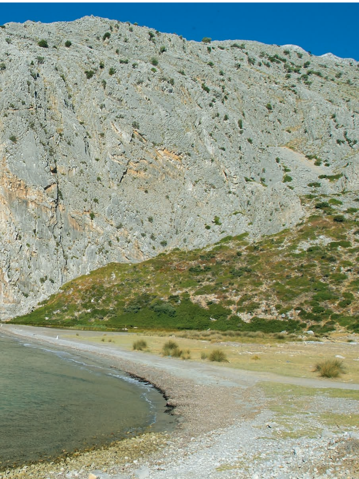
Η αρχή του βουνού της Βαράσοβας, εκεί που τελειώνει η παραλία της Λιμνοπούλας.