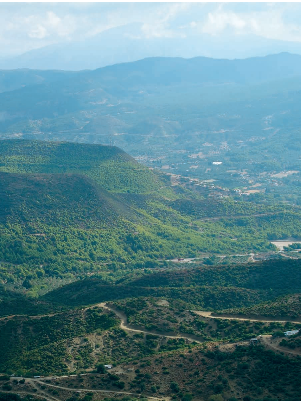
εύφορο ελαιόφυτο κάμπο του Εύηγου, απ' το ύψος της σπηλιάς των Αγίων Πατέρων.