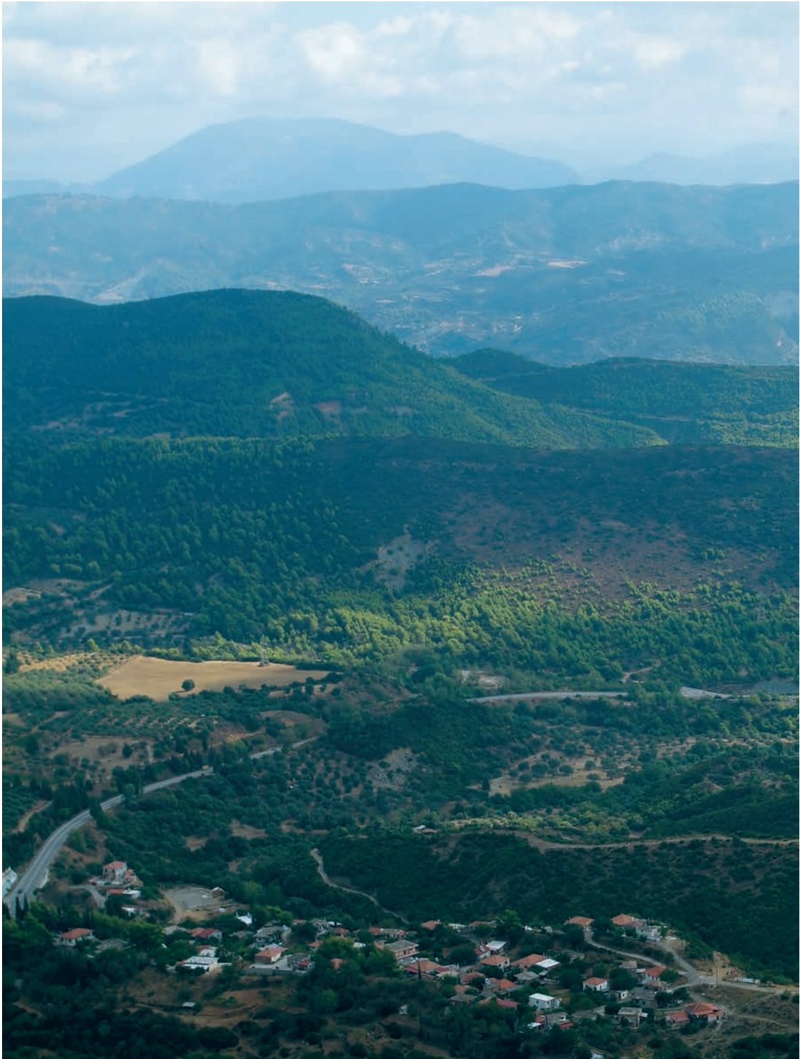
Η Πάνω Βασιλική ή Γαβρολίμνη και τ' άλλα χωριά βόρεια της Βαράσοβας μες στον