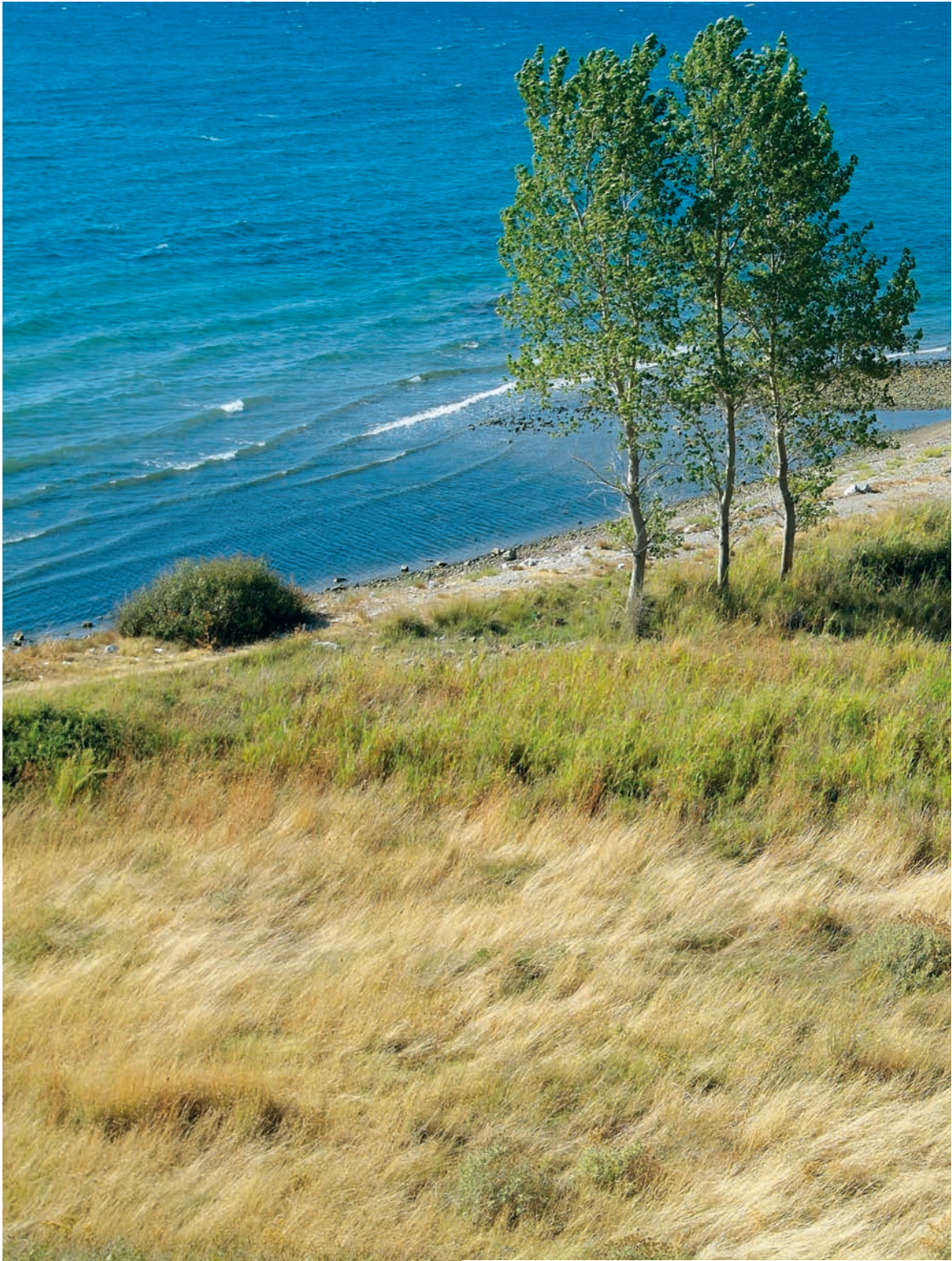
Τρεις μοναχικές λεύκες,