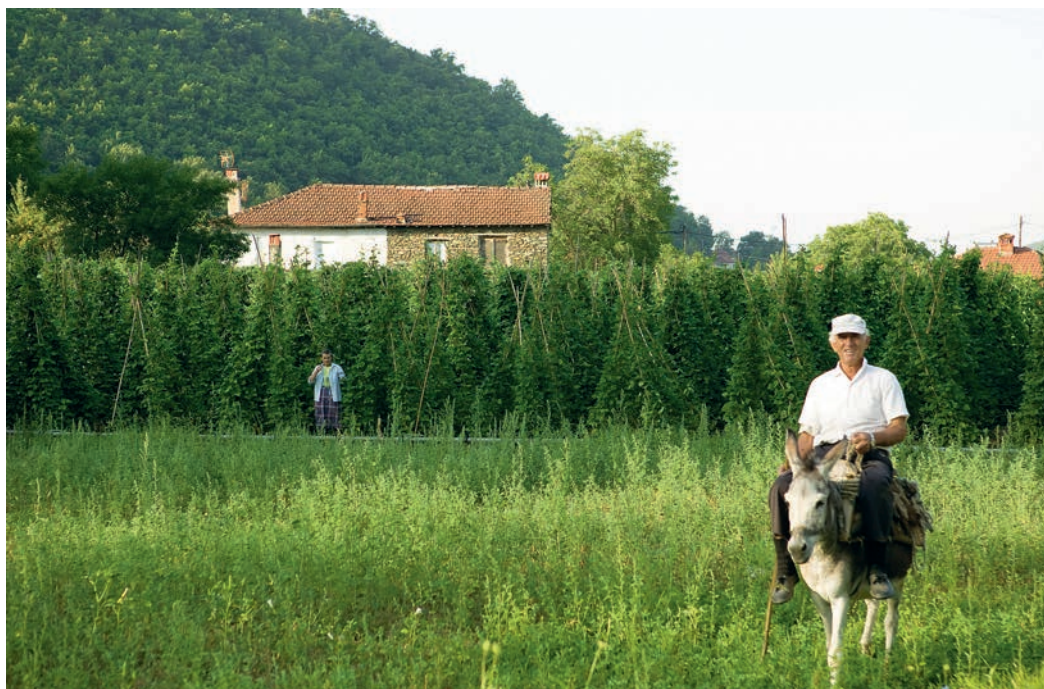
Παραδοσιακή καλλιέργεια φασολιών και παραδοσιακή μετακίνηση με γαϊδουράκι στο Σισάνι. Τα καλογουαλισμένα καζάνια του χωριού πριν γίνουν "καπνισμένα τσουκάλια" στη φωτιά.

Κ αθώς πλησιάζουμε στο Σισάνι, εισδύουν απ' τα παράθυρα του αυτοκινήτου πνοές δροσιάς. Δυο ώρες νωρίτερα, στις πεδινές εκτάσεις της Θεσσαλονίκης και της Βέροιας, ο αέρας ήταν λίβας. Παρασκευή 10 Αυγούστου , μια μέρα θερμή όπως τόσες άλλες του φετινού καλοκαιριού.