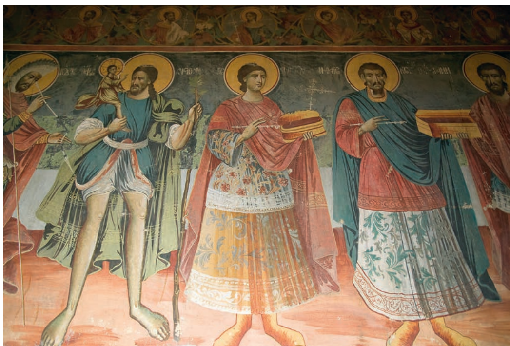
Εξαιρετική τοιχογραφία, μια από τις πολλές που κοσμούν το εσωτερικό της Μονής Κοιμήσεως της Θεοτόκου στο Σισάνι.

Ίσως μάλιστα, αυτή η απουσία όγκου και χρωμάτων, να τονίζει ακόμη περισσότερο την αυστηρή τους γραμμικότητα, την ντελικάτη κορμιοστασιά.