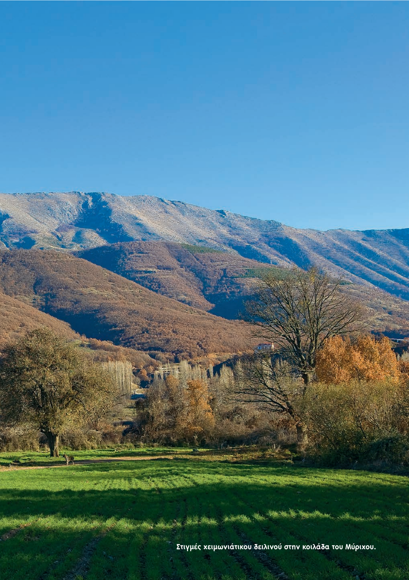
Στιγμές χειμωνιάτικου ζειλινού στην κοιλάδα του Μύρικου.