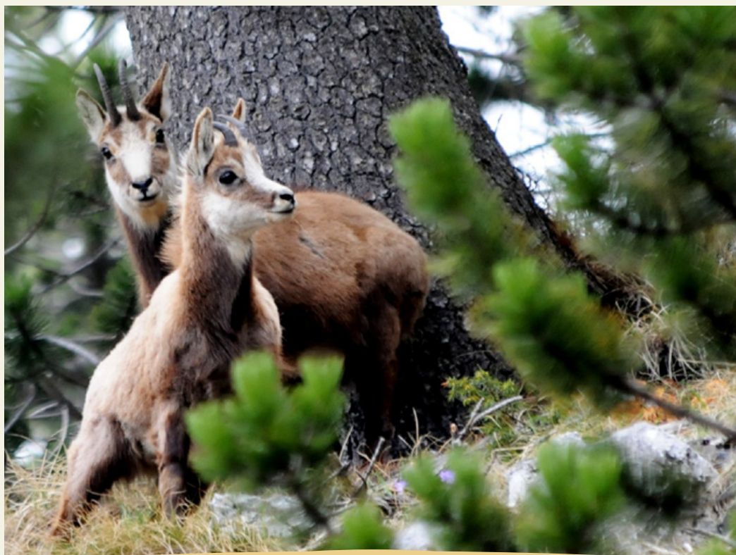
Νεαρό θηλυκό αγριόγιδο με το μικρό του στα μέσα της άνοιξης.