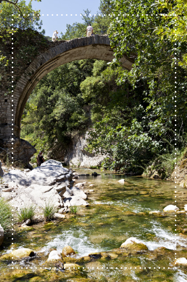
Το γεφύρι της Νέδας

Στο σημείο λοιπόν αυτό η καταπορική ρεματιά που δε φαίνεται γιατί είναι πολύ δασωμένη και όπου θεωρείται ότι βρισκόταν το πιο πάνω Ιερό, σήμερα χαρακτηρίζεται από το πρωτότυπο θέαμα δύο διαδοχικών και αλληπάλληλων καταρραχτών που ουσιαστικά εδραιώνουν τη μοναδική ομορφιά του τοπίου και δίνουν ξεχωριστό κι ιδιαίτερο νόημα σε αυτό το νευραλγικό πυρήνα της Νέδας.