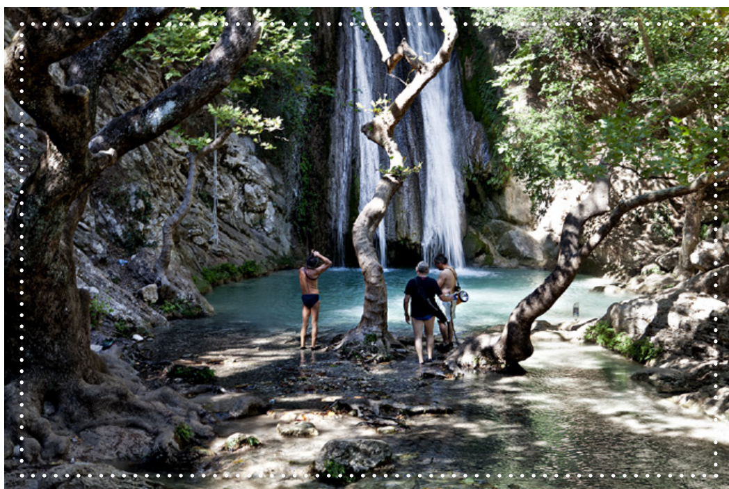
Ο πρώτος καταράκτης της Ευρυνόμης, με τη λιμνούλα όπου εθεωρείτο και η έδρα του Ιερού της θεάς. Ελάχιστοι μπορούν να αντισταθούν για μια βουτιά στα πεντακάθαρα νερά.

Ακριβώς στην έξοδό μας μια υπέροχη πινελιά αιωρούμενων κολεών, από βραχώδη γεφυρώματα, υπερίπταται από πάνω μας, ενώ το ποτάμι ρηχάινει και όλα ξαναπαίρνουν το ήμερο ύφος τους και ξανατύνονται με την εσάρπα του καθημερινού και του συνηθισμένου.