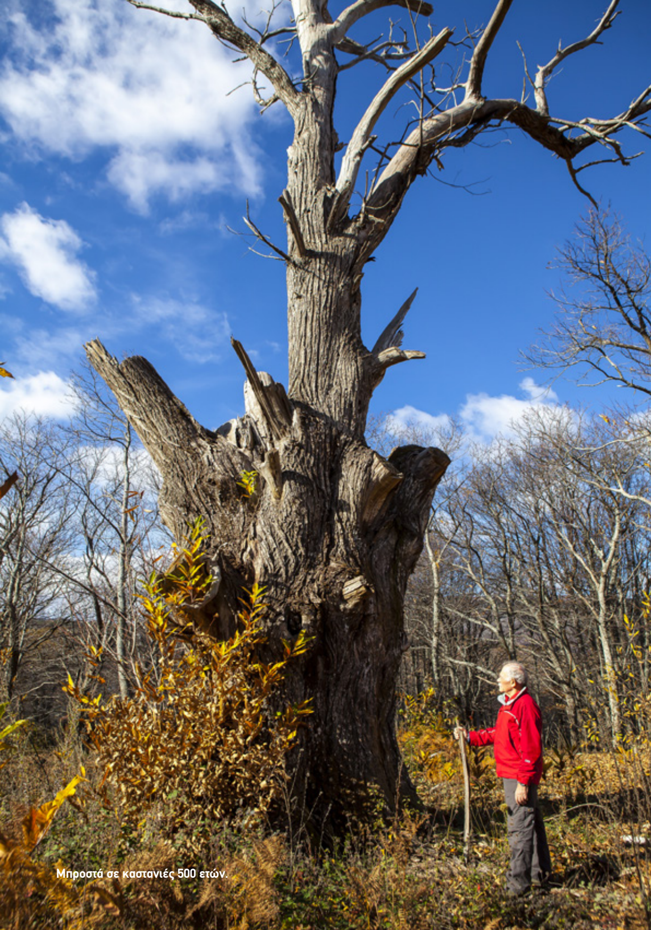
Μηροστά σε καστανιές 500 ετών.