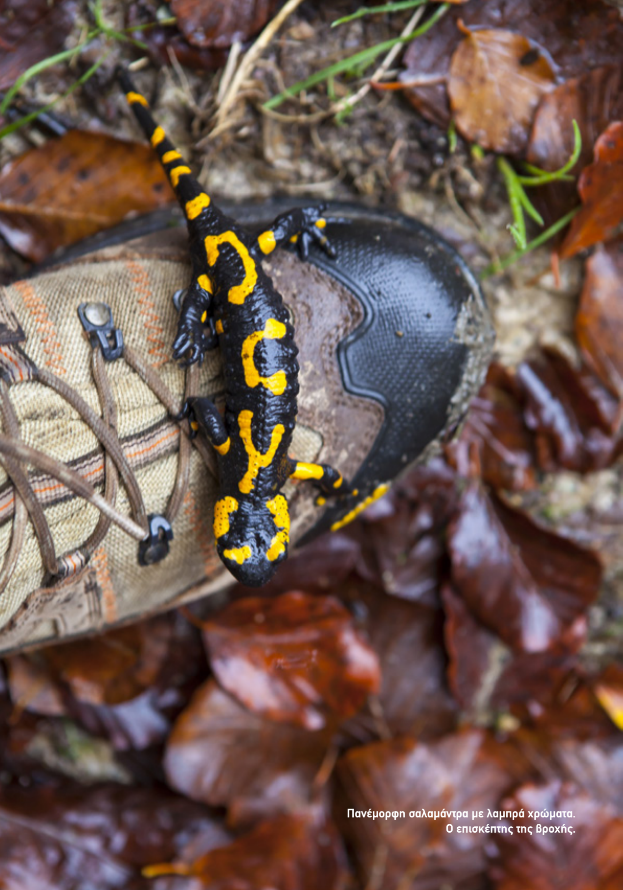
Πανέμορφη σαλαμάντρα με λαμπρά χρώματα. Ο επισκέπτης της βροχής.