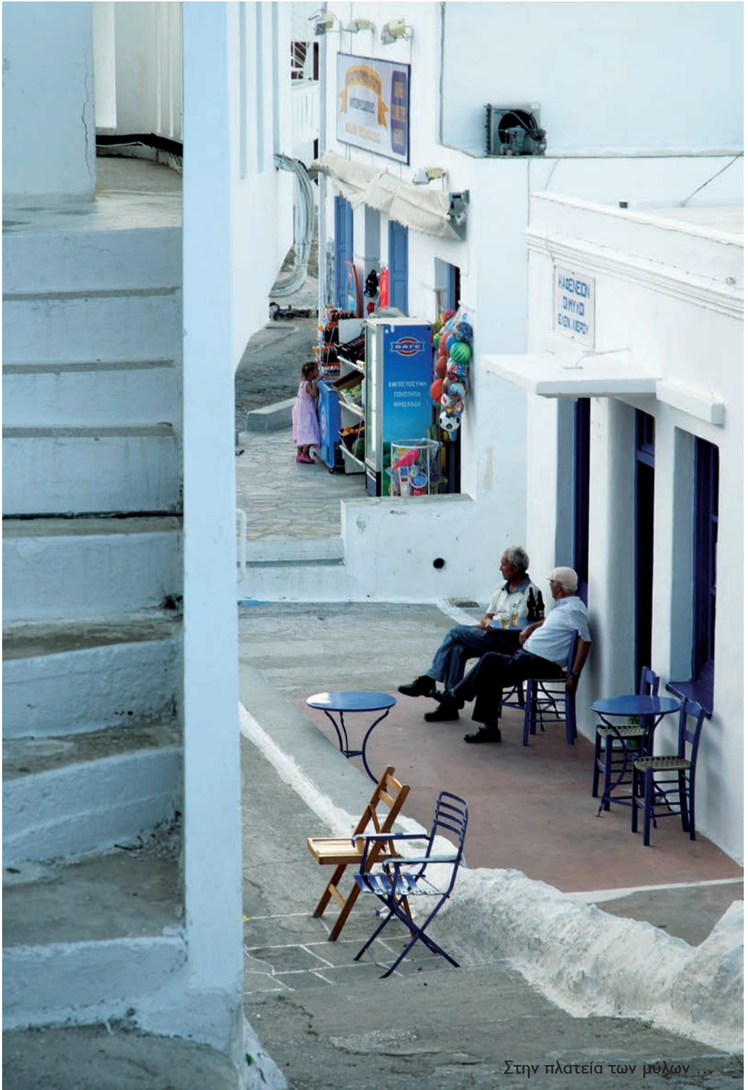
Στην πλατεία των μύλων ...