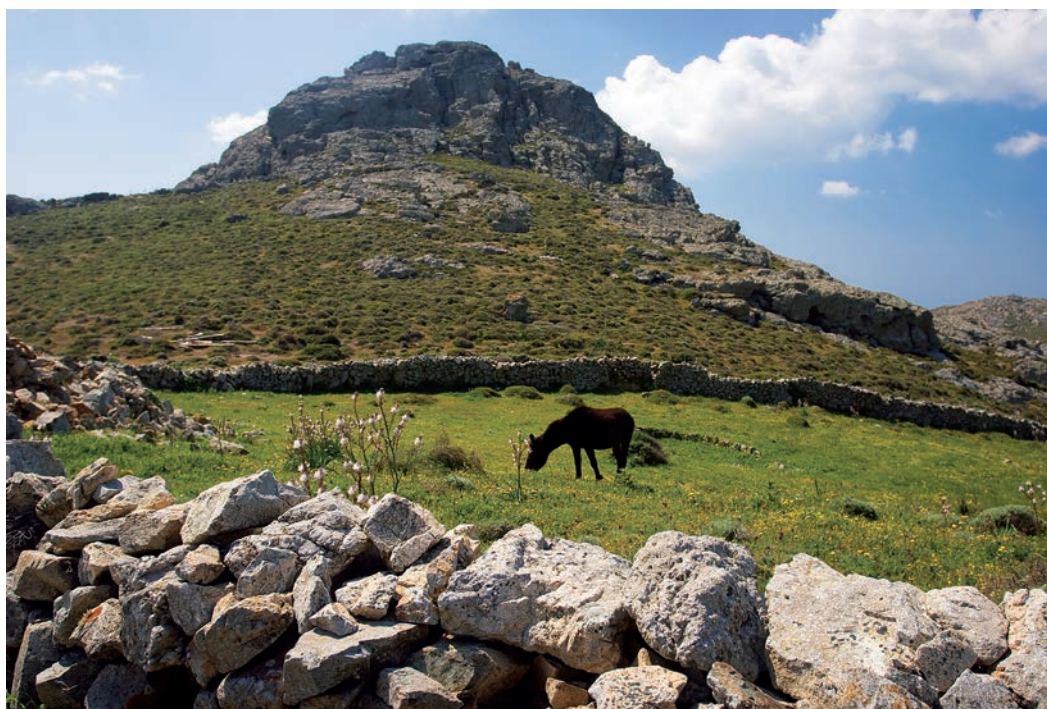
Το λιθόστρωτο των μεταλλωρύχων, στη διαδρομή 2. (επάνω) Με θέα προς το Όρος,