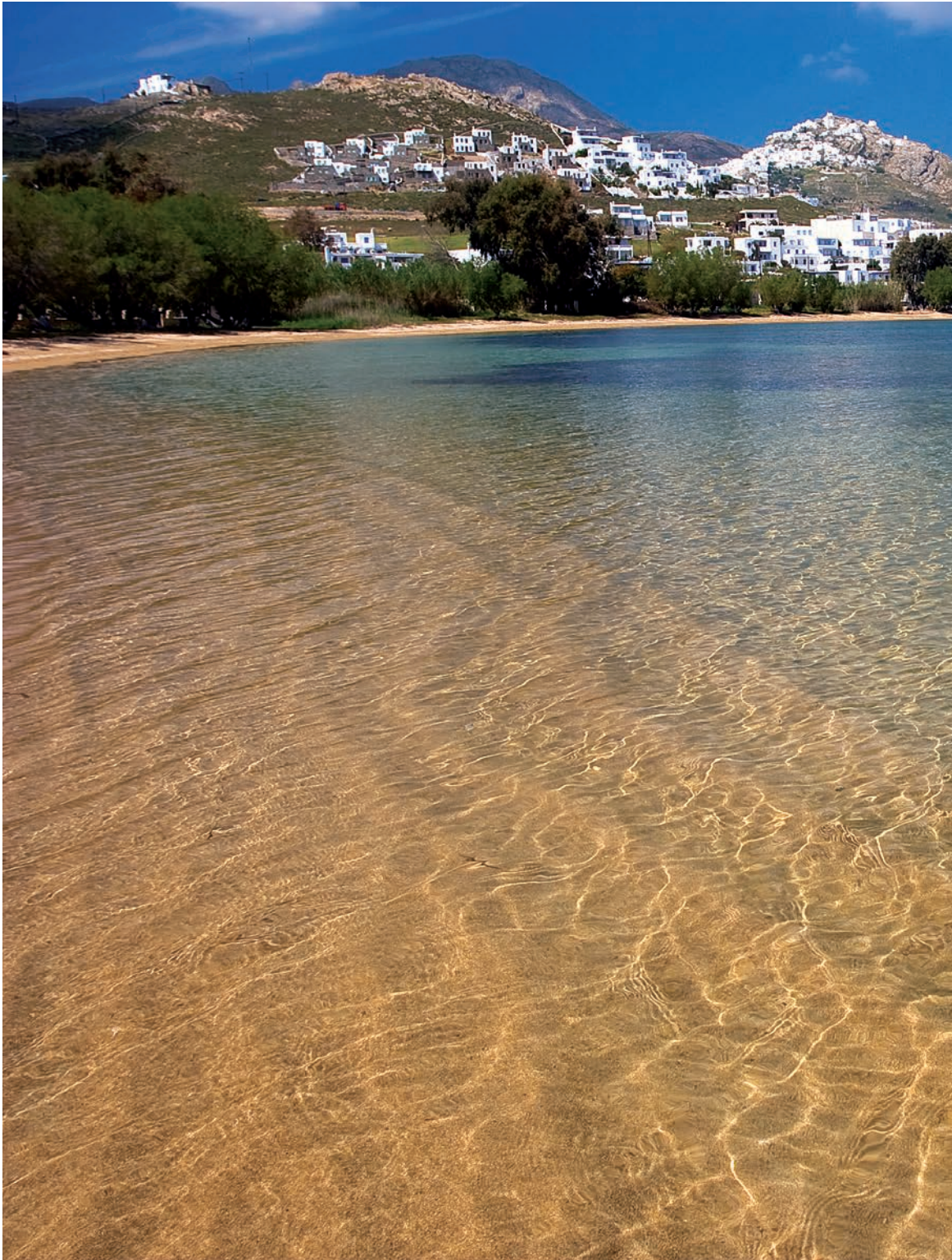
Τα διάφανα νερά της παραλίας στα Λιβαδάκια , με τα σπίτια του Λιβαδιού, τον κατάλευκο