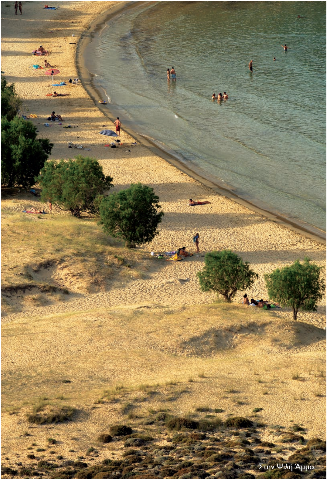
Στην Ψιλή Άμμο.