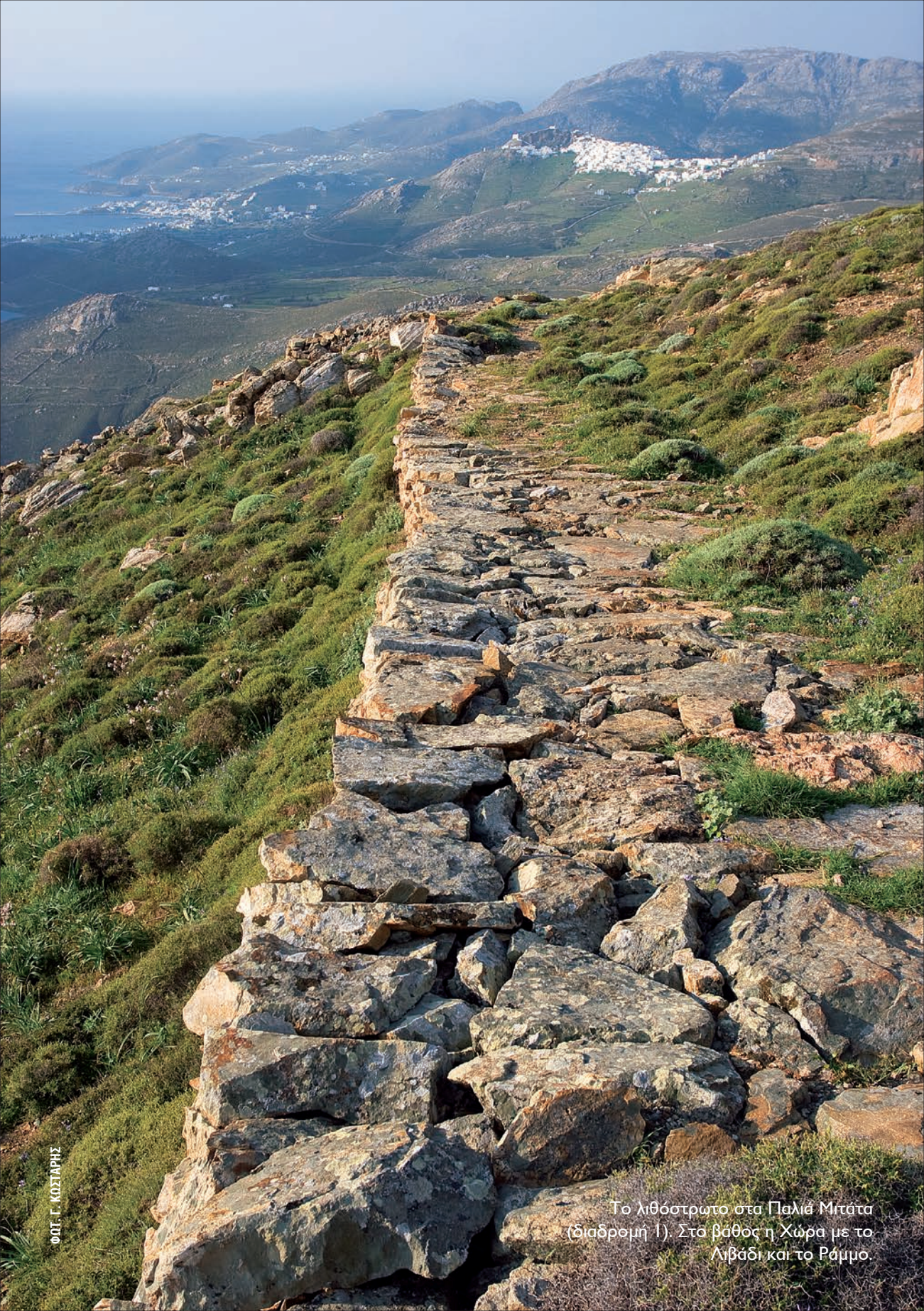
Το λιθόστρωτο στα Παλιά Μιγάτα (διαδρομή 1). Στο βάθος η Χώρα με το Λιβάδι και το Ράμμο.