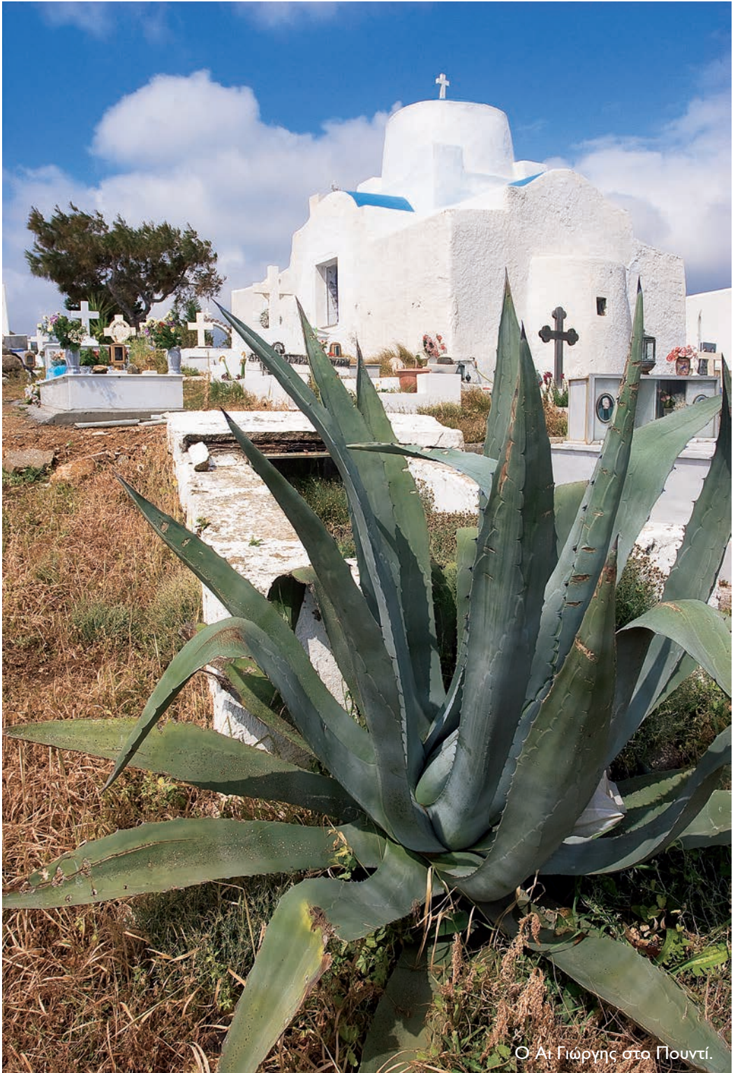
Ο Αι Γιώργης στο Πουρτί.