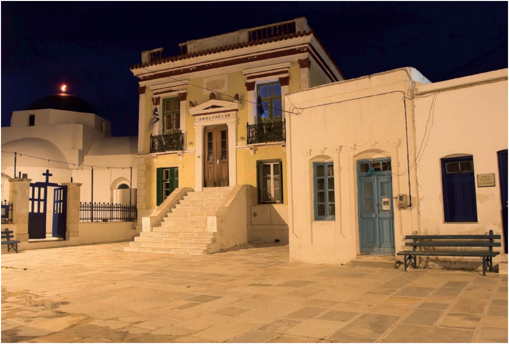
Στην Πάνω Πιάτσα Στο Λιβάδι