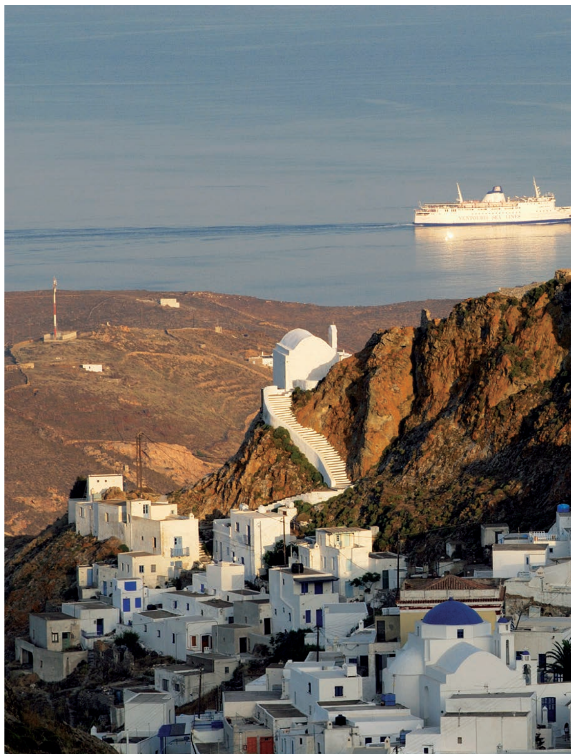
Χώρα Σερίφου ... μια από τις ομορφότερες ζωγραφιές των Κυκλάδων.