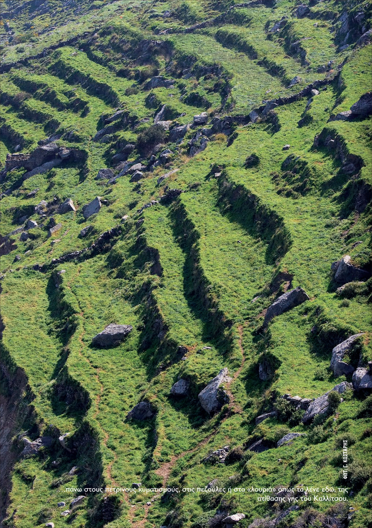
...πάνω στους πετρίνους κυματισμούς, στις πεζούλες ή στα «λουριά» όπως τα λένε εδώ, της ατίθασης γης του Καλλίτσου.