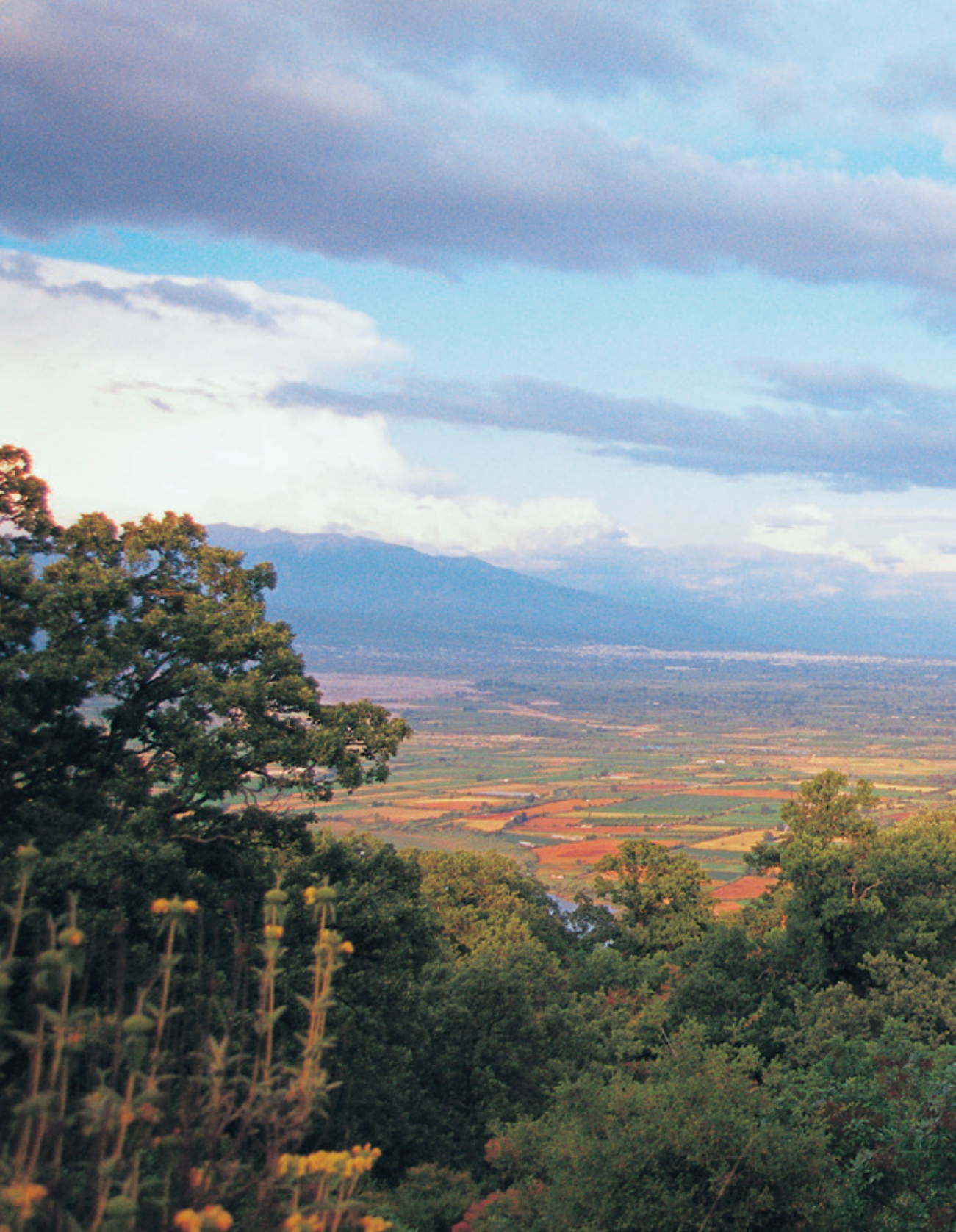
Θέα προς τον κάμπο και το Αγρίνιο, ψηλά από το Λιγοβίτσι