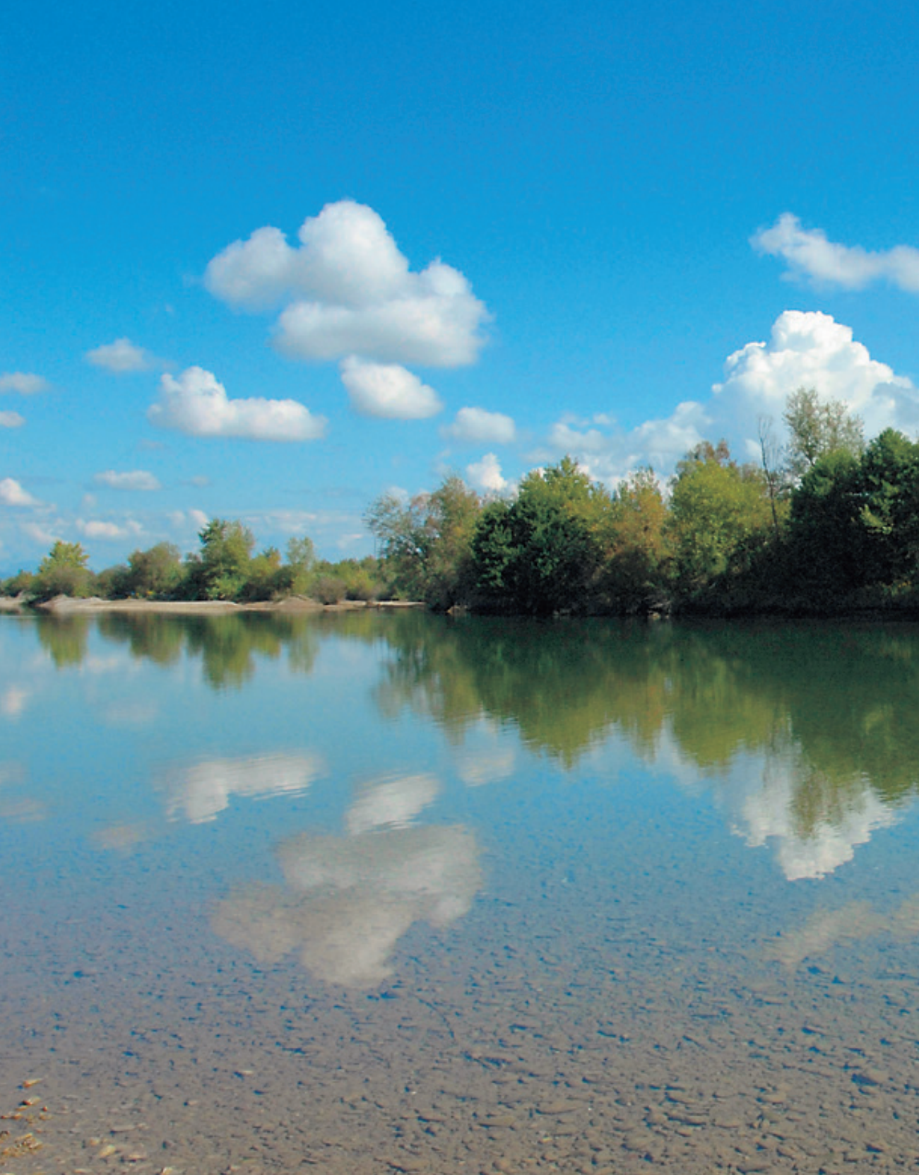
ΠΟΤΑΜΟΣ ΑΧΕΛΩΣ. Το αρχαίο σύνορο ανάμεσα στην Αιτωλία και στην Ακαρνανία.