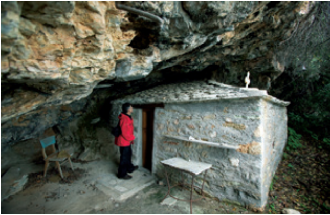
Το ξωκκλήσι της Παναγίας της Ευαγγελίστριας, ένας προορισμός απόκρυφος και δυσπρόσιτος.