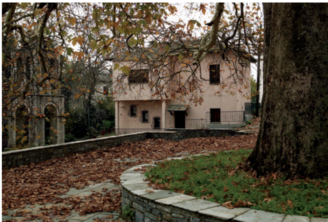
Πλατεία και καμπαριό της Αγ. Κυριακής.