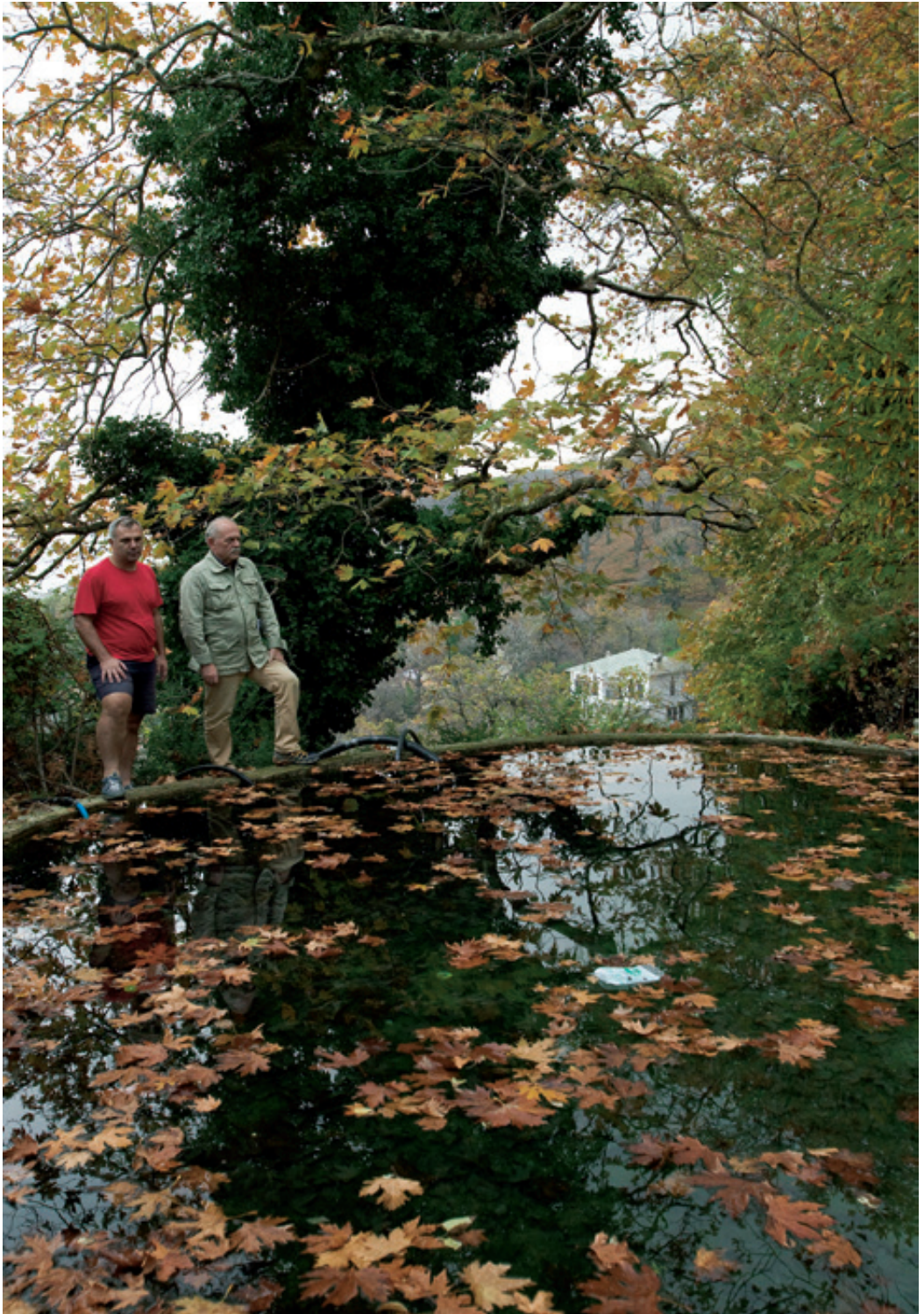
Η στέργα στον αυχένα του Ξουρικτιού, διακοσμημένη με τα χρώματα των φθινοπωρινών Ξερόφυλλων.