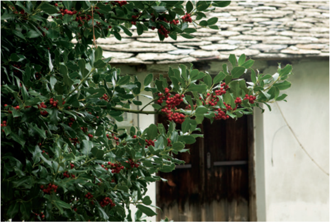
«Λιόπουρνο». Το χαρακτηριστικό και πανέμορφο, χριστουγεννιάτικο δέντρο της Τσαγκαράδας. Στο καταπληκτικό καλντερίμι Ταξιαρχών. Αγ. Παρασκευής. (κάτω και αριστερά)