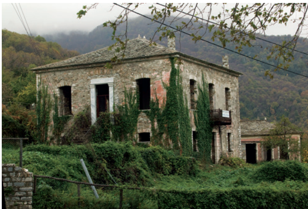
Μισοερειπωμένο νεοκλασσικό του 1908 έξω από την πλατεία του Αγ. Στεφάνου, που έχει μπει σε πρόγραμμα ανακαίνισης. Λεπτομέρεια από τις «Τρεις Βρύσες».