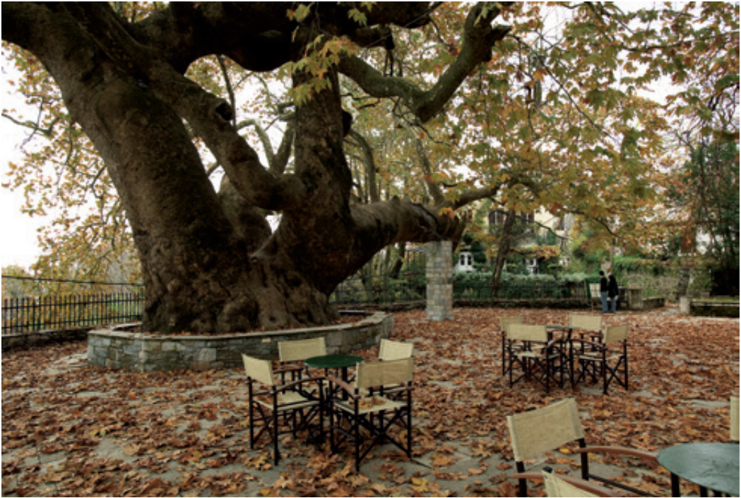
Φθινοπωρινή εικόνα της διάσημης πλατείας της Αγ. Παρασκευής με το χιλιόχρονο πλατάνι. Αναρίθμητες οι βρύσες της Τσαγκαράδας, όλες με υπέροχο βουνίσιο νερό.