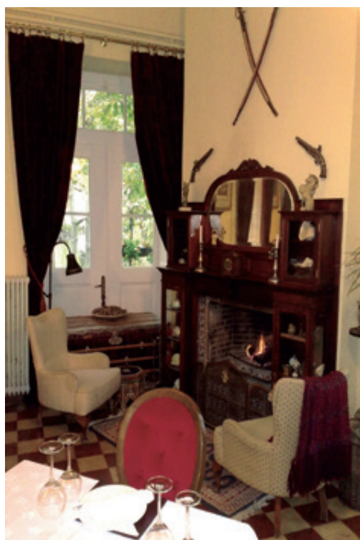
ΦΩΤ. ΑΡΧΕΙΟ ΞΑΜ. ΜΟΝΟΚΕΡΩ