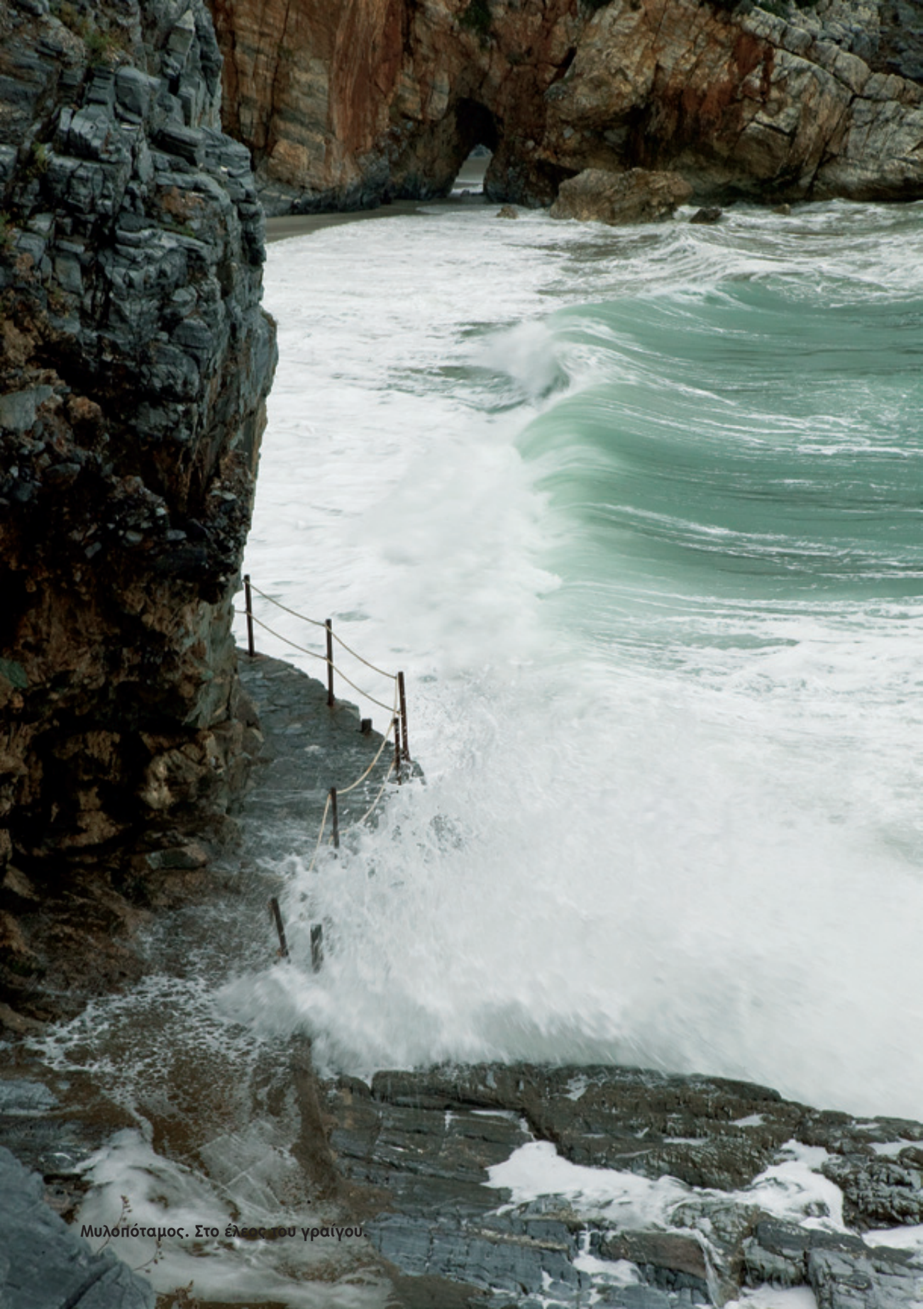
Μυλοπόταμος. Στο έλος του γράιγου.