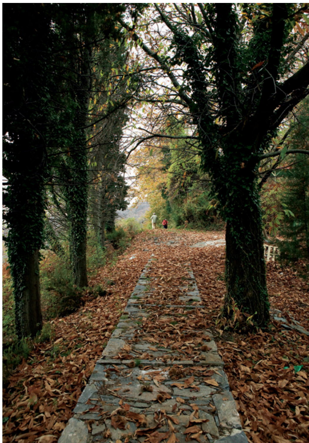
Το μαγευτικό καλντεριμάκι από την στέρνα στο Ξουρίτσι.