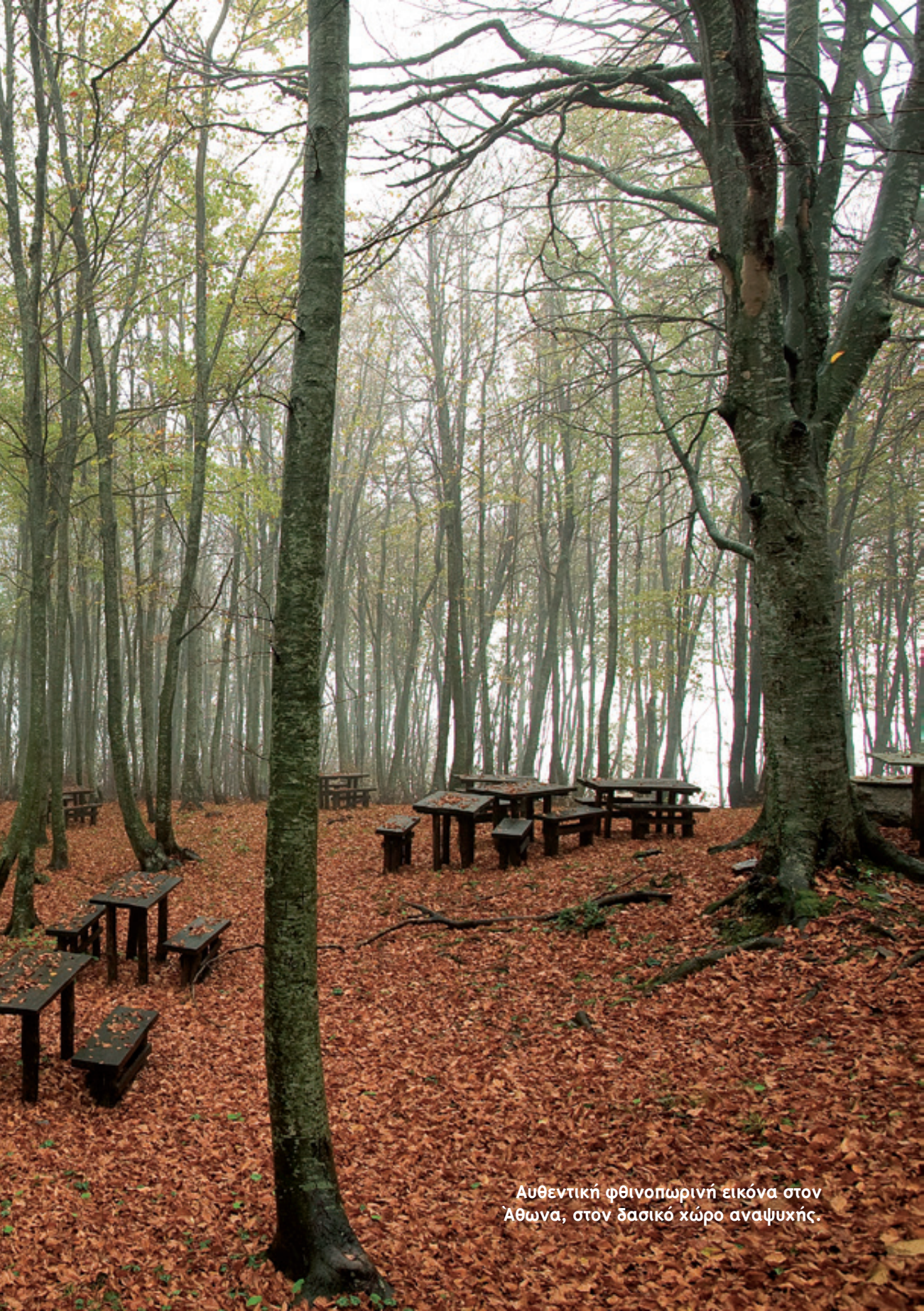
Αυθεντική φθινοπωρινή εικόνα στον Άθωνα, στον δασικό χώρο αναψυχής.