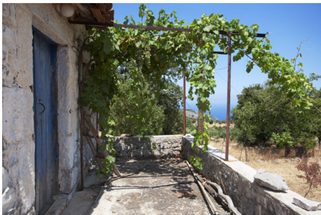
ΣΤΟ ΕΡΗΜΙΚΟ ΛΟΓΓΑΡΙ - ΡΟΥΠΑΚΙΟ. ΣΤΗΝ ΒΛΥΧΑΔΑ ΤΟΥ ΦΩΚΙΑΝΟΥ. (ΚΑΤΩ) Η ΚΥΡΑ ΣΤΑΜΑΤΙΑ ΚΑΙ Η ΑΛΙΚΗ ΤΗΣ. (ΑΡΙΣΤΕΡΑ)