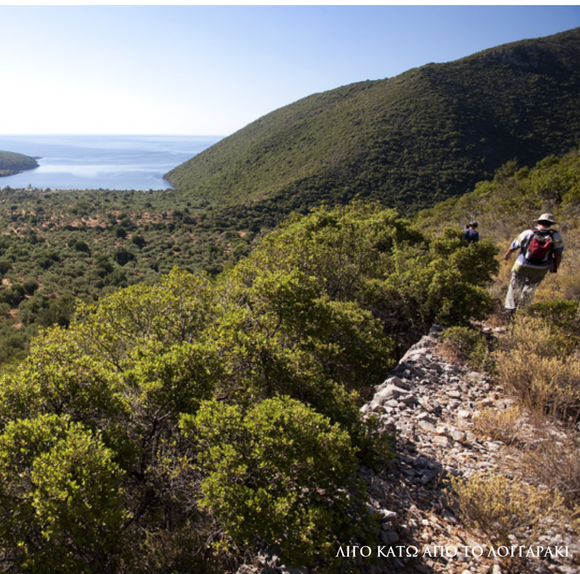
ΛΙΓΟ ΚΑΤΩ ΑΠΟ ΤΟ ΛΟΓΓΑΡΑΚΙ

βοτσαλωτή μεγάλη παραλία του Φωκιανού που λαμποκοπάει κάτω από το δυνατό φως του πρωινού.