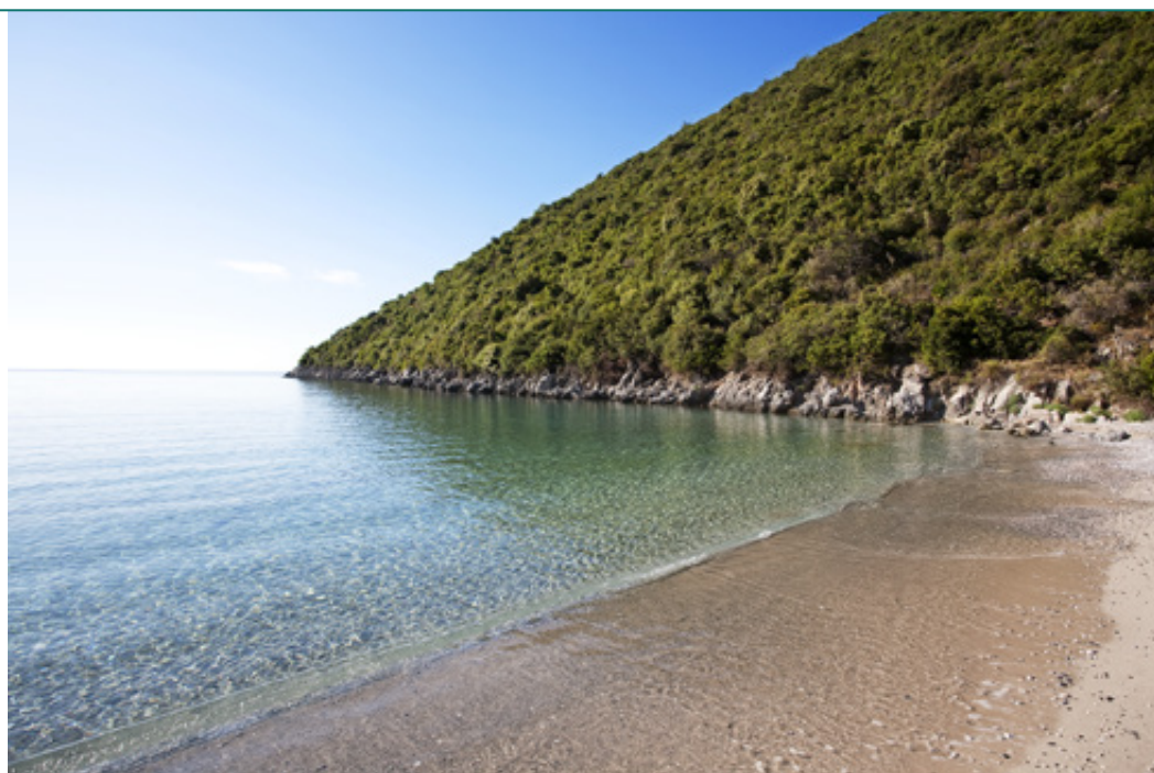
ΣΤΗΝ ΠΑΡΑΛΙΑ ΦΩΚΙΑΝΟΥ ΚΑΙ ΣΤΟ ΧΩΡΙΟ ΠΗΓΑΔΙ