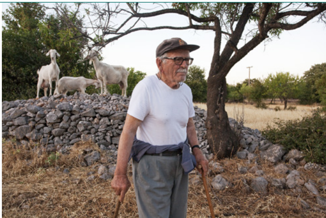
ΣΤΗΝ ΠΑΡΑΛΙΑ ΦΩΚΙΑΝΟΥ ΚΑΙ ΣΤΟ ΧΩΡΙΟ ΠΗΓΑΔΙ