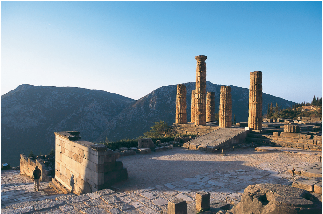
Όψεις από τον αρχαιολογικό χώρο των Δελφών, του περιφήμου "Ομφαλού της γης" των αρχαίων Ελλήνων.