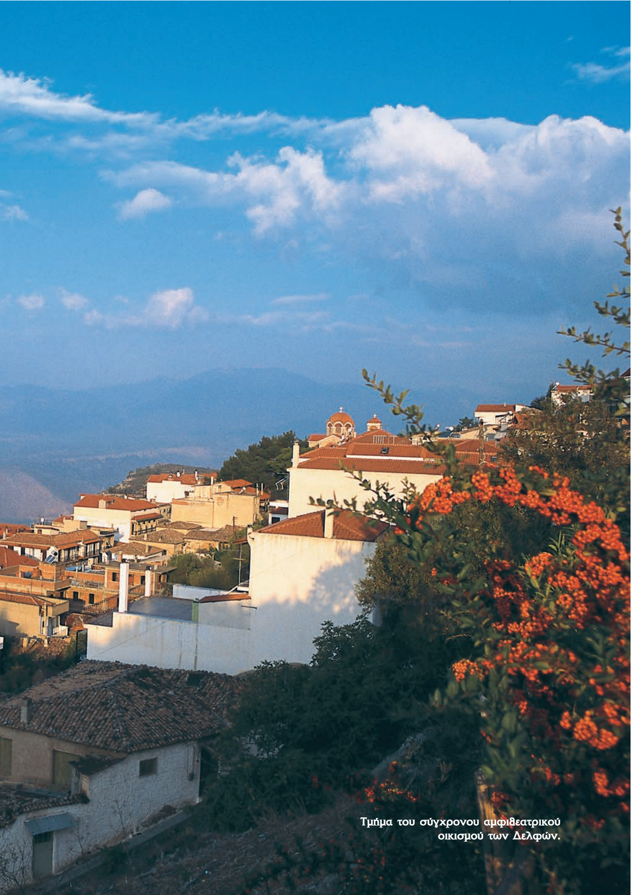
Τμήμα του σύγχρονου αμφιθεατρικού οικισμού των Δελφών.