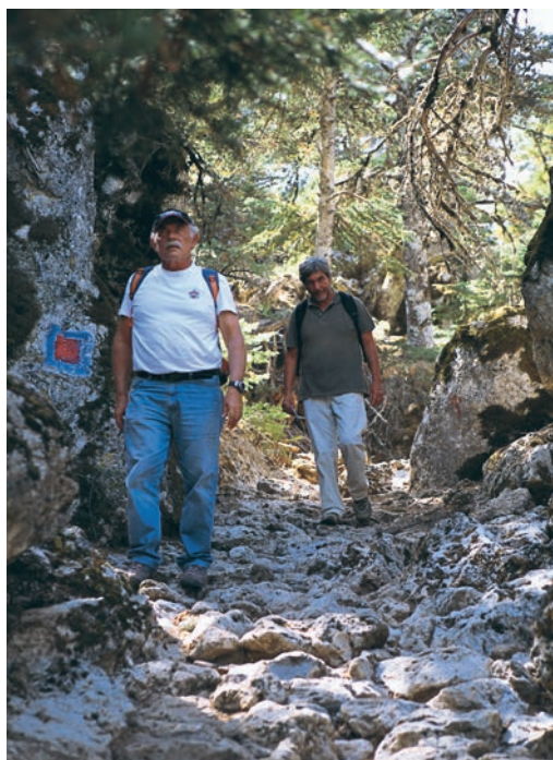
Το αρχαίο λιθόστρωτο με τα σποραδικά σκαλοπάτια στο μονοπάτι από το Κωρύκειο Άντρον στους Δελφούς. (δεξιά)

ληλων ελιγμών μακραίνει την απόσταση, εξασφαλίζει όμως ήπιες κλίσεις και ανετώτερη κατάβαση. Το αρχαίο μονοπάτι φέρει σε πυκνά διαστήματα σκαλοπάτια σκαλισμένα στο βράχο, που του έδωσαν την ονομασία " Κακιά Σκάλα ". (11) Οι παλιοί λίθοι είναι στρογγυλεμένοι από την μακραίωνη χρήση. Τα τοιχώματα επίσης που στηρίζουν το μονοπάτι αποτελούνται από μεγάλους λίθους, οι περισσότεροι από τους οποίους έχουν εμφανή την αρχαία τους προέλευση. Νιώθουμε ευτυχείς που βαδίζουμε σ' αυτό το διάσημο αρχαίο μονοπάτι πάνω από την πολιτεία των Δελφών. Τρεις ως τρισήμιση ώρες διαρκεί η κατάβαση από το Κωρύκειο Άντρο ως τα πρώτα σπίτια των Δελφών. Το τελευταίο τμήμα του μονοπατιού είναι χωμάτινο και απότομο, διαφέρει πολύ από τις ήπιες κλίσεις του αρχαίου λιθόστρωτου. Ατενίζουμε για λίγο χαμηλά το