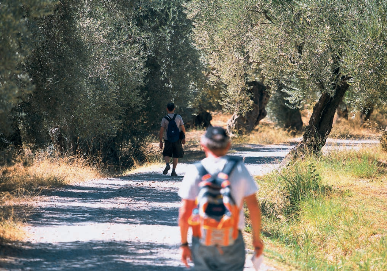
Διάσχιση του περιφνημου ελαιώνα της Αμφισσας με τα αιωνόβια δέντρα και το δαυμάσιο αρδευτικό σύστημα.