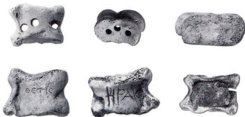
Τμήμα της πελώριας αίθουσας του Κωρύκειου Άντρου και μερικοί από τους 2.500 τρυπημένους αστραγάλους (σε σύνολο 25.000 ! ) που βρέθηκαν στο σπήλαιο.