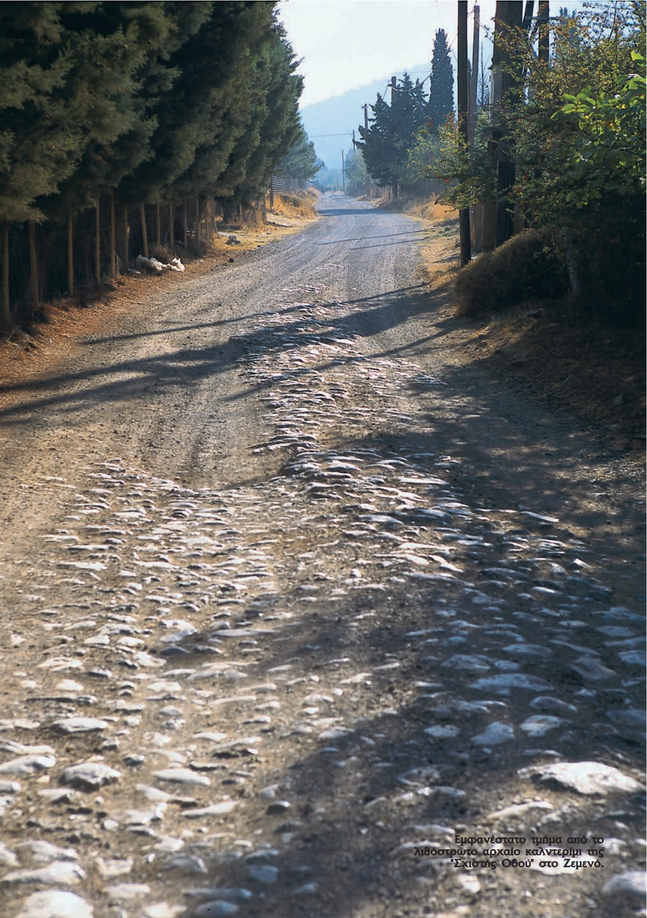
Εμφανέστατο τμήμα από το λιθόστρωτο αρχαιοκαλλιτεχνικό της "Σχιστής Οδού" στο Ζεμενό.