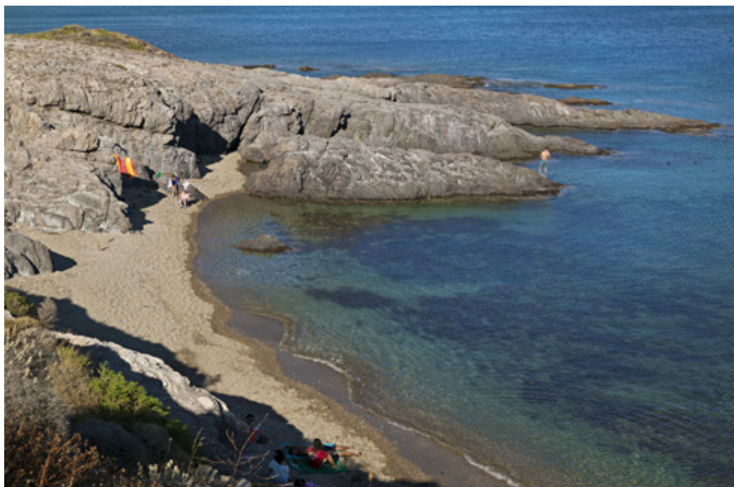
Όμορφο αμμουδερό κολπάκι λίγο έξω από τον οικισμό των Ψαρών.