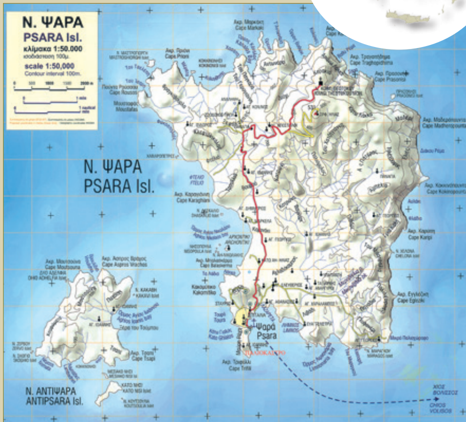
Χάρτης Ψαρών 1:50.000 των εκδόσεων ΑΝΑΒΑΣΗ