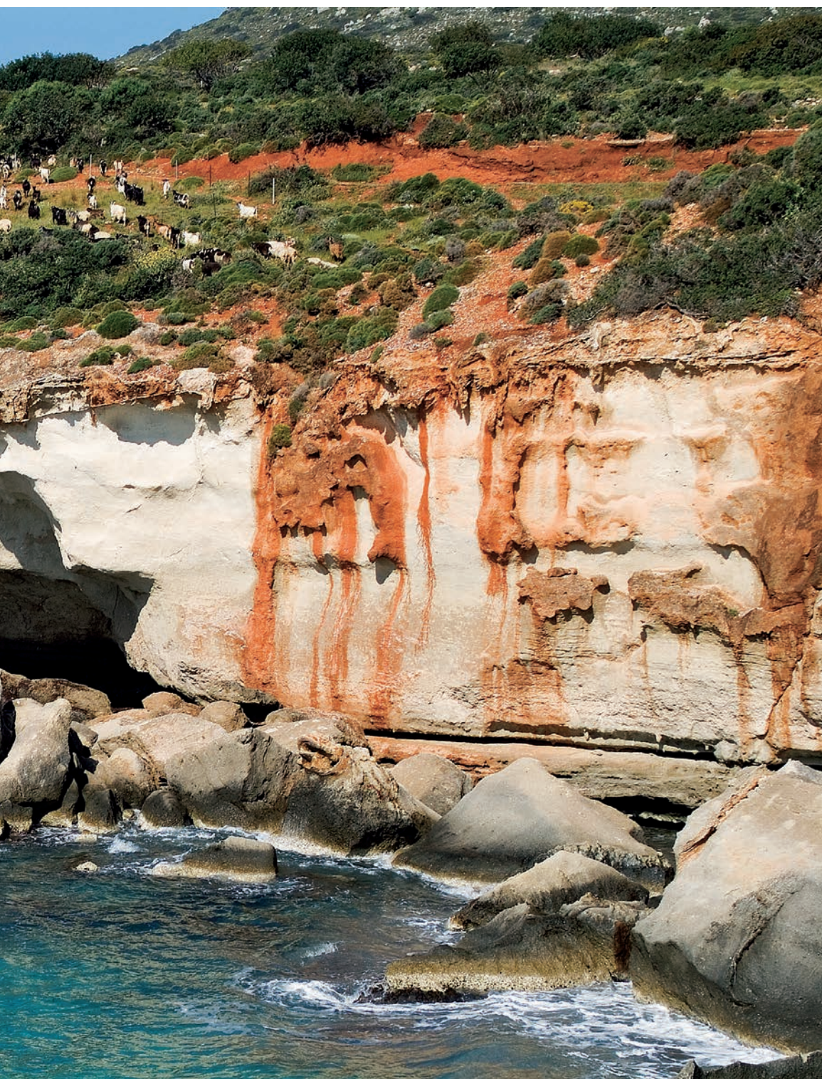
κοπάδια των κασικιών