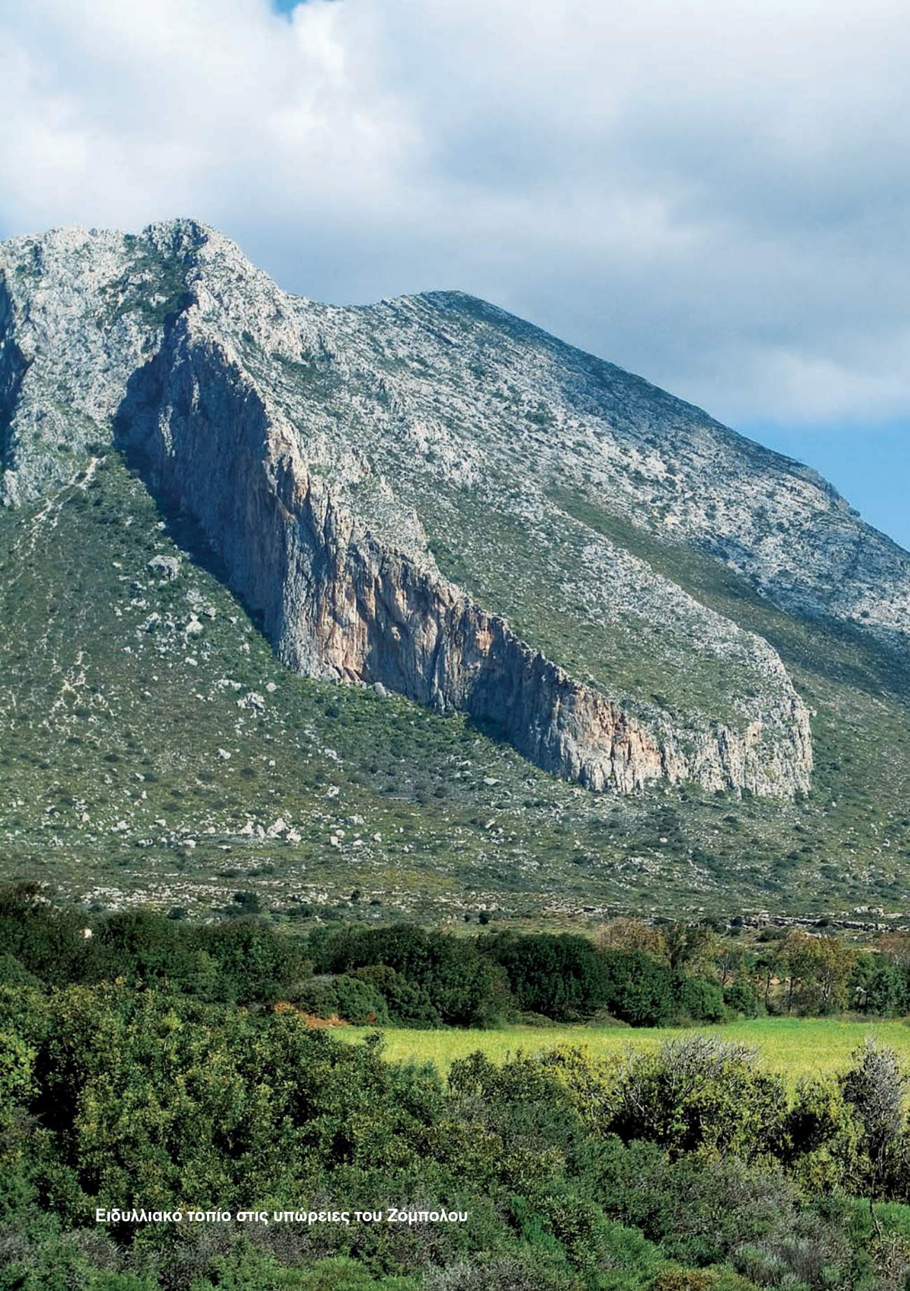
Ειδυλλιακό τοπίο στις υπώρειες του Ζόμπολου