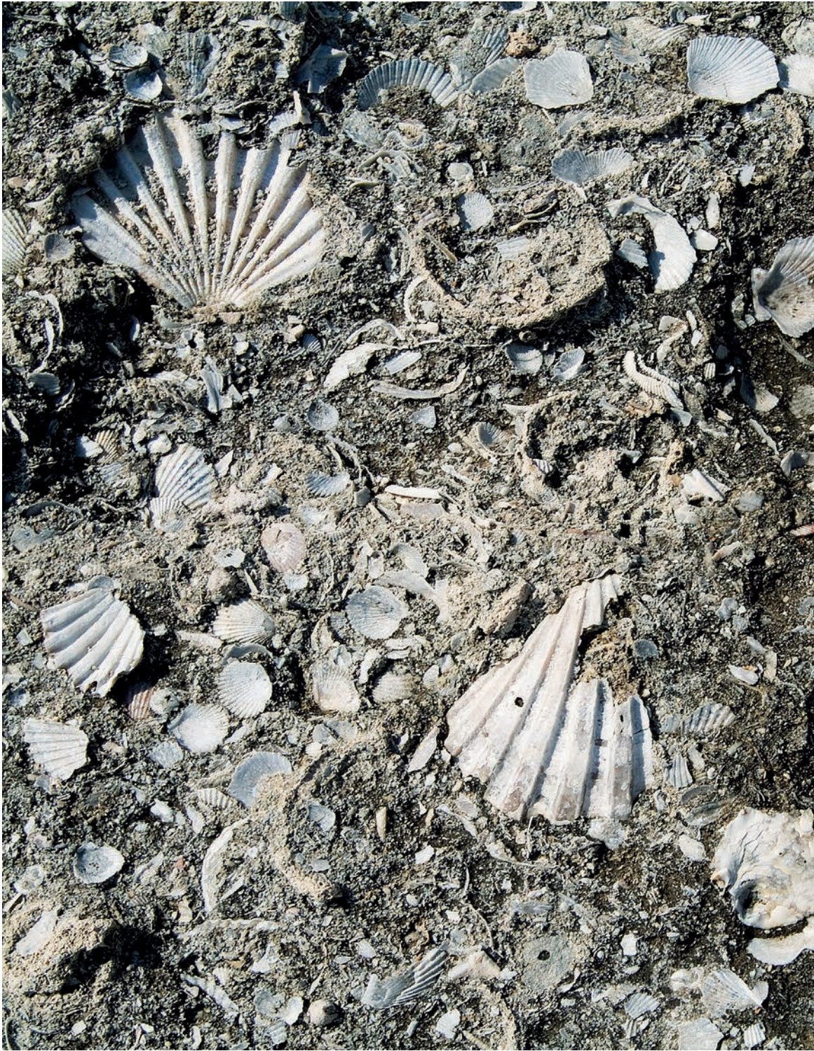
ΕΝΤΥΠΩΣΙΑΚΟ ΜΩΣΑΪΚΟ από αναρίθμητα απολιθωμένα όστρακα