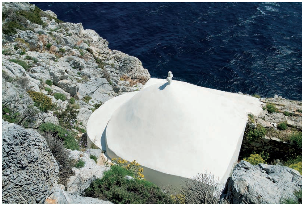
Ο ΛΕΥΚΟΣ ΤΡΟΥΛΟΣ και το κατάγραφο εσωτερικό του παρεκκλησιού του Αγ. Γεωργίου. Τμήμα του ερειπωμένου ναού των Αγίων Τεσσαράκοντα Μαρτύρων. (Αριστερά)