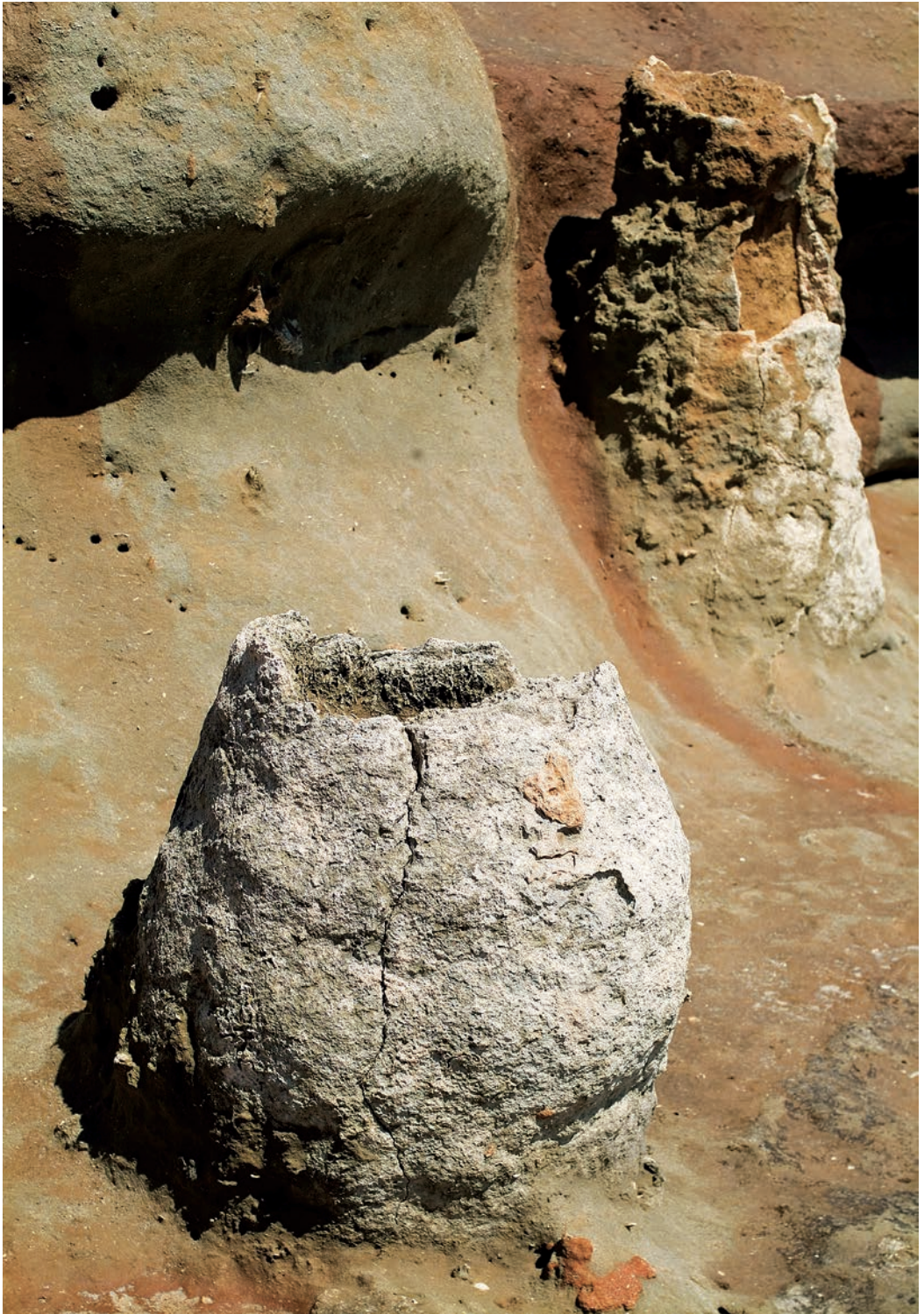
ΠΕΤΡΙΝΕΣ ΦΟΡΜΕΣ με την σφραγίδα της συγκλονιστικής λιτότητας είναι μοναδικά.