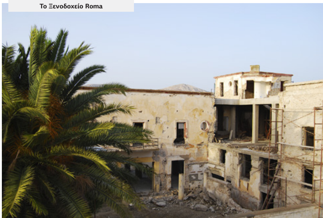
Το Ξενοδοχείο Roma

Μ ετά την αποχώρηση των Ιταλών και την απαλευθέρωση της Δωδεκανήσου το 1947 το Διεθνές Στυλ εντελώς ξένο -η αλήθεια είναι- προς τη ελληνική νησιώτικη αισθητική και συνυφασμένο με τον Ιταλικό φασισμό περιφρονήθηκε και σε κάποιες περιπτώσεις αλλοτριώθηκε από ατυχείς αρχιτεκτονικές