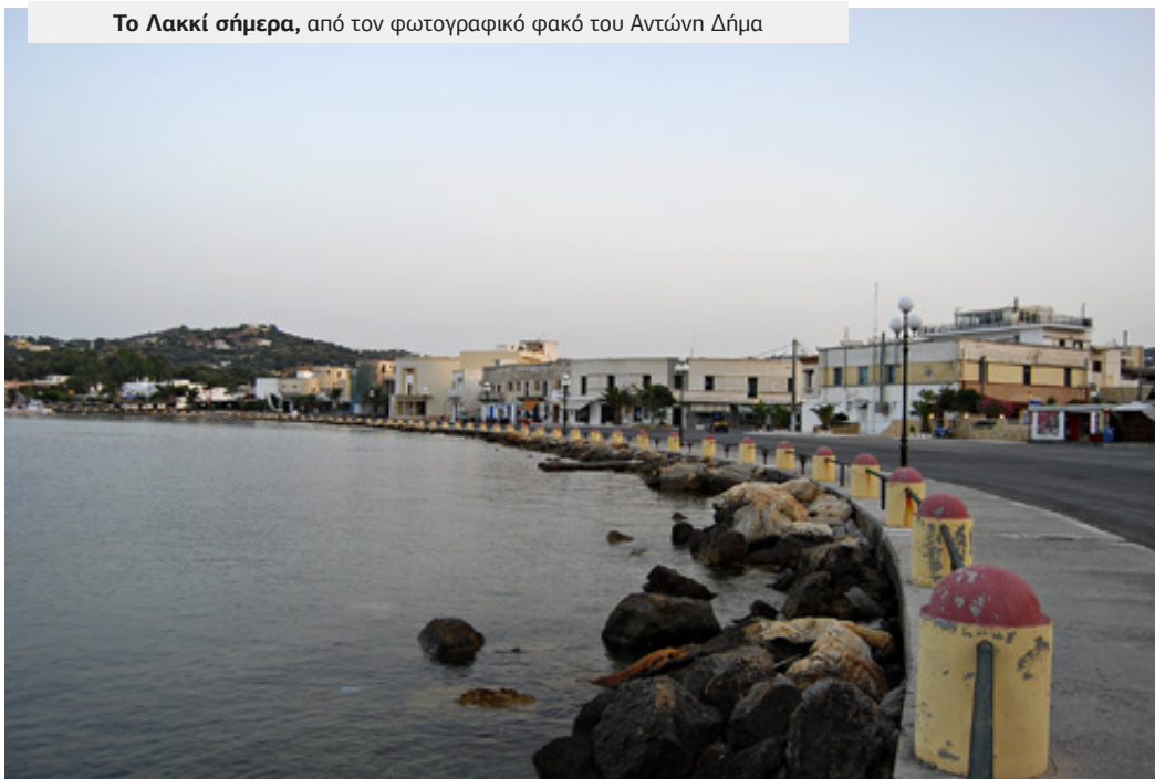
Το Λακκί σήμερα

Φυτεύτηκαν ευκάλυπτοι, τοποθετήθηκαν κορμοί δέντρων και ρίχτηκαν τόνοι μπετόν προκειμένου να δημιουργηθεί το κατάλληλο υπόστρωμα για την κατασκευή της προκυμαίας και τη θεμελίωση των κτιρίων.