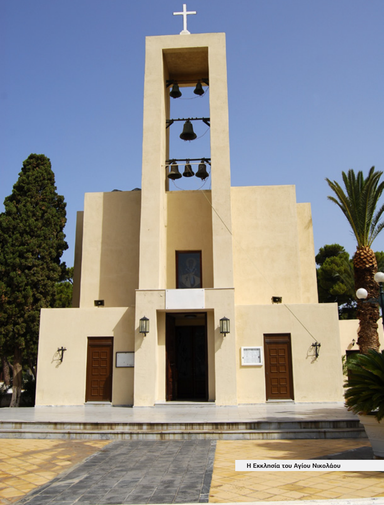
Η Εκκλησία του Αγίου Νικολάου