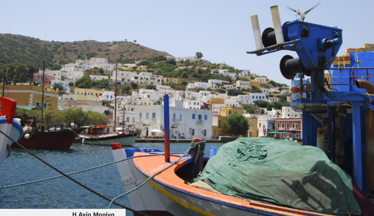
Η Αγία Μαρίνα

λεπτομέρειες από την επίσκεψή μου στο μουσείο των Τούνελ. Έμαθα ότι το ιταλικό υποβρύχιο Delfino που τορπίλισε την «Ελλη» στις 17 Αυγούστου του 1940 ξεκίνησε από τη Λέρο, αφού ναυλοχούσε στο Λακκί. Έμαθα ότι στο διάστημα Σεπτεμβρίου 1943 (όταν και οι Ιταλοί συνθηκολόγησαν και άλλαξαν στρατόπεδο) – Νοεμβρίου 1943 στη Λέρο έγιναν 984 αεροπορικές επιδρομές και έπεσαν περίπου 1100 τόνοι βόμβες. Έμαθα τέλος ότι η μάχη της Λέρου με την επιτυχημένη απόβαση των Γερμανών εναντίον των συνασπισμένων Ιταλών και Άγγλων (άλλες 705 επιδρομές και 587 τόνοι βομβών) αποτέλεσε την τελευταία ίσως σημαντική νίκη τους στη διάρκεια του Β' παγκοσμίου πολέμου.