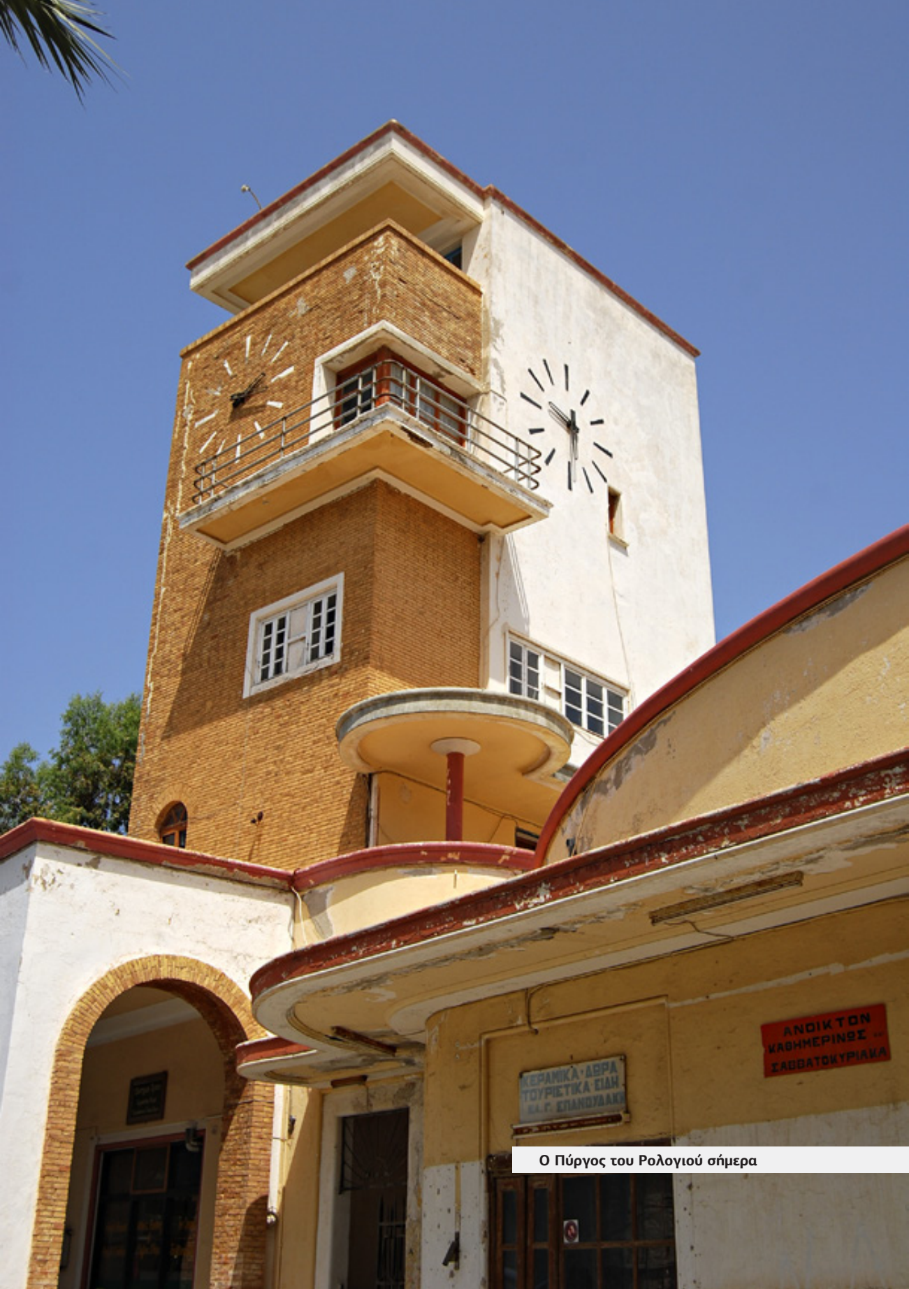
Ο Πύργος του Ρολογιού σήμερα