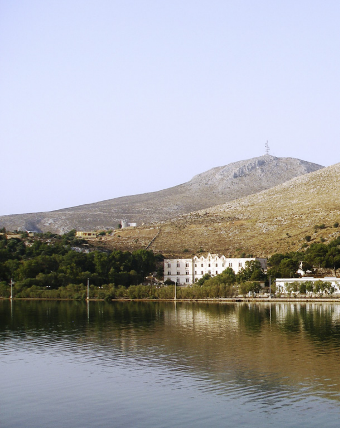
Το κτίριο διοίκησης της αεροναυτικής βάσης και το κτίριο διαμονής των ιταλών αξιωματικών στα Λέπιδα