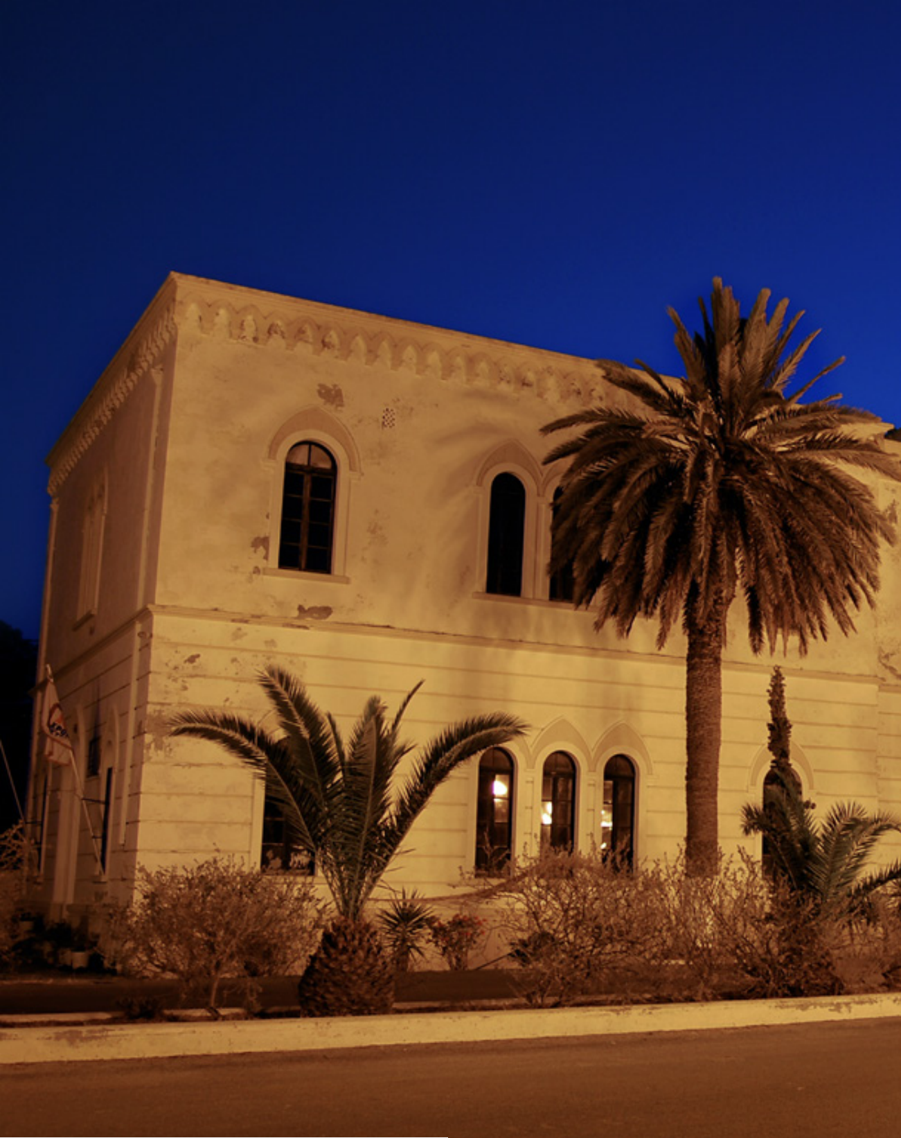
Το Διοικητήριο, σε νυχτερινή φωτογράφιση