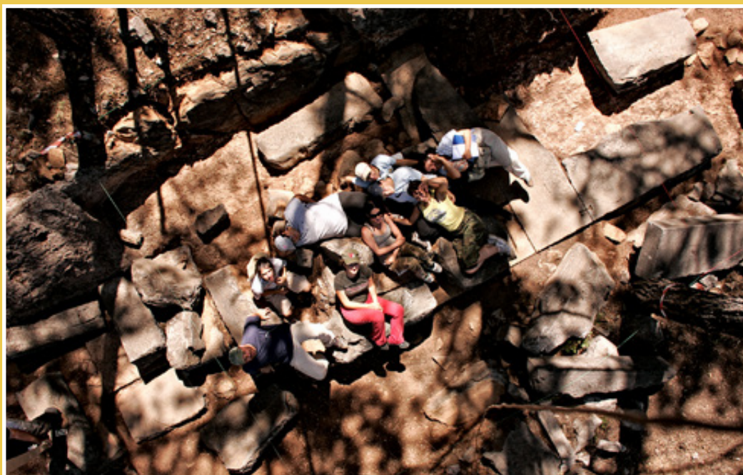
Κάθετη φωτογράφιση μνημείου στη νεκρόπολη της Κυμισάλας από τη Σχολή Αγρονόμων Τοπογράφων Μηχανικών του Εθνικού Μετσόβιου Πολυτεχνείου.

της Κυμισάλας, θα μπορούσε να οδηγήσει σύντομα στη δημιουργία ενός μοναδικού αρχαιολογικού-οικολογικού πάρκου , το οποίο θα διασφαλίσει τη φυσιογνωμία της περιοχής, θα αναδείξει τα ιδιαίτερα πολιτισμικά, φυσικά και ποιοτικά χαρακτηριστικά του τόπου και θα οδηγήσει σε μια ήπια, αειφορική και βιώσιμη ανάπτυξη την ημιορεινή περιοχή του Ακραμίτη.