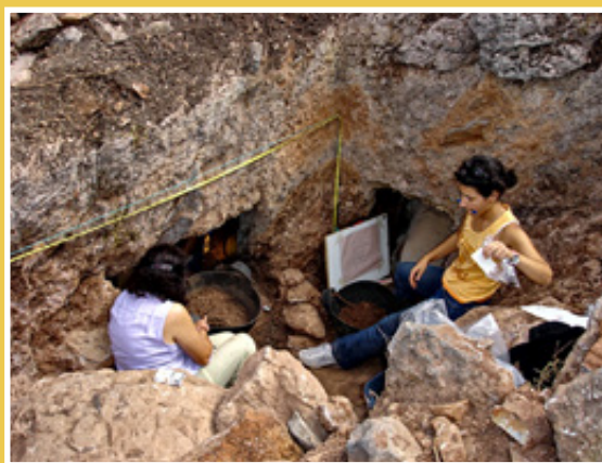
Επάνω αριστερά: Αρχαιολογική έρευνα στη νεκρόπολη της Κυμισιάλας. Κάτω αριστερά: ανασκαφή λαξευτού τάφου. Επάνω-δεξιά: ταφικά βάθρα στη νεκρόπολη της Κυμισιάλας.