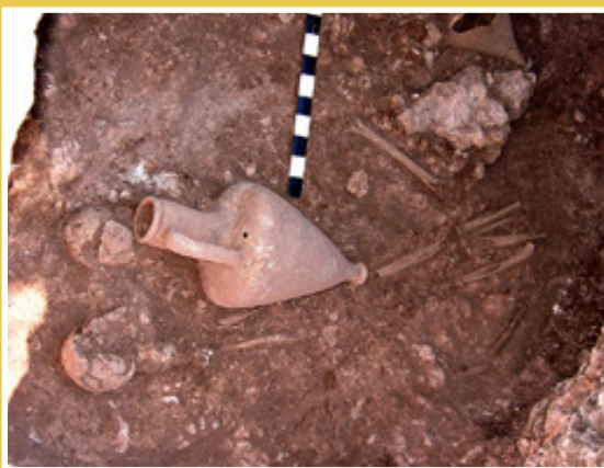
Επάνω: η περίφημη Στήλη της Κυμισάλας που απεικονίζει έξι πτηνά, και ευρήματα από τις ανασκαφές στη νεκρόπολη.

Από το αρχαϊκό τμήμα της κεντρικής νεκρόπολης προέρχεται η περίφημη Στήλη της Κυμισάλας , ένα επιτύμβιο σήμα από ασβεστόλιθο, που σώζεται σε ύψος 83 εκ . Έχει τη μορφή χοντρού δίσκου πάνω σε πεσσό και επιστέφεται στην κορυφή της από έναν ορθογώνιο πλίνθο, πάνω στον οποίο στηριζόταν κάποιο επιπρόσθετο στοιχείο. Στον δίσκο απεικονίζονται, σε αβαθές εσώγλυφο, έξι πτηνά εντός οδοντωτού εγχάρακτου κοσμήματος που περιτρέχει ολόκληρη την πλευρά, ενώ ένας μεγαλύτερος εννέαφυλλος, εντός αντίστοιχου οδοντωτού κοσμήματος, υπάρχουν στην άλλη πλευρά. Πρόκειται για ένα από τα πρωιμότερα σωζόμενα μνημεία της νεκρόπολης, που φαίνεται να έχει ομοιότητες με