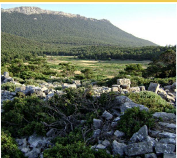
Επάνω: το μικρό αλλά εύφορο λεκανοπέδιο του Βασιλικού.