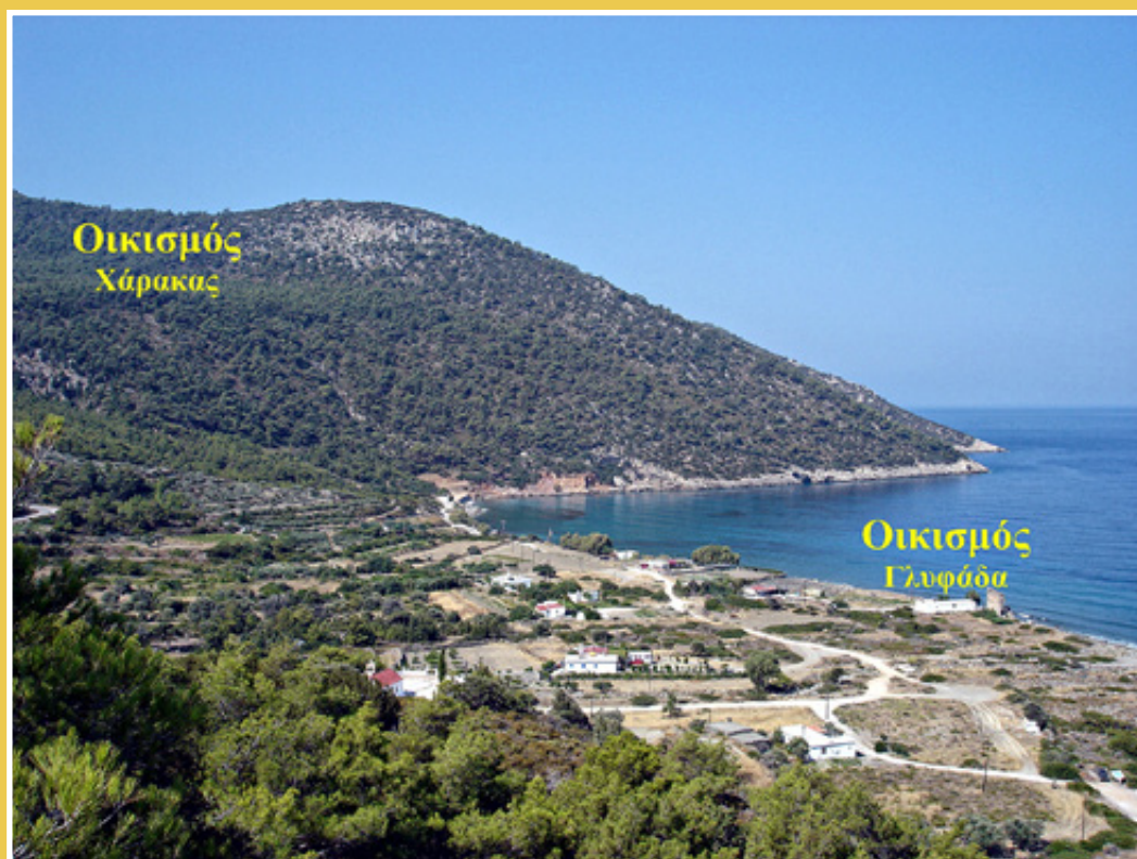
Επάνω: φωτογραφία της περιοχής με τις θέσεις των οικισμών "Χάρακας" και "Γλυφάδα".

Ένας εκτεταμένος ελεύθερος χώρος ξεχωρίζει, καθώς περικλείεται από ισχυρό περίβολο. Στα βορειοδυτικά του διαμορφώνονται δωμάτια και κατά μήκος της ανατολικής του πλευράς επιμήκης στενός διάδρομος. Αμέσως βόρεια του περιβόλου εκτείνονται σειρές δωματίων από οικίες που τις χωρίζει δρόμος με κατεύθυνση από ανατολή προς δύση. Δεύτερος δρόμος, κάθετος προς τον προηγούμενο, διέρχεται ανατολικότερα. Οι τοίχοι των κτισμάτων σώζονται σε μερικά σημεία σε αρκετό ύψος, ενώ σε διάφορα σημεία διατηρούνται στη θέση τους παραστάδες θυραίων ανοιγμάτων και κατώφλια, μάρτυρες ενός ακμάζοντος και πυκνοκατοικημένου άλλοτε οικισμού, ο οποίος εκμεταλλευόταν το μικρό, αλλά εύφορο, λεκανοπέδιο του Βασιλικού, που εκτείνεται στα νοτιοδυτικά του.