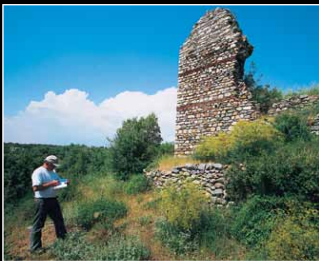
Ο ΒΔ πύργος της μεσοβυζαντινής οχύρωσης.

Χαρακτηριστικά για την παλαιοχριστιανική και μεσοβυζαντινή περίοδο κλητήματα (επιγραφές, κεραμική, νομίσματα, μικροαντιείμενα, κ.ά.) από τον Άγιο Χαράλαμπο, τη Σύναξη και την Παλιόχωρα εκπροσώπησαν το χώρο της Θράκης σε πανελλήνια και διεθνή συνέδρια και εκθέσεις. Η Μαρώνεια αποτελεί ένα βασικό σταθμό στον αρχαιολογικό χάρτη της Θράκης για τα βυζαντινά χρόνια και το μοναδικό ίσως για τα παλαιοχριστιανικά. Τα αρχαιολογικά ευρήματα, αν και διάσπαρτα σε ανασκαφικές νησίδες μέσα στον εκτενέστατο αρχαιολογικό χώρο, συγκλίνουν στην άποψη ότι η Μαρώνεια συγκεντρώνει μεγάλο ενδιαφέρον, όσον αφορά τις ιδιαιτερότητες των επί μέρους μνημείων της, που όμως δεν αποβαίνουν σε βάρος της διαχρονικής της σημασίας. Είναι λοιπόν επιτακτική η δημιουργία Ενιαίου Αρχαιολογικού Χώρου στη Μαρώνεια, που να συγκεράζει τα πιο ουσιαστικά στοιχεία για την εικόνα της την αρχαία και τη βυζαντινή εποχή, δίνοντας έμφαση τόσο στην ανάδειξη των εκκλησιαστικών κτισμάτων, όσο και στην διερεύνηση πτυχών της καθημερινής ζωής.