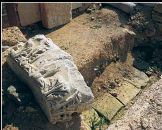
Τμήμα τα αρχαίου οικοδομικού υλικού από την παλαιοχριστιανική βασιλική στην Παλιόχωρα.