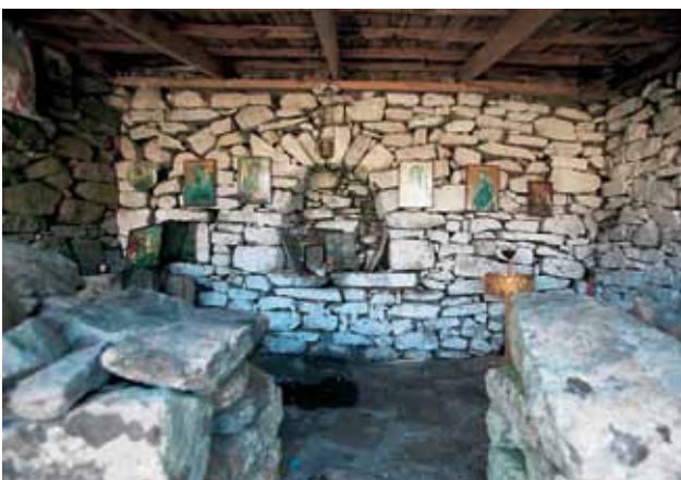
Εσωτερικό του μεταβυζαντινού εξωκκλησιού του Αγ. Γεωργίου. Στο κυκλώπιο τείχος της αρχαίας ακρόπολης του Αγ. Γεωργίου. (αριστερά)

Η Μαρώνεια ιδρύθηκε από χιώτες αποίκους στις νοτιοδυτικές πλαγιές του Ίσμαρου το πρώτο μισό του 7ου αι. π.Χ. Η θέση της Μαρώνειας στην ακτή του Ισμαρού, πάνω στους θαλάσσιους δρόμους του βόρειου Αιγαίου και κοντά στις διαβάσεις της Ροδόπης, αποτέλεσε την κυριότερη αιτία για την ανάπτυξη εμπορικών ανταλλαγών με τις άλλες ελληνικές πόλεις και κυρίως με τους Θράκες της ενδοχώρας. Η οικονομική ανάπτυξη μετέβαλε την πόλη σε ισχυρή πολιτική και στρατιωτική δύναμη του βορρά, και συγχρόνως σε ένα σημαντικό κέντρο πολιτισμού το οποίο συνέβαλε στη διάδοση της ελληνικής παιδείας ως τις πιο μακρινές εστίες των θρακικών φύλων.