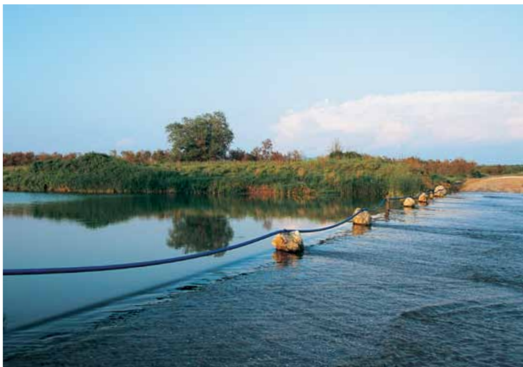
Η κοίτη του Λίσσου ποταμού, χωρίς γέφυρα και με άφθονο νερό. Οι τελευταίες ακτίνες καθρεφτίζονται στα νερά του υγροτόπου του Προφήτη Ηλία.