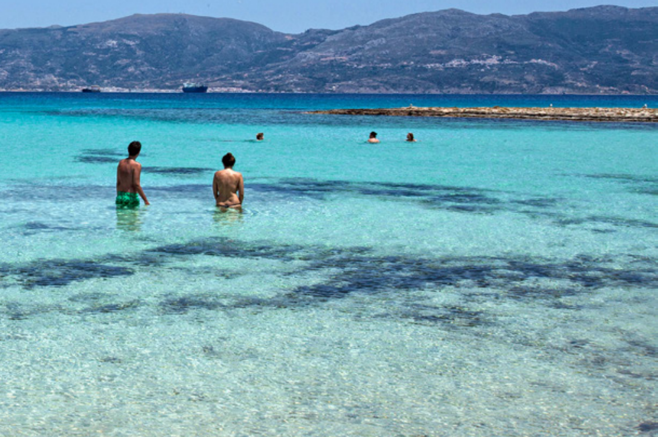
Παραλία της Λεύκης. Μια απίστευτη φυσική πισίνα, πρόγευση των εξωτικών παραλιών του Σίμου.

Τηγάδι , που φιλοξενεί όλα τα αλιευτικά και τα σκάφη αναψυχής. 200 περίπου μέτρα μακριά είναι η προκυμαία, όπου καταφθάνουν κάθε μισή ώρα ή αποπλέουν για την Πούντα τα Ferry boats. Καθώς προχωράει το δειλινό και παίρνει να δροσίζει, η κίνηση στον παραθαλάσσιο δρόμο ζωηρεύει. Γεμίζουν τα ζαχαροπλαστεία και τα καφέ, πρώτα τα τραπεζάκια δίπλα στο νερό. Στα ταβερνάκια και ουζερί όλα είναι έτοιμα για τις χαλαρές ώρες του βραδινού φαγητού. Ήδη με τις πνοές του ανέμου καταφθάνουν οι πρώτες γαργαλιστικές οσμές, από ψαράκια ψητά ή τηγανιτά.