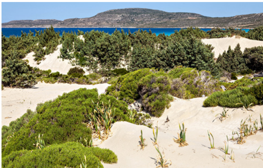
Εκτεταμένοι αμμόλοφοι και αυτοφυή κεδροδάση. Αύρα... Αφρικής.

το πέρασμά μας. Σημαντικό επίσης ήταν, πως αν και το μαγαζί ήταν δικό μου, λειτουργούσαμε όλοι σαν ομάδα.