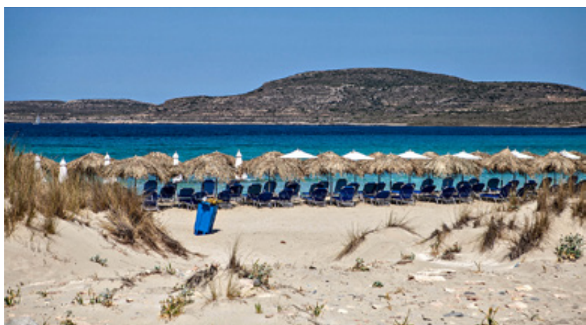
Κάθε ώρα της μέρας και με κάθε καιρό η ομορφιά της Ελαφονήσου είναι εξωτική.

σημασία για την καντίνα είχε η μουσική. Πάντα ποιοτική και ανάλογα με τις ώρες. Άρεσε πολύ στους ανθρώπους. Συνωστιζόνταν πολλές φορές μπροστά στον πάγκο μ' ένα χαρτάκι στο χέρι, για να τους γράψουμε το τραγούδι που έπαιζε εκείνη τη στιγμή.