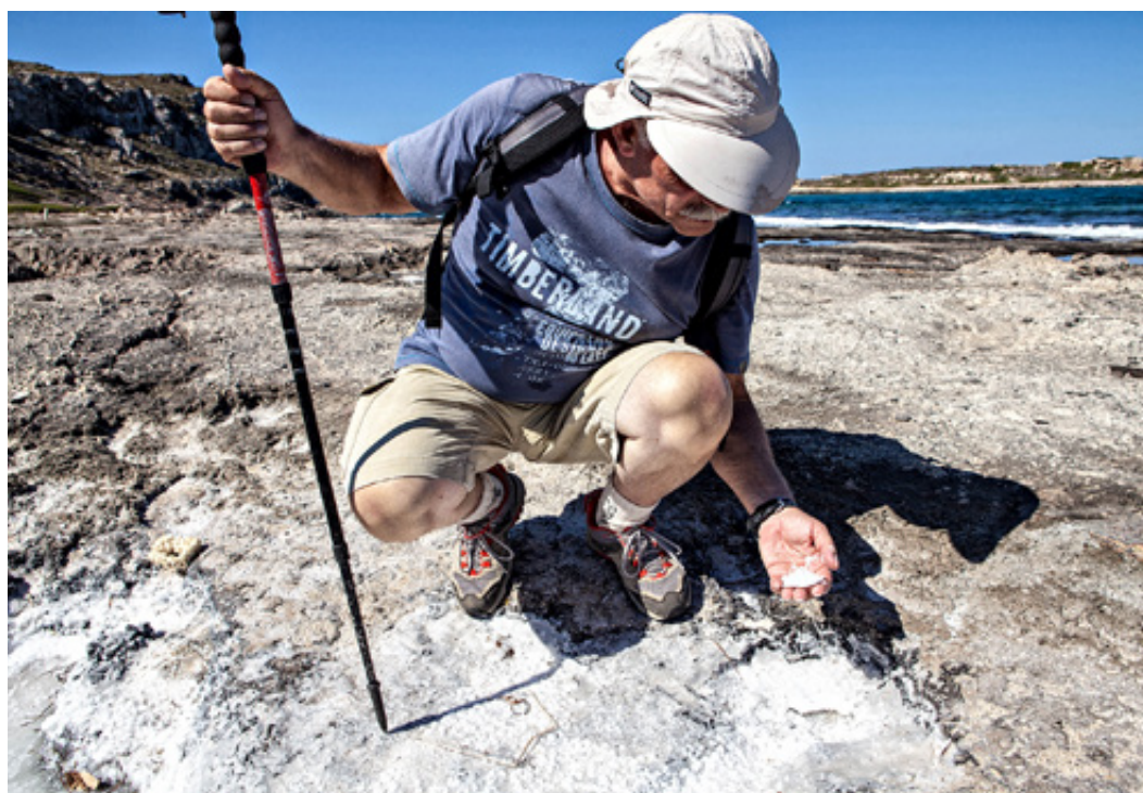
Αλάτι χιονόλευκο. Ο Όσιος Πατάπιος στην άκρη της ακτής και στο βάθος ένα μεγάλο ταξιδιάρικο βαπόρι.