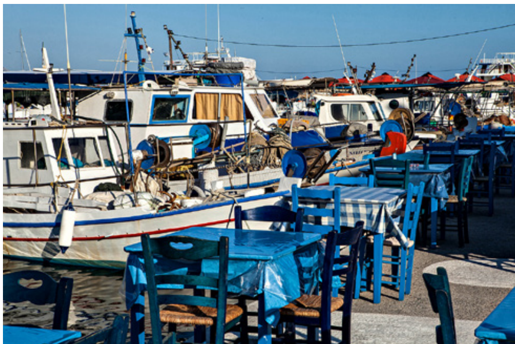
Τραπεζάκια δίπλα στο νερό, ψαρόβαρκες αραγμένες, αυθεντικό νησιώτικο σκηνικό.

αγριότητα από τα μεγάλα κύματα που σκάζουν αφρισμένα με θόρυβο τρομερό.