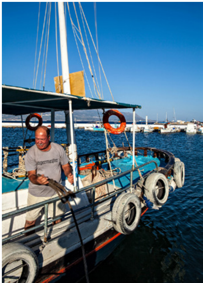
Εικόνες του Σίμου σε μια εποχή που μοιάζει μακρινή. Απλότητα, αθωότητα, μηδαμινά καλούδια στη διάθεση των κατασκηνωτών. Δεξιά, ο "Μπάμπης ο Παππούλης" με τον "Αγωνιστή", όπως είναι σήμερα.

ή από θάλασσα ή από δύσβατο χωματόδρομο. Δεν υπήρχε καμία υποδομή, μόνον ελεύθερη κατασκήνωση. Είχα κατασκηνώσει κι εγώ εκεί, μια δεκαετία πριν. Μετά μου ήρθε η ιδέα της καντίνας. Ήμασταν μια παρέα και αντιμετωπίζαμε διάφορες δυσκολίες, γραφειοκρατικές αλλά και πρακτικές. Πώς στήνεις μαγαζί στη μέση του πουθενά; Χρειαζόμασταν ηλεκτρικό ρεύμα, νερό, μεταφορικό μέσο για τις προμήθειες και την αποκομιδή των σκουπιδιών. Πράγματα αυτονόητα σ' έναν οργανωμένο τόπο αλλά όχι στον Σίμο. Μα και τα χρήματά μας ήταν ελάχιστα. Ωστόσο δεν το βάζαμε κάτω. Τέλος Ιουλίου του '94 ξεκινήσαμε, με τα απολύτως απαραίτητα. Πρώτα μετασκευάσαμε ένα τροχόσπιτο σε καντίνα. Με