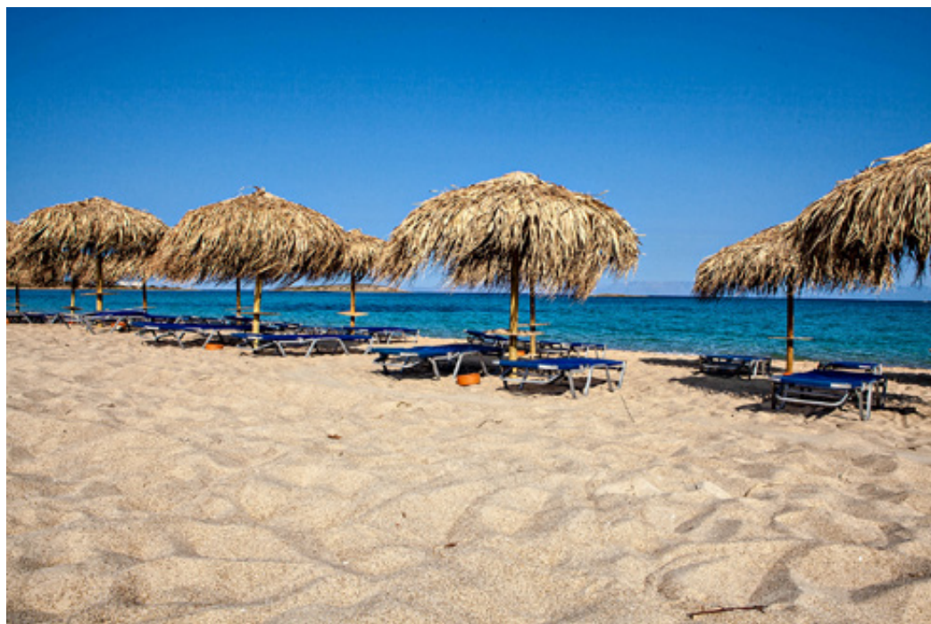
Όρμος "Παναγίας Νησιά". Μια υπέροχη αμμουδερή ακτή στο ΒΔ τμήμα του νησιού.

ο μαϊστρος συνεχίζει ψυχρός, οι πελάτες της Αλεξάνδρας αραιώνουν. Αποχαιρέταμε την φιλόξενη οικογένεια και κατηφορίζουμε πάλι στο επίπεδο της θάλασσας, εκεί όπου λυσομανάει ο καιρός. Λίγα λεπτά αργότερα, στο βεραντάκι της Κρίστης, δεν υπάρχει μαϊστρος και μποφόρια. Μόνο οι βαρκούλες του λιμανιού, που λικνίζονται απαλά.