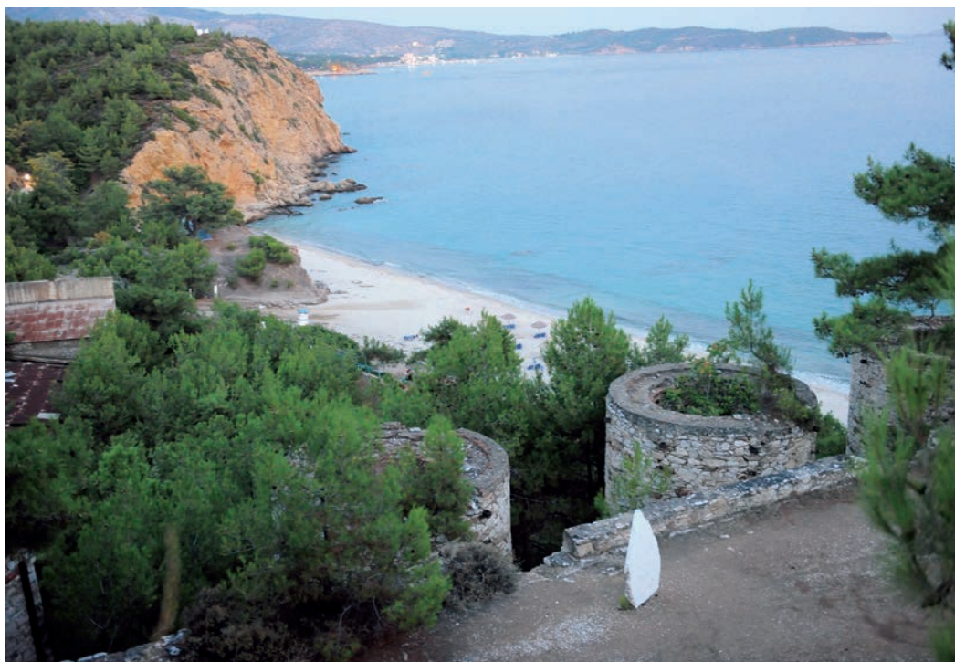
Η παραλία των Μεταλλείων και η Μονή Αρχάγγελου Μιχαήλ, προστάτη του νησιού.