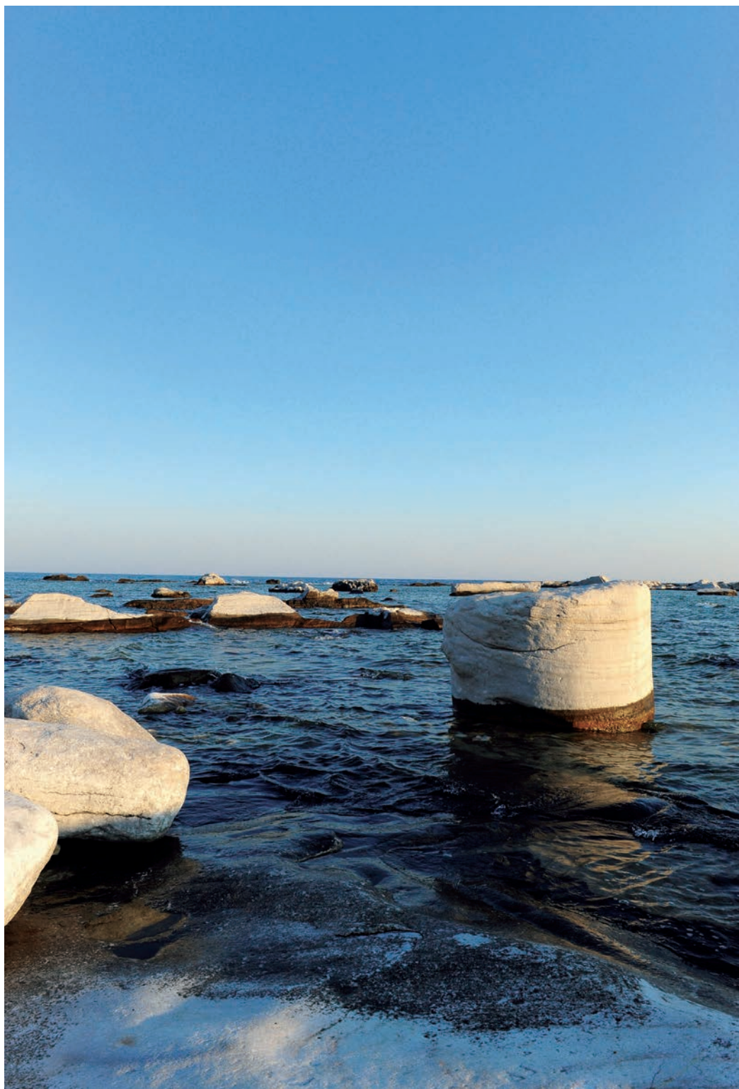
Τα λαξεμένα και γυαλισμένα από τον άνεμο και το νερό λευκά μάρμαρα των αρχαίων λατομείων της Αλυκής.