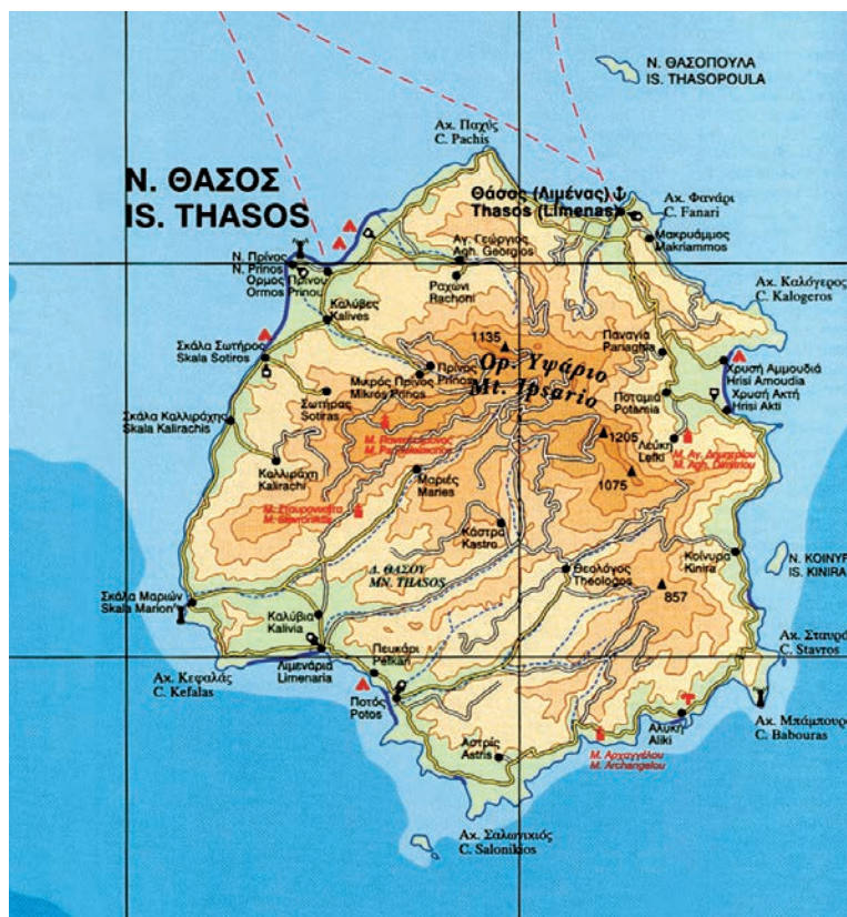
Θάσος. Από τον χάρτη “Μακεδονία” 1 : 250.000 των Εκδόσεων Road.

πρόσωπά μας. Ο Κώστας είναι μαθημένος και δεν σκιαζεται. Περνάμε το Πενκάρι , έναν από τους πρώτους τουριστικούς προορισμούς στη Θάσο, το γειτονικό του Ποτό και αμμουδερές παραλίες, άλλες ήσυχες κι άλλες πολυσύχναστες.