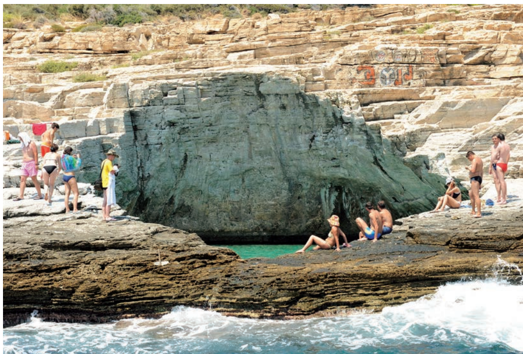
Η επονομαζόμενη γκιόλα, μια γαλανή φυσική πισίνα στην περιοχή της Αστρίδας.