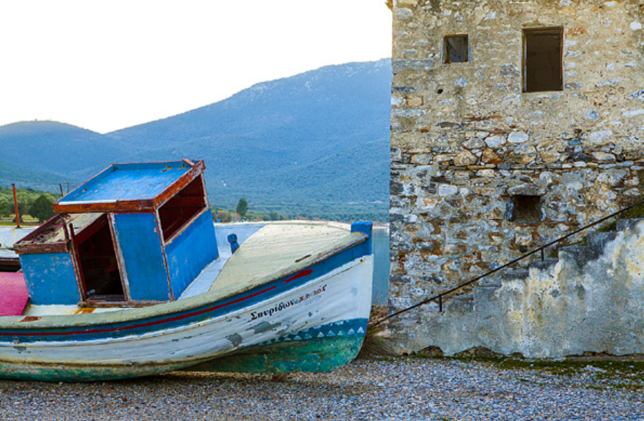
Απομεινάρι κτηρίου της πάλαι ποτέ Μονής Αγίας Τριάδας. Ώρες περιουλογής στα ακύμαντα νερά του όρμου – καθρέφτη, στις Νηες.