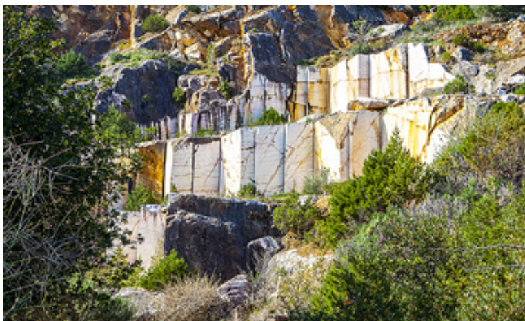
Δυο απόψεις της ακτογραμμής Νηες – Πηγάδι, στη μέση της οποίας ξεπροβάλλει ένα εγκαταλειμμένο νταμάρι μαρμάρου.